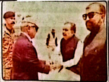
وزیراعظم شہباز شریف کا کونگرس کے سربراہان اور وزیر اعلیٰ بلوچستان استقبال کر رہے ہیں

ریاست دشمن عناصر، ان کے ہولناکیوں اور پاکستان کے خلاف سرگرم تمام دہشت گردیوں کو برہنہ کر دیا گیا ہے۔ انڈین کونگریس پارٹی کے سربراہان نے دہشت گردی کے قیام اور بلوچستان کے دشمن مستقبل کی جانب سے ایک فیصلہ کن پیش رفت ہے۔ اجلاس میں قومی اور صدارت کونگریس مشفقہ بلوچستان ایگنس کمیٹی کا