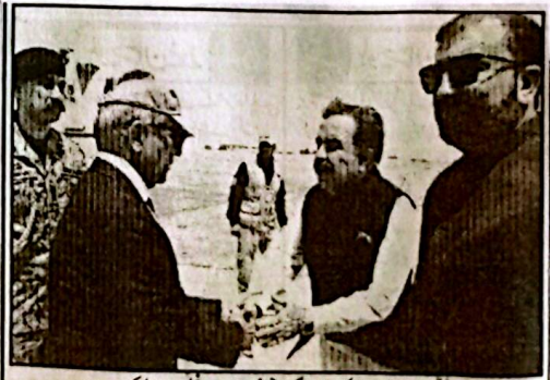
وزیراعظم شہباز شریف کا کوئٹہ آمد پر گورنر جنرل مسعودان کی استقبال کر رہے ہیں

نے اقوام متحدہ کے ہیڈ کوارٹرز میں اقوام متحدہ کے سیکرٹری جنرل انتونیو گوتیریس سے ملاقات کی جس میں علاقائی صورتحال اور بین الاقوامی امور پر تبادلہ خیال کیا گیا۔ ملاقات میں مغربی ایشیائی تنازعات کے خاتمے کیلئے پاکستان کی عاطفی کی کوششوں کے ساتھ اقوام متحدہ کے قیام امن خصوصاً پاکستان کی لازوال خدمات پر بھی بات چیت کی گئی۔ سیکرٹری جنرل اقوام متحدہ انتونیو گوتیریس نے پاکستان کی امن کیلئے کوششوں کو سراہا۔ اس موقع پر وزیراعظم نے اقوام متحدہ اور اقوام متحدہ کے باوجود پاکستان نے علاقائی امن و استحکام کو فروغ دینے اور انسانی جانوں کے تحفظ کیلئے ذمہ داری سے قیلتہ مارشل اور وزیراعظم شہباز شریف نے کردار ادا کیا۔ ان کا کہنا تھا کہ امن مشن کیلئے حقیقت پسندانہ مہمیں اور درکار وسائل تمام امن مشن کی کامیابی کیلئے ضروری ہیں۔ سیکرٹری جنرل اقوام متحدہ نے عالمی امن اور سلامتی کو برقرار رکھنے کے مقصد کے حصول کیلئے اقوام متحدہ کے قیام امن میں پاکستان کے طویل المدتی تعاون کا شکریہ ادا کیا۔