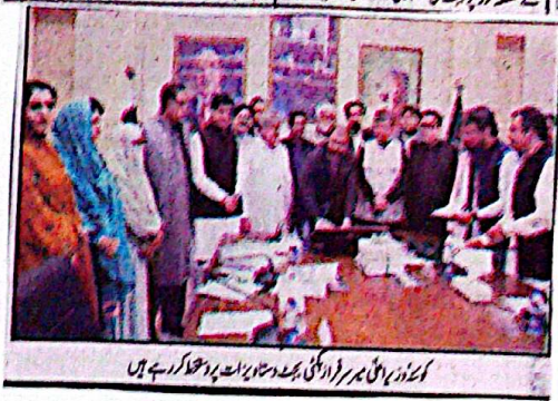
کونڈر براہی برسرِ فرادگی بیسٹ دستاویزات پر دستخط کر رہے ہیں

بلوچستان کا بیسہ، بیسٹ کی منظوری دی۔ بلوچستان کے عوام کی ترقی، ترقیاتی سروریات، عوامی توقعات اور معاشی استحکام کے تقاضوں سے ہم آہنگ ہے، بلوچستان کا بیسہ، بیسٹ کی منظوری دی۔