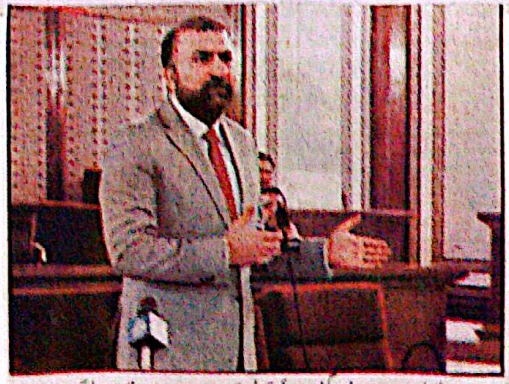
کوئی (مخبر) اور مہمانوں پر لڑائی سے لگاؤ کی باتوں میں کوئی اور کی طرف سے بجلی کے شعبے میں ہمد و دنیا لوجی کا استعمال، شلایٹ، کارکردگی اور صارفین کے اعتماد میں اضافے کا باعث بننے کا