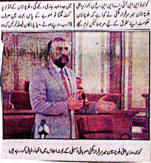
کے وزیر برقی بلوچستان سروسز اور گزٹ سہائی اسٹی کے بجٹ اجلاس میں اظہار خیال کر رہے ہیں

بلوچستان کے فنڈز پر کٹ لگتا تو صوبے کے پاس بجٹ میں صرف 9 ارب روپے ہوتے، میڈیا مالکان فیصلہ کریں کہ وہ قومی میڈیا ہیں یا کمرشل سٹریٹ میڈیا۔ عوام کو برقی کی بلا تعلق اور مستحکم رولٹیک کے ساتھ لڑائی یقینی بنانے کے لیے تمام دستیاب وسائل بروئے کار لائے جائیں۔