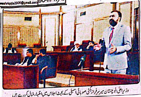
وزیر اعلیٰ بلوچستان میر سرفراز بھٹی صوبائی اسمبلی کے بجٹ اجلاس میں اظہارِ خیال کر رہے ہیں

بلوچستان میں میڈیا اور سوشل میڈیا کی عہد شکنی اور کابینہ کی عدم شمولیت کے بارے میں وزیر اعلیٰ بلوچستان میر سرفراز بھٹی نے ایک اجلاس میں خطاب کرتے ہوئے کہا کہ وفاقی وزیر اطلاعات اور دیگر کابینہ کے اراکین کو بلوچستان میں میڈیا اور سوشل میڈیا کی عہد شکنی اور کابینہ کی عدم شمولیت کے بارے میں باخبر رکھنا ضروری ہے۔