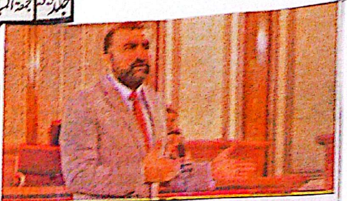
جج سے دستبردار کر دیا گیا اور ان کے جج کی جگہ پر جج کی مقرر کیا گیا

کوئٹہ (ڈان) اور اہلی بلوچستان سمر فرماز (کوسکو) کے بورڈ آف ڈائریکٹرز کے اجلاس میں جج سے دستبردار کر دیا گیا اور ان کے جج کی جگہ پر جج کی مقرر کیا گیا میڈیا اور سوشل میڈیا پر بلوچستان میں اپنی موجودگی برقرار رکھنی چاہئے سمر فرماز جج سوشلسٹ جماعت کی قیادت میں حکومت کو اس کے خاتمے کیلئے سوشلسٹ جماعت کی حمایت حاصل کی جائے اور کام کو ہدایت دیا جائے اور سوشلسٹ جماعت کی قیادت میں حکومت کو اس کے کوئٹہ (ڈان) اور اہلی بلوچستان سمر فرماز (کوسکو) کے بورڈ آف ڈائریکٹرز کے اجلاس میں جج سے دستبردار کر دیا گیا اور ان کے جج کی جگہ پر جج کی مقرر کیا گیا میڈیا اور سوشل میڈیا پر بلوچستان میں اپنی موجودگی برقرار رکھنی چاہئے سمر فرماز جج سوشلسٹ جماعت کی قیادت میں حکومت کو اس کے خاتمے کیلئے سوشلسٹ جماعت کی حمایت حاصل کی جائے اور کام کو ہدایت دیا جائے اور سوشلسٹ جماعت کی قیادت میں حکومت کو اس کے