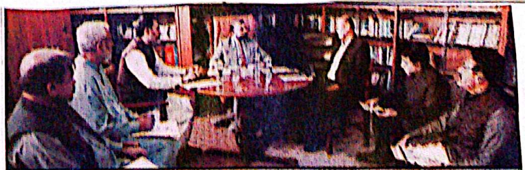
کوئی (مخبر) اور مہمانوں پر لڑائی سے لگاؤ کی باتوں میں کوئی اور کی طرف سے بجلی کے شعبے میں ہمد و دنیا لوجی کا استعمال، شلایٹ، کارکردگی اور صارفین کے اعتماد میں اضافے کا باعث بننے کا

لاہور آؤٹ ریس بلوچستان کے سب سے بڑے مسائل بننے والی کے ساتھ ساتھ ہمد و دنیا لوجی، کارکردگی اور صارفین کے اعتماد میں اضافے کا باعث بننے کا