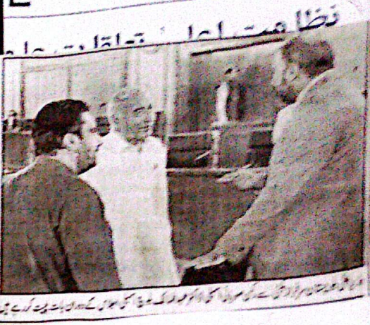
وزیر اعلیٰ بلوچستان میر مرتضیٰ خاں نے وزیر اعلیٰ گلگت بلتستان محمد رفیق بھٹی سے ملاقات کی اور گلگت بلتستان میں جاری امور پر تبادلہ خیال کیا۔

پر۔ 27۔ جمعہ 19 جون 2026ء بمطابق 03 محرم الحرام 1448ھ قیمت 20 روپے شمارہ نمبر۔ 164