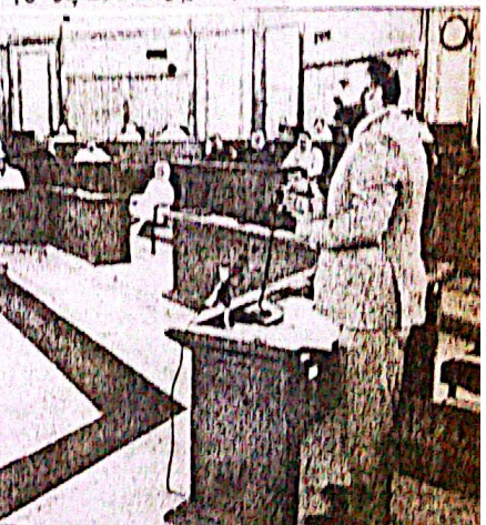
وزیر اعلیٰ بلوچستان سرگرمیوں کی سہولتوں کے لیے ایک انتہائی قابل، اصلاحات اور ترقی کارکن ہیں۔

بلوچستان میں سرگرمیوں کے لیے ایک انتہائی قابل، اصلاحات اور ترقی کارکن ہیں۔ بلوچستان میں سرگرمیوں کے لیے ایک انتہائی قابل، اصلاحات اور ترقی کارکن ہیں۔