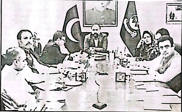
وزیر اعلیٰ بلوچستان سرفراز بلوچ نے وزیر تعلیم بلوچستان کو صوبائی کونسل کے اجلاس کی صدارت کر رہے ہیں