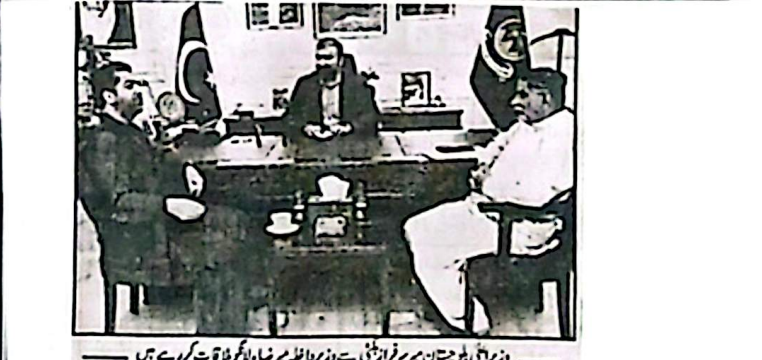
وزیر اعلیٰ بلوچستان سرفراز بلوچ نے وزیر تعلیم بلوچستان کو صوبائی کونسل کے اجلاس کی صدارت کر رہے ہیں