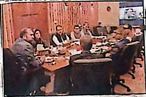
وزیر اعلیٰ بلوچستان میر فرخاندین نے ایک وفد کے ہمراہ ایک وفد کو بلوچستان کے مختلف اضلاع کا دورہ کیا۔

وزیر اعلیٰ بلوچستان میر فرخاندین نے ایک وفد کے ہمراہ ایک وفد کو بلوچستان کے مختلف اضلاع کا دورہ کیا۔ وفد نے مختلف اضلاع کے تعلیمی سہولیات کی فراہمی کے لیے عملی اور موثر اقدامات پر یقین رکھتی ہے۔