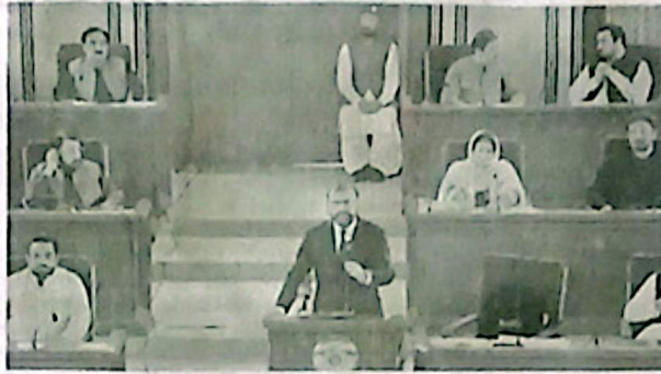
CM Bugti speaks at the provincial assembly budget session.

On education, he said 15,000 of 15,370 schools were operational, while the remaining 370 were built at unsuitable locations. He said the government