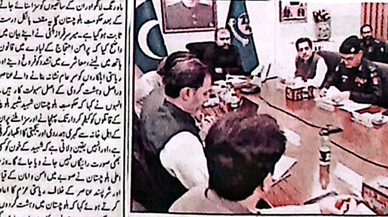
کوئٹہ: وزیر اعلیٰ بلوچستان سر سرفراز بھٹی محرم الحرام کے دوران قیام امن سے متعلق اعلیٰ سطحی اجلاس کی صدارت کر رہے ہیں۔

وزیر اعلیٰ بلوچستان سر سرفراز بھٹی نے تمام چیف منسٹرز اور ایس ایچ او کو خطاب کیا اور انہیں محرم الحرام کے دوران قیام امن کے لیے کیے گئے انتظامات اور سیکورٹی پلان پر جامع بریفنگ دی گئی۔