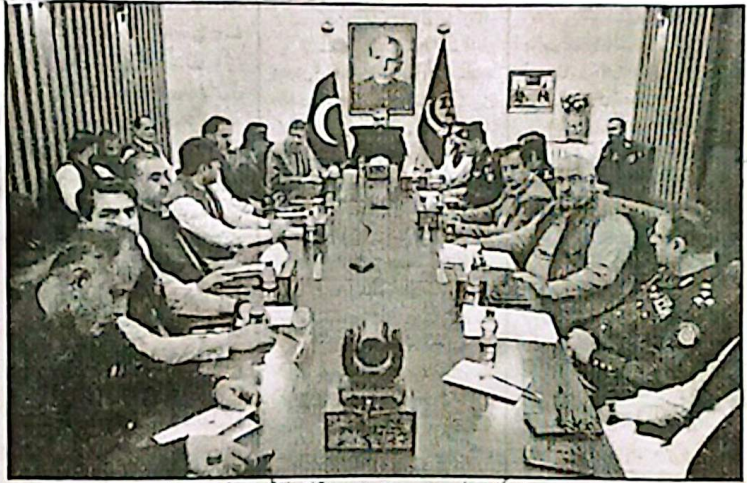
وزیر اعلیٰ بلوچستان میر سر فراد بگٹی کے دورانی قیام میں سے متعلق اعلیٰ سٹی اجلاس کی صدارت کر رہے ہیں۔

ڈیڑھ لاکھ روپے کی سزا اور ننگ لاکھوں کی ترقیاتی کاموں میں شہید شہیر بلوچ پر سنگ باری کی سزا سنائی گئی۔