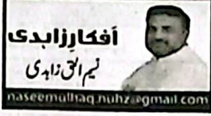
افکار زاہدی نیر اعلیٰ زاہدی