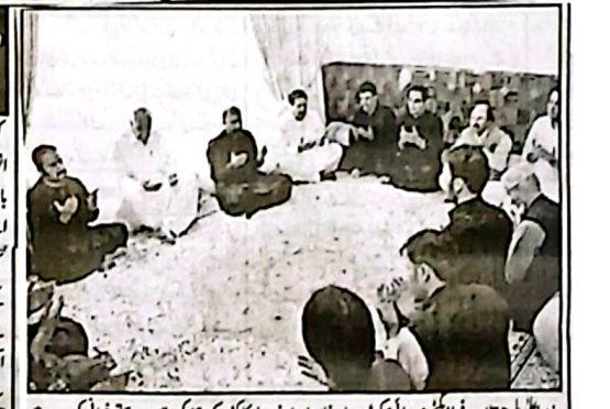
وزیر اعلیٰ بلوچستان سر سرفراز علی سہیلی بیکر پر باہر خان اور اسٹنڈ باؤ کا کڑے چھائی وقت پر قہر خوانی کر رہے ہیں

وزیر اعلیٰ سر سرفراز علی کا سیکرٹری سوانحیات تعمیرات باہر خان سے اظہار توجہ کوئٹہ (سان) وزیر اعلیٰ بلوچستان سر سرفراز علی انہوں نے کہا کہ انسانی جانوں کو بچانے میں نمایاں کردار ادا کرتے ہیں۔ صحت کے نظام کو مزید موثر اور عوام دوست بنانے کے لیے مختلف اقدامات پر عمل درآمد جاری ہے تاکہ ہر شہری کو بہتر طبی سہولیات میسر آسکیں، وزیر اعلیٰ بلوچستان نے کہا ہے کہ حکومت بلوچستان کی جانب سے شروع کی گئی سہولتوں کے سرخیوں کو (بجانب نمبر 8 صفحہ نمبر 2 پر)