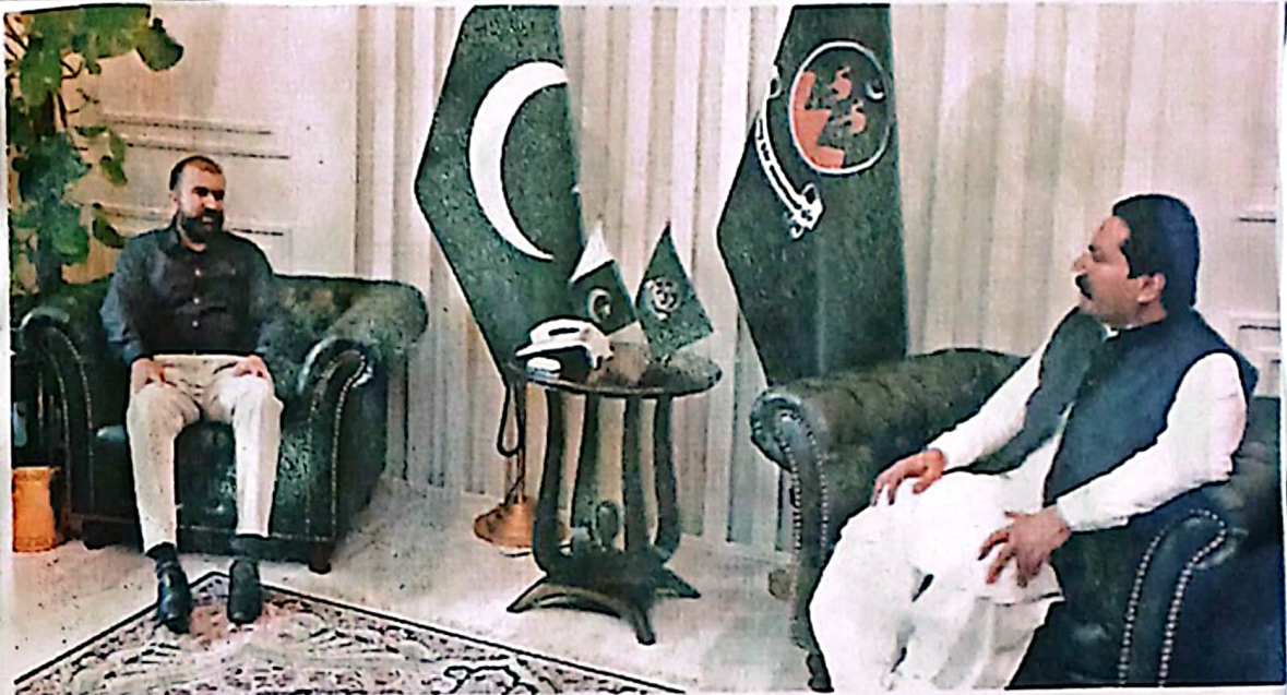
QUETTA: Chief Minister Mir Sarfraz Bugti exchanging views with Mir Sami Zarkoon during a meeting on Sunday.

Regd No. B.C.6 VOL XLV No. 1487 QUETTA Monday June 15, 2026 / Dhu'l-Hijjah 29, 1447