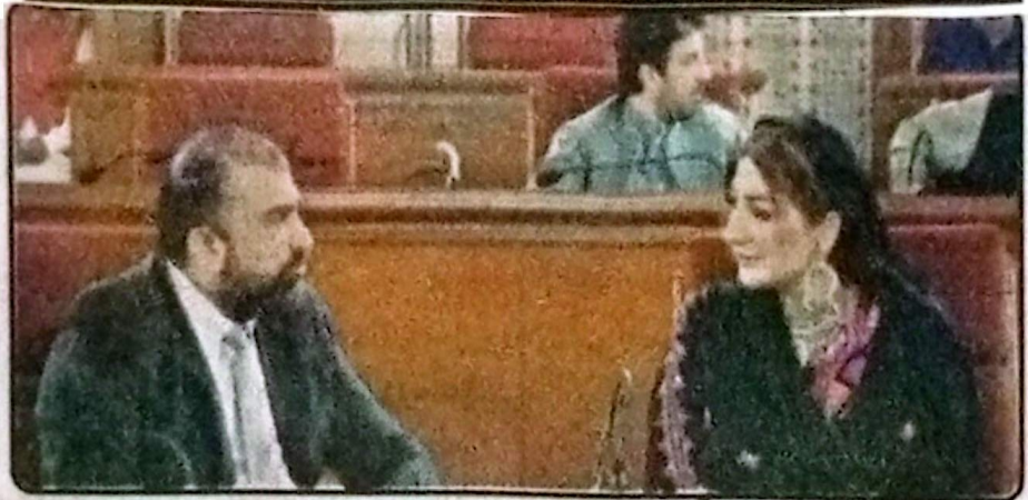
وزیر اعلیٰ میر سرفراز بگٹی اور فرخ عظیم شاہ اسمبلی اجلاس میں بات چیت کر رہی ہیں