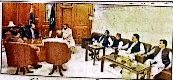
وزیر اعلیٰ بلوچستان میر سرفراز غمیزی سے صوبائی وزراء، پارلیمانی سیکرٹریز اور اراکین اسمبلی ملاقات کر رہے ہیں