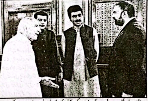
وزیر اعلیٰ سر فراز ایگٹی سے سوبائی وزیر محمد یونس ایگٹی اور ملک میں کا وفد ملاقات کر رہے ہیں