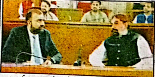
وزیر اعلیٰ میر فرزانہ سے صوبائی وزیر تعلیم و دیگر اعلیٰ اجلاس کے دوران بات چیت کر رہے ہیں

کی۔ ملاقات میں بلوچستان میں تعلیم و سماجی ترقی کے جاری اقدامات، حکومت اور مقامی کمیٹی کے درمیان اشتراکِ کار اور مستقبل کے ترقیاتی امکانات پر تفصیلی تبادلہ خیال کیا گیا۔ وفد نے علاقے میں تعلیم کے فروغ اور سماجی بہتری کے لیے مقامی سازگار کئے جانے والے غیر سرکاری اقدامات سے وزیر اعلیٰ کو آگاہ کیا اس موقع پر وزیر اعلیٰ بلوچستان نے بلوچستان میں کمیٹی کی شراکت داری کے ذریعے تفصیلی و سماجی شعبوں میں ہونے والی نمایاں پیش رفت کو سراہتے ہوئے اطمینان کا اظہار کیا