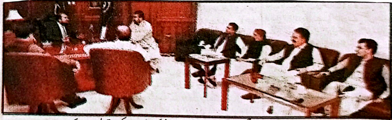
کوئٹہ، وزیر اعلیٰ بلوچستان میر سرفراز بگٹی سے صوبائی وزراء، پارلیمانی سیکرٹریز اور اراکین اسمبلی ملاقات کر رہے ہیں

کوئٹہ (خ) وزیر اعلیٰ بلوچستان میر سرفراز بگٹی سے وفد کی ملاقات کی۔ ملاقات میں گلستان میں تعلیمی و سماجی ترقی کے جاری اقدامات، حکومت اور مقامی سرکار احمد خان غمبیزی کی قیادت میں ایک اہم وفد کیونٹی کے درمیان اشتراک کار اور مستقبل کے ترقیاتی امکانات پر تفصیلی تبادلہ خیال کیا گیا وفد نے علاقے میں تعلیم کے فروغ اور سماجی بہتری کے لیے مقامی سطح پر کیے جانے والے غیر سرکاری اقدامات سے وزیر اعلیٰ کو آگاہ کیا اس موقع پر وزیر اعلیٰ بلوچستان نے گلستان میں کیونٹی کی شراکت داری کے ذریعے تعلیمی و سماجی شعبوں میں ہونے والی نمایاں پیش رفت کو سراہتے ہوئے اطمینان کا اظہار کیا وزیر اعلیٰ میر سرفراز بگٹی نے کہا کہ تعلیم اور سماجی ترقی کے شعبوں میں نجی و کیونٹی اقدامات نہ صرف قابل تحسین ہیں بلکہ یہ حکومتی اداروں کے ساتھ مل کر پائیدار ترقی کی بنیاد فراہم کرتے ہیں انہوں نے کہا کہ حکومت ایسے تمام مثبت اقدامات کی بھرپور حوصلہ افزائی اور ہر ممکن سرپرستی جاری رکھے گی۔