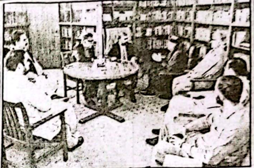
وزیر اعلیٰ سر فراز ایگٹی سے سر دار احمد خان غیرتی کی قیادت میں ملک میں کا وفد ملاقات کر رہے ہیں

تعلیمی و سماجی خدمات میں عوامی شراکت سے ترقیاتی عمل مزید موثر ہوگا سر دار احمد خان غیرتی کی قیادت میں وفد سے گفتگو