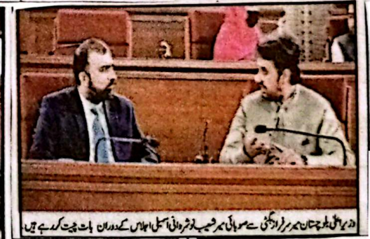
وزیر اعلیٰ بلوچستان نے کہا کہ تعلیمی اور سماجی ترقی کے شعبوں میں بھی دیکھنی اقدامات نہ صرف قابل تحسین ہیں بلکہ یہ سکھاتی اداروں کے ساتھ مل کر پائیدار ترقی کی بنیاد فراہم کرتے ہیں حکومت ایسے تمام مثبت اقدامات کی بھرپور جھڑپ کر رہی ہے اور ہر ممکن سرپرستی جاری رکھے گی، وزیر اعلیٰ بلوچستان