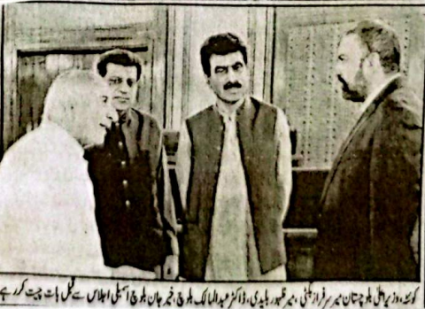
کوئٹہ وزیر اعلیٰ بلوچستان میر سرفراز رحمانہ، دارالحرمین شیخوئی، وزیر اعلیٰ بلوچستان میر سرفراز رحمانہ کی قیادت میں ایک اہم اجلاس سے جسکو یہاں گنجان کے ممتاز قبائلی رہنما و وفد نے ملاقات کی۔ ملاقات میں گنجان میں تعلیمی اور (بقیہ نمبر 10 صفحہ 2 پر)