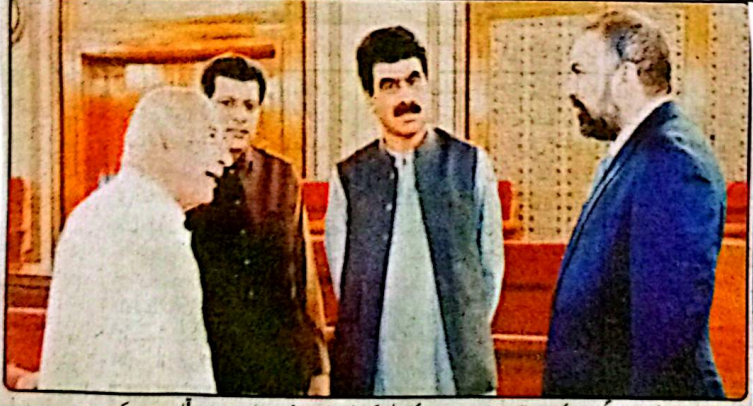
وزیر اعلیٰ میر فرزانہ صوبائی وزیر برائے تعلیم و دیگر اعلیٰ اجلاس کے دوران بلوچ اور سرحد بلوچ اجلاس سے بات چیت کر رہے ہیں