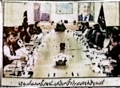
بلوچستان میں سربراہی کی ذمہ داری سوبائی کابینہ کا ایک اہم اجلاس منعقد ہوا جس میں حوامی مشاور، انتظامی اصلاحات، بلدیاتی نظام، قانون و انصاف، ترقیاتی منصوبوں، صحت، بین الاقوامی تجارت اور گورنمنٹ سے متعلق متعدد اہم فیصلوں کی منظوری دی گئی۔

بلوچستان میں سربراہی کی ذمہ داری سوبائی کابینہ کا ایک اہم اجلاس چیف منسٹر کی زیر قیادت منعقد ہوا جس میں حوامی مشاور، انتظامی اصلاحات، بلدیاتی نظام، قانون و انصاف، ترقیاتی منصوبوں، صحت، بین الاقوامی تجارت اور گورنمنٹ سے متعلق متعدد اہم فیصلوں کی منظوری دی گئی۔