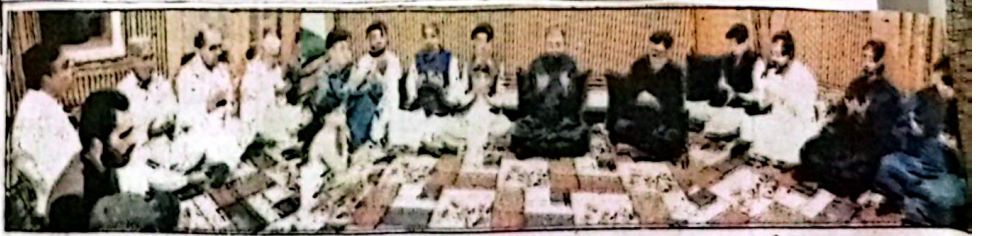
بلوچستان میں سربراہی کی ذمہ داری سوبائی کابینہ کا ایک اہم اجلاس منعقد ہوا جس میں حوامی مشاور، انتظامی اصلاحات، بلدیاتی نظام، قانون و انصاف، ترقیاتی منصوبوں، صحت، بین الاقوامی تجارت اور گورنمنٹ سے متعلق متعدد اہم فیصلوں کی منظوری دی گئی۔

بلوچستان میں سربراہی کی ذمہ داری سوبائی کابینہ کا ایک اہم اجلاس چیف منسٹر کی زیر قیادت منعقد ہوا جس میں حوامی مشاور، انتظامی اصلاحات، بلدیاتی نظام، قانون و انصاف، ترقیاتی منصوبوں، صحت، بین الاقوامی تجارت اور گورنمنٹ سے متعلق متعدد اہم فیصلوں کی منظوری دی گئی۔