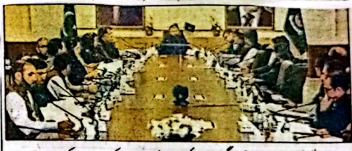
وزیر اعلیٰ بلوچستان میر سر فرزا زنگی صوبائی کابینہ کے اجلاس کی صدارت کر رہے ہیں