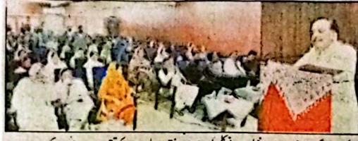
کوئٹہ: گورنر جنعفر خان مندوخیل ایرانی مچل سینٹر میں دختران بلوچستان کی تقریب سے خطاب کر رہے ہیں

کوئٹہ (ن) گورنر بلوچستان جنعفر خان مندوخیل نے کہا کہ میں شروعات سے خواتین کیلئے معیاری تعلیم اور ترقی کا پرزور حامی رہا ہوں۔ میں