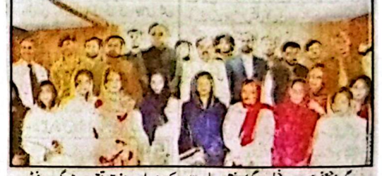
گورنر جنعفر خان مندوخیل و دیگر کا دختران بلوچستان کے حوالے سے منعقدہ تقریب میں گروپ فوٹو

بلوچستان کی خواتین صلاحیتوں میں کسی سے کم نہیں، گورنر