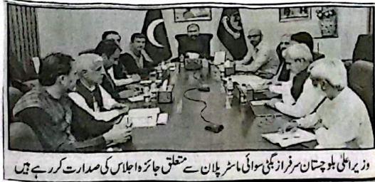
وزیر اعلیٰ بلوچستان سر فرزان میر سواتی ماسٹر پلان سے متعلق جائزہ اجلاس کی صدارت کر رہے ہیں