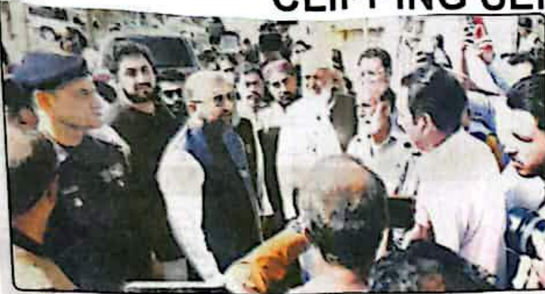
گورنر بلوچستان سردار خان کھنہ اعلیٰ کے موقع پر سانحہ چمکن پھانگ کے متاثرین سے بھجیے کا اظہار کر رہے ہیں