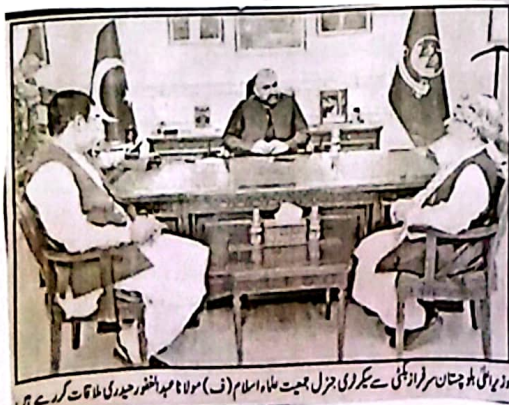
وزیر اعلیٰ بلوچستان سر فرزانہ بیگم سے سیکرٹری جنرل جمعیت علماء اسلام (ف) مولانا عبدالغفور حیدری کی ملاقات کر رہے ہیں