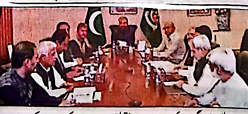
وزیر اعلیٰ سر فراز بگٹی سوئی ماسٹر پلان سے متعلق جائزہ اجلاس کی صدارت کر رہے ہیں

پیشہ ورانہ صلاحیتوں اور قربانیوں کو خراج تحسین پیش کیا ہے۔ ایک بیان میں وزیر اعلیٰ بلوچستان نے کہا کہ سیکورٹی فورسز نے ہمت اور سہرا کاروائیوں کے ذریعے دہشت گرد عناصر کے مذہم مزاج کامیابیاں حاصل کی ہیں۔ صوبے کے امن و استحکام کے خلاف سرگرمیوں کو روکنا اور ہلاکتوں کو کم کرنے کے لیے سیکورٹی فورسز کو ترقی دینا اور ان کے کاموں کو سہولت دینا ضروری ہے۔ وزیر اعلیٰ نے ہدایت کی کہ حکومت کو ہوشیار رہنا چاہیے اور دہشت گردوں کو ہراسہ دینا چاہیے۔ وزیر اعلیٰ نے کہا کہ حکومت کو ہوشیار رہنا چاہیے اور دہشت گردوں کو ہراسہ دینا چاہیے۔ وزیر اعلیٰ نے کہا کہ حکومت کو ہوشیار رہنا چاہیے اور دہشت گردوں کو ہراسہ دینا چاہیے۔