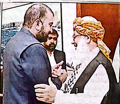
وزیر اعلیٰ بلوچستان سر فراز بگٹی سے سیکرٹری جنرل جمعیت علماء اسلام (ف) رکن قومی اسمبلی مولانا عبدالغفور حیدری مصافحہ کر رہے ہیں

کوئٹہ (رخ) وزیر اعلیٰ بلوچستان سر فراز بگٹی نے وزیر اعلیٰ بلوچستان سر فراز بگٹی کی زیر صدارت سوئی ماسٹر پلان پر پیش رفت کا جائزہ اجلاس چیف منسٹر سیکرٹریٹ میں منعقد ہوا جس میں