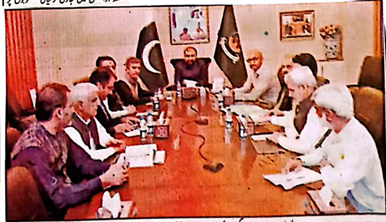
وزیر اعلیٰ بلوچستان میرسر فرادیکٹی سوئی ماسٹر پلان سے متعلق جائزہ اجلاس کی صدارت کر رہے ہیں

کوئٹہ (ای این این) وزیر اعلیٰ بلوچستان میرسر فرادیکٹی کی زیر صدارت سوئی ماسٹر پلان پر پیش رفت کا جائزہ اجلاس منگل کو یہاں چیف مشنریگریٹ میں منعقد ہوا جس میں جاری ترقیاتی منصوبوں پر عملدرآمد کا تفصیلی جائزہ لیا گیا اجلاس میں شہری آبادی کے تحفظ اور ماحولیاتی بہتری کے لیے اہم اقدامات کی منظوری دی گئی کیونکہ اسٹیک کو شہری آبادی سے دور نکل کرنے کا فیصلہ کرتے ہوئے متعلقہ حکام کو اس پر عملدرآمد کی رفتار مزید تیز کرنے کی ہدایت کی گئی وزیر اعلیٰ بلوچستان نے سوئی شہر میں آبی قلت پر توشیح کا اظہار کرتے ہوئے پینے کے صاف پانی کی فراہمی ہر صورت ترجیحی بنیادوں پر یقینی بنانے کی ہدایت کی انہوں نے کہا کہ شہریوں کے دوران ہر شہری تک پانی کی پلاٹن فراہمی یقینی بنائی جائے اس حوالے سے کسی قسم کی غفلت برداشت نہیں کی جائے گی وزیر اعلیٰ نے سول انجینئریشن اور پبلک ہیلتھ انجینئرنگ ڈیپارٹمنٹ کو باہمی رابطے سے فوری اور موثر اقدامات کرنے کی ہدایت کی انہوں نے سوئی ماسٹر پلان پر عملدرآمد کی رفتار مزید تیز کرنے اور تمام منصوبے متروک نہ رہیں عملی کرنے پر زور دیا وزیر اعلیٰ بلوچستان میرسر فرادیکٹی نے ہدایت کی کہ شہریوں کو بنیادی سہولیات کی فراہمی جلد از جلد یقینی بنائی جائے تاکہ عوامی مسائل کا مستقل بنیادوں پر حل ممکن ہو سکے۔ مزید وزیر اعلیٰ بلوچستان میرسر فرادیکٹی کی زیر صدارت منگل کے روز چیف مشنریگریٹ کوئٹہ میں