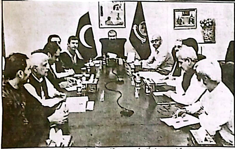
وزیر اعلیٰ بلوچستان میر فرزانہ سولٹی ماسٹر پلان سے متعلق جائزہ اجلاس کی صدارت کر رہے ہیں

منصوبوں کے شرات عوام تک پہنچنے چاہئیں معیار پر کسی قسم کا سمجھوتہ نہ کیا جائے، اجلاس سے خطاب سولٹی ماسٹر پلان پر پیش رفت کا جائزہ اجلاس، برصغیر کے دوران ہر شہری تک پائی کی بااعتماد فریڈمز میگزین کی جائزہ فرمائیں اور اس کی اصلاحات