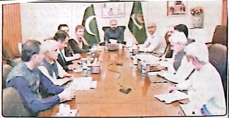
وزیر اعلیٰ بلوچستان سے مولانا حیدری سے ملاقات، مختلف امور پر گفتگو

وزیر اعلیٰ سے مولانا حیدری کی ملاقات، مختلف امور پر گفتگو قومی مسائل کے حل برقیاتی منصوبوں کے فروغ کیلئے کوششوں پر زور کوئٹہ (17 نومبر) بلوچستان کے وزیر اعلیٰ مولانا محسن ہاشمی نے مولانا حیدری سے ملاقات کی اور قومی مسائل کے حل برقیاتی منصوبوں کے فروغ کیلئے کوششوں پر زور دیا۔ مولانا حیدری نے مولانا ہاشمی سے مختلف امور پر گفتگو کی اور ان کے حل برقیاتی منصوبوں کے فروغ کیلئے کوششوں پر زور دیا۔