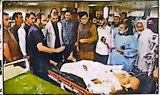
وزیر اعلیٰ بلوچستان سرسبز اور کئی ٹرانا سنٹر ہسپتال کوئٹہ میں محکمہ صحت کے کام کو ہم دھاک میں زخمی ہونیوالے مریض کو بہترین طبی سہولیات فراہم کرنے کی ہدایت دے رہے ہیں