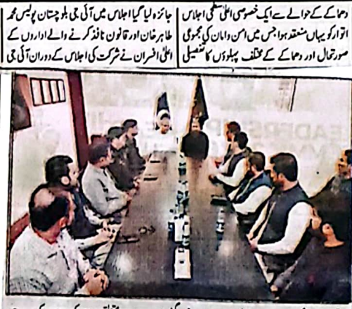
وفاقی وزیر داخلہ محسن نقوی اور وزیر اعلیٰ بلوچستان سرفراز بگٹی امن وامان سے متعلق اجلاس کی صدارت کر رہے ہیں

دھماکے کے حوالے سے ایک خصوصی اعلیٰ اجلاس اتوار کو یہاں منعقد ہوا جس میں امن وامان کی مجموعی صورتحال اور دھماکے کے مختلف پہلوؤں کا تفصیلی