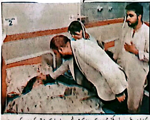
کوئٹہ وزیر اعلیٰ میر سرفراز بھٹی جنم بچانک دھماکے میں زخمی ہونے والی ایک نارتون کی عیادت کر رہے ہیں