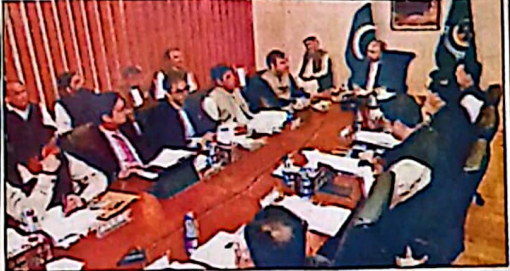
وزیر اعلیٰ سربراہان کی پروائل ڈیر اسپینسرنگ کیشن کے اجلاس کی صدارت کر رہے ہیں

میں صوبے کو پیش کنندہ قدرتی آفات، سون سون پارشل، سیلابی صورتحال، سٹیٹ ڈیو غیر معمولی سکی تصویرت سے منظر کیلئے تیار ہیں کا اہمیت پانہ لیا گیا اجلاس کو متعلقہ حکام اور اہل کار کی جانب سے ہر ملک دیتے ہوئے تیار کیا گیا کہ ماسکی موسمیاتی تبدیلیوں کے اثرات کے باعث بلوچستان میں اسلج ہجرت 53 ڈگری سینٹی گریڈ تک جانے کا خدشہ ہے جبکہ گلاٹ برسٹ کے بعد اچانک سٹیٹ برسٹ جیسے غیر معمولی سکی خطرہ بھی پیدا ہو سکتے ہیں، جو شمالی جاتوں اور جنابی اوجھلے کیلئے سنگین چیلنج بن سکتے ہیں اجلاس میں ہدایت کی گئی کہ تمام متعلقہ ادارے اپنی اہمیت پر ہیں اور تفصیلی اقدامات برصورت مکمل کر کے جائیں تاکہ سکی ہنگامی صورتحال سے بھرت اور سٹر ایمل میں نفاذ جانے سکتے بلوچستان نے ہنگامی حالات سے نمٹنے کیلئے 7500 ملین روپے کے فنڈز کی منظوری بھی دے دی ہے جس کے تحت ریسک اور ریلیف اور سکی سروسز کو فوری طور پر فعال بنایا جائے گا اجلاس میں فیصلہ کیا گیا کہ ڈیو جن اور سٹیٹ سٹیٹ ڈیو ایمل سے دفاعی سروسز اور فعال رکھا جائے گا جبکہ ریسک میٹری، جیسے، ایویاٹ، خداک اور دیگر ضروری سامان کی دستیابی یقینی بنائی جائے گی اسی طرح صوبے بھر کے تمام اضلاع میں 1122 ریسک سیزو کو فعال کرنے کا فیصلہ کیا گیا جبکہ آئندہ سرطے میں تفصیلی سٹیٹ ڈیو ریسک مرکز قائم کیے جائیں گے تاکہ کوئی حادثہ نہیں کوڑے سوز بنایا جاسکے