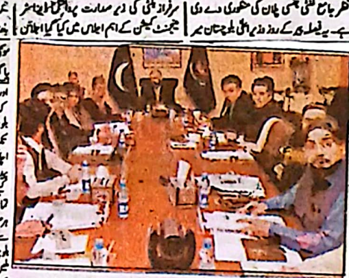
کوئٹہ میں بلوچستان سرور فرادینی برہانگیہ راجیو سٹیجنگ کی مخالفت کی گئی

سرحد میں کنگڈول آگت میں ملتا ہوا بلوچستان کی صورت حال پر وزیراعلیٰ نے سٹیجنگ کی مخالفت کی گئی۔