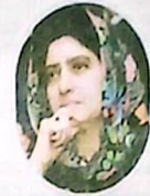
Raheela Hameed Khan Durrani

Honourable Education Minister Balochistan