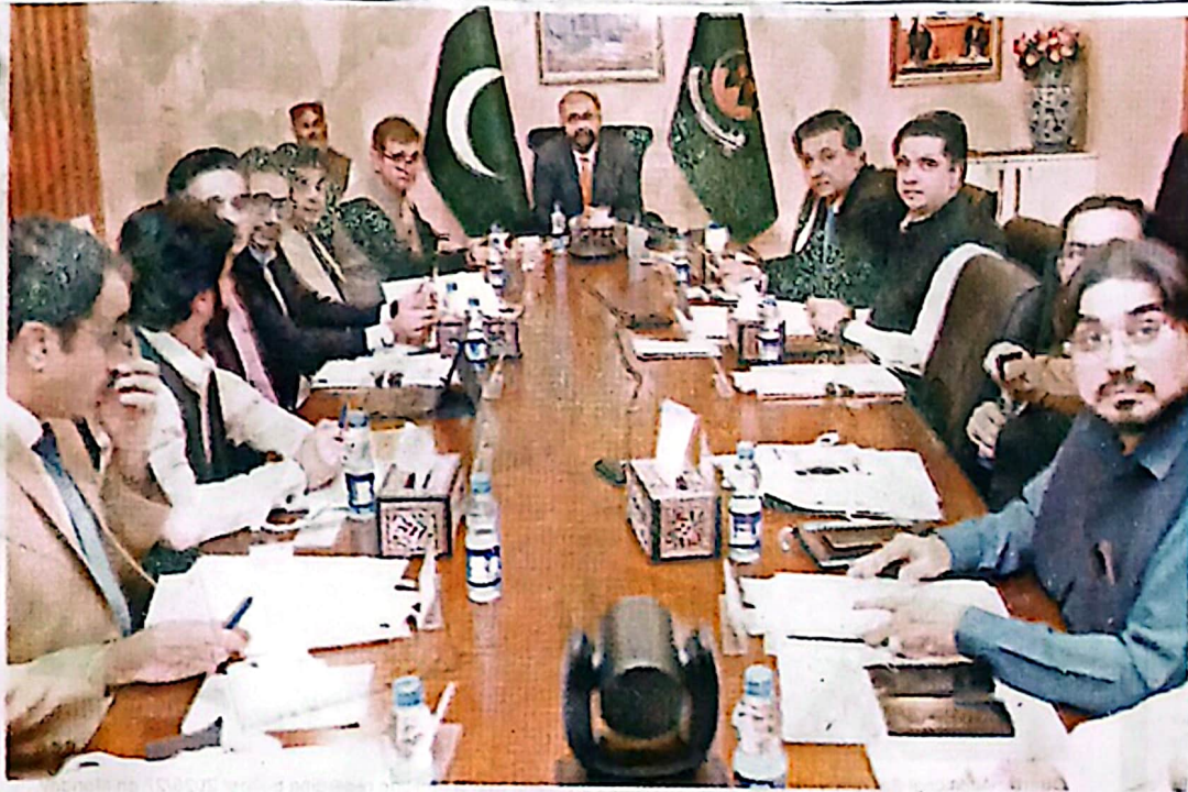
QUETTA: Chief Minister Mir Sarfraz Bugti presiding over a meeting to approve contingency plan on Monday.