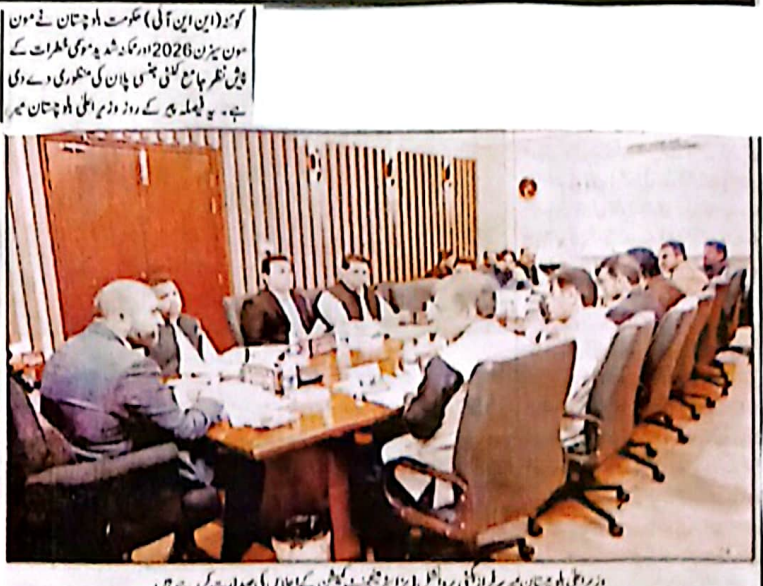
سربراہ اعلیٰ اور سربراہ اعلیٰ کے اجلاس میں سربراہ اعلیٰ نے کہا کہ بلوچستان میں مون سون سیزن کے آغاز کے ساتھ ہی شدید گرمیوں کا آغاز ہو گا۔ اس کے باعث درجہ حرارت 53 ڈگری سینٹی گریڈ تک جانے کا خدشہ ہے۔ اس کے علاوہ شدید موسمی خطرات کا بھی خدشہ ہے۔

کوئٹہ (ای این آئی) حکومت بلوچستان نے مون سون سیزن 2026ء کے شدید موسمی خطرات کے پیش نظر جامع کٹھنی جنسی پلان کی منظوری دے دی ہے۔ یہ فیصلہ یو کے روزنامہ ایشیا بلوچستان میں شائع ہوا ہے۔ سربراہ اعلیٰ اور سربراہ اعلیٰ کے اجلاس میں سربراہ اعلیٰ نے کہا کہ بلوچستان میں مون سون سیزن کے آغاز کے ساتھ ہی شدید گرمیوں کا آغاز ہو گا۔ اس کے باعث درجہ حرارت 53 ڈگری سینٹی گریڈ تک جانے کا خدشہ ہے۔ اس کے علاوہ شدید موسمی خطرات کا بھی خدشہ ہے۔ سربراہ اعلیٰ نے کہا کہ حکومت بلوچستان نے ممکنہ خطرات کو پیش نظر جامع کٹھنی جنسی پلان کی منظوری دے دی ہے۔ اس کے تحت مختلف اداروں اور محکموں میں کامیابی سے عمل درآمد کیا جائے گا۔ سربراہ اعلیٰ نے کہا کہ حکومت بلوچستان نے ممکنہ خطرات کو پیش نظر جامع کٹھنی جنسی پلان کی منظوری دے دی ہے۔ اس کے تحت مختلف اداروں اور محکموں میں کامیابی سے عمل درآمد کیا جائے گا۔