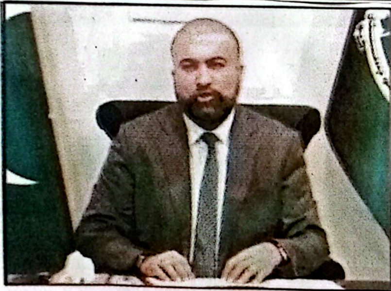
کوئٹہ، وزیر اعلیٰ بلوچستان میر سرفراز بکٹی معرکہ حق کے حوالے سے پیغام جاری کر رہے ہیں

پاکستان ایک مضبوط، خود مختار اور باوقار ریاست ہے جو اپنے دفاع، سلامتی اور قومی مفادات کے تحفظ کے لیے ہر سطح پر مکمل طور پر تیار ہے بلوچستان کے عوام ملکی دفاع، سلامتی اور استحکام کے لیے ہمیشہ صفا اول میں کھڑے رہے ہیں، میر سرفراز بکٹی کا معرکہ حق پر خصوصی پیغام