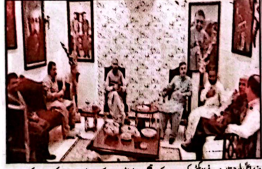
وزیر اعلیٰ بلوچستان میرسرفراز کبٹی نیکو دورے کے موقع پر جاری منصوبوں کے حوالے سے اجلاس کی صدارت کر رہے ہیں

نیکو اپر ڈیرہ کبٹی، کوئٹہ (این این آئی) وزیر اعلیٰ بلوچستان میرسرفراز کبٹی جسمرات کو ایک روزہ دورے پر نیکو اپر ڈیرہ کبٹی پہنچے جہاں انہوں نے