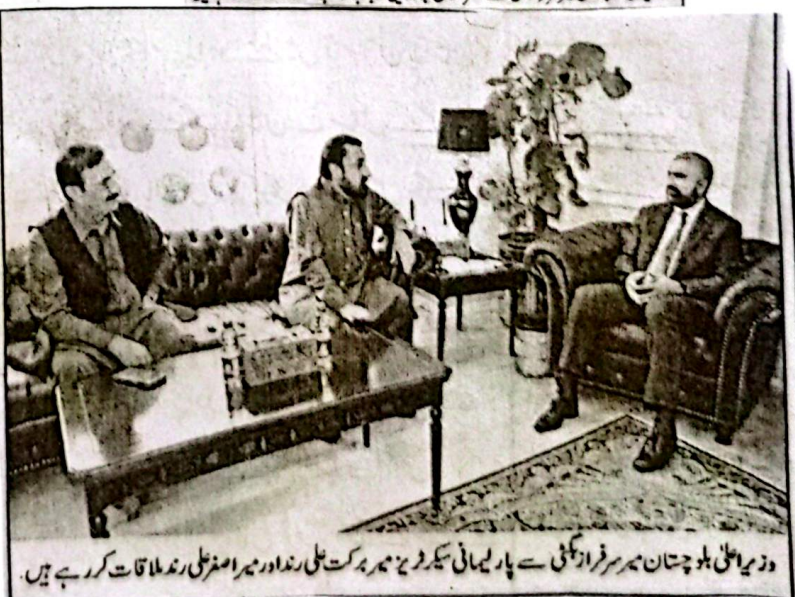
وزیر اعلیٰ بلوچستان میر فرزابگٹ سے پارلیمانی سیکرٹری جنرل میر برکت علی رند اور میر اصغر علی رند کی ملاقات کر رہے ہیں۔