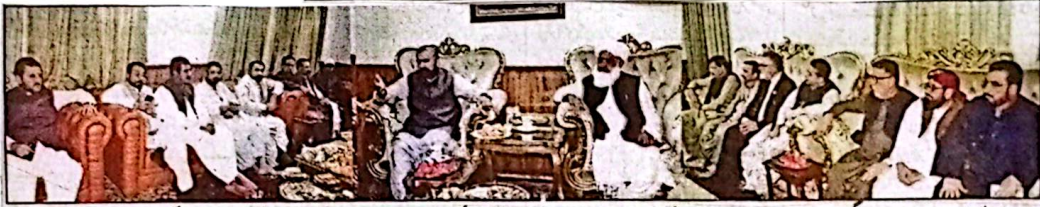
وزیر اعلیٰ بلوچستان میر سر فرادین کی جمعیت علماء اسلام کے صوبائی امیر مولانا عبدالواسع سے ان کی رہائش گاہ پر ملاقات کر رہے ہیں، صوبائی وزراء اور اراکین اسمبلی بھی موجود ہیں

پاکستان کے 11 شہروں سے بیک وقت شائع ہونے والا واحد اخبار جلد 24 نمبر 145 | جمعہ المبارک، 20 اگست 2026ء، صفحہ 6 قیمت 40 روپے