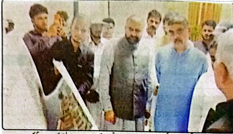
بیکو وزیر اعلیٰ میر فرزانہ کی کمر ٹھام تھام ڈھکی میوریل ہسپتال کے دورے کے موقع پر بریڈنگ وی جہادی ہے، انوار الحق کا نواسی خالد لاٹو بھی موجود ہیں