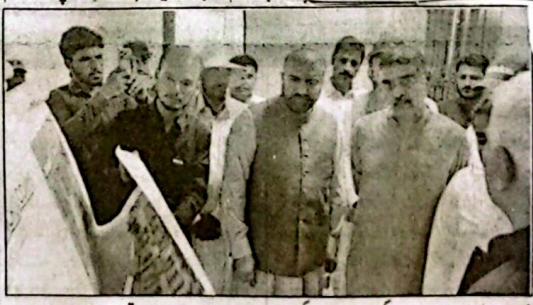
بیکو اہر ڈیرہ بھٹی کا دورہ، عوامی مسائل، جاری ترقیاتی منصوبوں اور بنیادی سہولیات کی فراہمی سے متعلق امور کا تفصیلی جائزہ لیا بیکو اہر ڈیرہ بھٹی (خ) وزیر اعلیٰ بلوچستان میر سرفراز بھٹی نے جمعرات کو ایک روزہ دورے پر بیکو اہر ڈیرہ بھٹی پہنچے جہاں انہوں نے عوامی مسائل، جاری

ایک کے اتحادی دوستوں نے مولانا عبد الواسع سے دس دن کی مہلت طلب کی ہے تاکہ اپہنل پارٹی قیادت کو امتحان دینا لیا جاسکے کیونکہ بنیادی طور پر یہ فیڈریشن سے متعلق قانون سازی ہے جس کو اب صوبائی اسمبلی میں آتا ہے انہوں نے اس امید کا اظہار کیا کہ بلوچستان اسمبلی میں اتفاق رائے سے قانون سازی کے لیے اقدامات کیے جائیں گے اور ان شاء اللہ یہ معاملہ باہمی مشاورت اور افہام و تفہیم سے حل ہو جائے گا۔ انہوں نے جمعیت علماء اسلام کی قیادت کا شکریہ ادا کرتے ہوئے کہا کہ جمعیت کی قیادت نے ہمیشہ عزت، احترام اور شفقت دی وزیر اعلیٰ بلوچستان نے کہا کہ دینی مدارس ہمارے معاشرے کا اہم حصہ ہیں اور ہم انہیں ہمیشہ دل کے قریب رکھتے ہیں۔