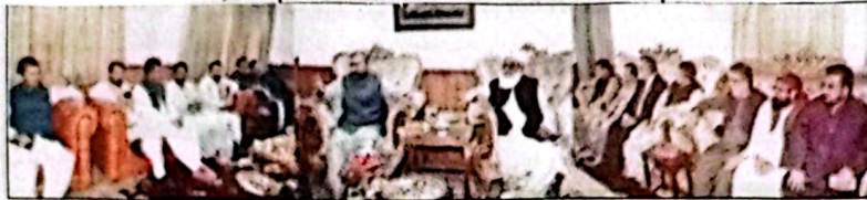
کوئٹہ، وزیر اعلیٰ سر فراز مینٹی جمیٹ کے صوبائی امیر مولانا امجدالوداع سے ملاقات کر رہے ہیں

جلد نمبر 32 جمعہ 08 مئی 2026ء بمطابق 20 ذوالحجۃ 1447ھ شمارہ نمبر 126