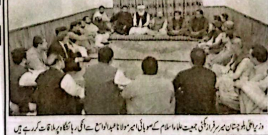
وزیر اعلیٰ بلوچستان میر سرفراز بھٹی جمعیت علماء اسلام کے صوبائی امیر مولانا عبد الواسع سے اگلی رات ملاقات کر رہے ہیں