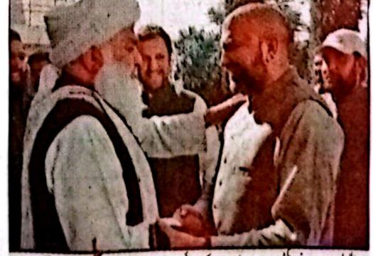
وزیر اعلیٰ بلوچستان میرسرفراز کبٹی سے جمعیت علماء اسلام کے صوبائی امیر مولانا عبدالواحد اعظمی، پاشا کوٹلی کے چیف پرموٹرز کے ہیں