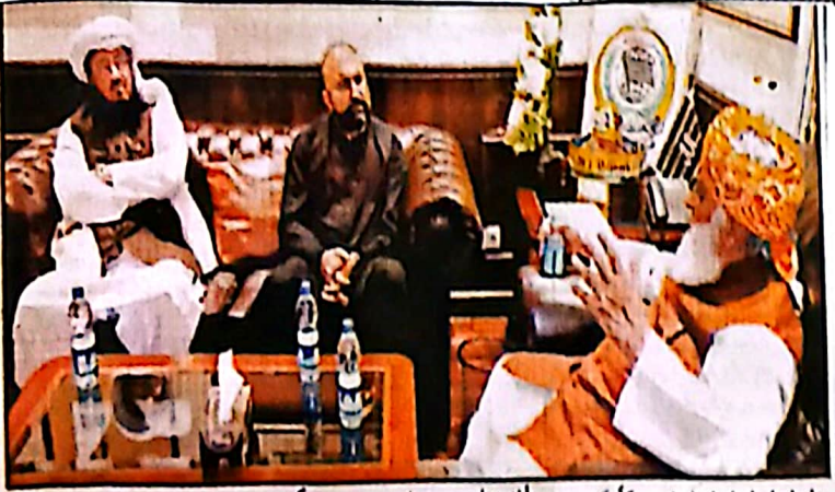
وزیر اعلیٰ سر فراز بگٹی نے مولانا فضل الرحمن سے ملاقات کر کے برائیاں حل کرنے کے لیے

اسلام آباد (انٹرنیشنل پبلسیشن ہاؤس) وزیر اعلیٰ سر فراز بگٹی نے جمعیت علمائے اسلام (ب) کے سربراہ مولانا فضل الرحمن سے ان کی رہائش گاہ پر اہم ملاقات کی، جس میں صوبائی قیادت کی صوبائی صوبائی اور امن و امان کے امور پر تفصیلی تبادلہ خیال کیا گیا۔ ملاقات کے دوران وزیر اعلیٰ نے مولانا فضل الرحمن سے عدالتوں سے پیدا ہونے والے مختلف مسائل اور مشکلات پر بحث کی۔ انہوں نے عدالتوں سے پیدا ہونے والے مسائل اور مشکلات پر بحث کی۔ انہوں نے عدالتوں سے پیدا ہونے والے مسائل اور مشکلات پر بحث کی۔ انہوں نے عدالتوں سے پیدا ہونے والے مسائل اور مشکلات پر بحث کی۔