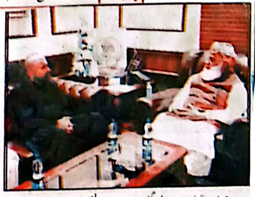
وزیر اعلیٰ سرگراز کوئی کی قائمہ قیمت مواصلات اعلیٰ اور ان سے اہم مذاکرات