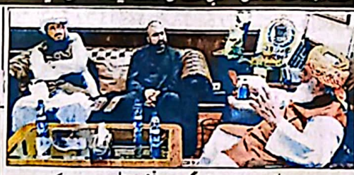
اسلام آباد، دزیرانی بلوچستان سرسرازی گئی مولانا فضل الرحمن سے ملاقات کر رہے ہیں

اسلام آباد (خ) دزیرانی بلوچستان سرسرازی گئی نے جمیت علماء اسلام (ف) کے سربراہ مولانا فضل الرحمن کی رہائش گاہ (پانی پتہ 5 نمبر 8) کا اسلام آباد میں سے اہم ملاقات کی جس میں بلوچستان کی جمہوری سیاسی سوسائٹی، امن دان اور عالی جنس رہت پر تفصیلی تبادلہ خیال کیا گیا ملاقات کے دوران دونوں رہنماؤں نے صوبے میں امن و استحکام کے قیام، سیاسی ہم آہنگی کے فروغ اور مختلف قومی و مقامی امور پر بھی گفتگو کی۔ اس موقع پر دزیرانی نے دیا بلکہ قومی دفاع اور دفاعی صلاحیت کو بھی بھروسہ بن گیا بلکہ سرسرازی گئی نے کہا کہ پاکستان امن کا خواہاں ہے مگر یہ امن عزت، برابری اور خود مختاری کے اصولوں پر مبنی ہونا چاہئے۔ پاکستان ایک ایسا ملک ہے جو آزادیوں سے گھرا ہے اور قربانیوں سے مضبوط ہوا ہے انہوں نے کہا کہ "سرسرگرتی" پاکستان کی تاریخ کا ایک شہری باب ہے جو نئے نئے دلی سلوٹوں کے لیے اتحاد، عزم اور قربانی کا پیمانہ بنا رہے گا۔ انہوں نے اس عزم کا اعادہ کیا کہ پاکستان اپنی سلامتی، استحکام اور قومی مفادات کے تحفظ کے لیے ہر سانس پر مضبوط اور متحد رہے گا۔