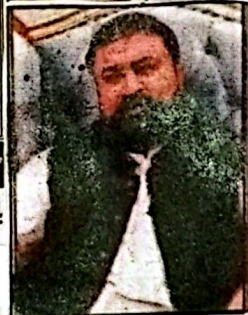
وزیر اعلیٰ میرسر فراز کھٹی سوشل میڈیا پر پیغام جاری کر رہے ہیں

کوئٹہ (رخ ن + نیوز ایجنسیاں) وزیر اعلیٰ بلوچستان میرسر فراز کھٹی نے کہا ہے کہ ہتھیاز ایئر ایبویٹس ہوائی معاشروں کی اصل طاقت وہ محنت کش طبقہ ہے، وزیر اعلیٰ بلوچستان میرسر فراز کھٹی نے کہا ہے کہ بلوچستان کے لیے مکمل طور پر تیار ہے اور جلد اس کا باقاعدہ افتتاح جیڑ میں پاکستان ہتھیاز ایئرٹیٹل ہاؤس میں ہوگا۔ اس موقع پر ایک پیغام میں انہوں نے کہا کہ یہ منصوبہ بلوچستان کی تاریخ میں اپنی نوعیت کا پہلا انقلابی اقدام ہے جو صحت کے شعبے میں ایک اہم سنگ میل کی حیثیت رکھتا ہے۔ انہوں نے ایئر ایبویٹس سروس کے فائدہ بتاتے ہوئے کہا کہ اس سروس کے آغاز سے صوبے کے دور دراز اور پسماندہ علاقوں میں رہنے والے مریضوں کو بروقت ہنگامی طبی امداد فراہم کی جاسکے گی۔ یہ جدید سہولت شدید زخمی اور تازک حالت کے مریضوں کو فوری طور پر بڑے شہروں کے اسپتالوں تک منتقل کرنے میں معاون ثابت ہوگی۔ اس منصوبے کے ذریعے جیتی انسانی جانوں کے تحفظ کو یقینی بنایا جاسکے گا۔ یہ سروس حادثات، قدرتی آفات اور دیگر ہنگامی صورتحال میں فوری رسپانس سسٹم کو مزید مضبوط بنانے میں کلیدی کردار ادا کرے گی۔ وزیر اعلیٰ نے مزید کہا کہ حکومت بلوچستان صحت کے شعبے کو جدید خطوط پر استوار کرنے اور عوام کو معیاری طبی سہولیات کی فراہمی کے لیے سنجیدہ اور عملی اقدامات کر رہی ہے۔ انہوں نے اس بات پر زور دیا کہ ہتھیاز ایئر ایبویٹس کا یہ منصوبہ حکومت بلوچستان کے خلاف عزم کی عملی تصویر ہے جو عوام کو بہتر اور بروقت طبی سہولیات کی فراہمی کی جانب ایک تاریخی جیڑ رفت ثابت ہوگا۔