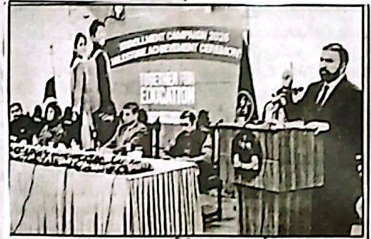
وزیر اعلیٰ کی زیر صدارت ریاستی ڈی وی کا کنفرس "ہارٹنگ آف دی ایٹ" کا پانچواں اجلاس ایس ایچ آر بلوچستان کے تیار ریاستی رٹ کے اختتام اور ترقیاتی مسیوں پر ملدرآء کا سٹیبل جائزہ اور انجان مہاجرین کے اٹھانے کے عمل پر غور

ایس ایچ آر بلوچستان کے تیار ریاستی رٹ کے اختتام اور ترقیاتی مسیوں پر ملدرآء کا سٹیبل جائزہ اور انجان مہاجرین کے اٹھانے کے عمل پر غور