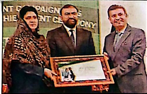
چیف نگراری بلوچستان گل تہہ مگر قسیم میں دلازم 2026 کے اہداف کی تکمیل پر متقدہ ہر دورہ تقریب کے موقع پر سوالی دلازم قسیم مایطویدئے دامل ہر تہہ اے بلوں کی باب سے گئے آکر ان سے تکمیل شدہ شہرہ دہی ہیں