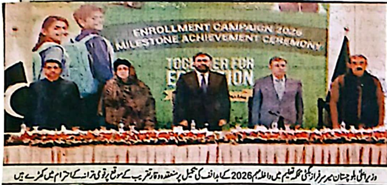
وزیر اعلیٰ بلوچستان میر فرخاندین مگر قسیم میں دلازم 2026 کے اہداف کی تکمیل پر متقدہ ہر دورہ تقریب کے موقع پر قومی ترانہ کے احترام میں گز رہے ہیں