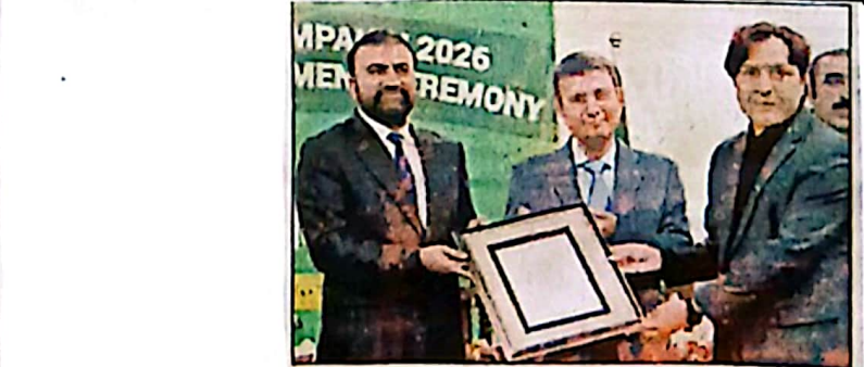
بلوچستان کی ترقی کے لیے حکومت کو ملنے والی سہولتیں اور دیگر امور پر وزیر اعلیٰ بلوچستان کی تقریر