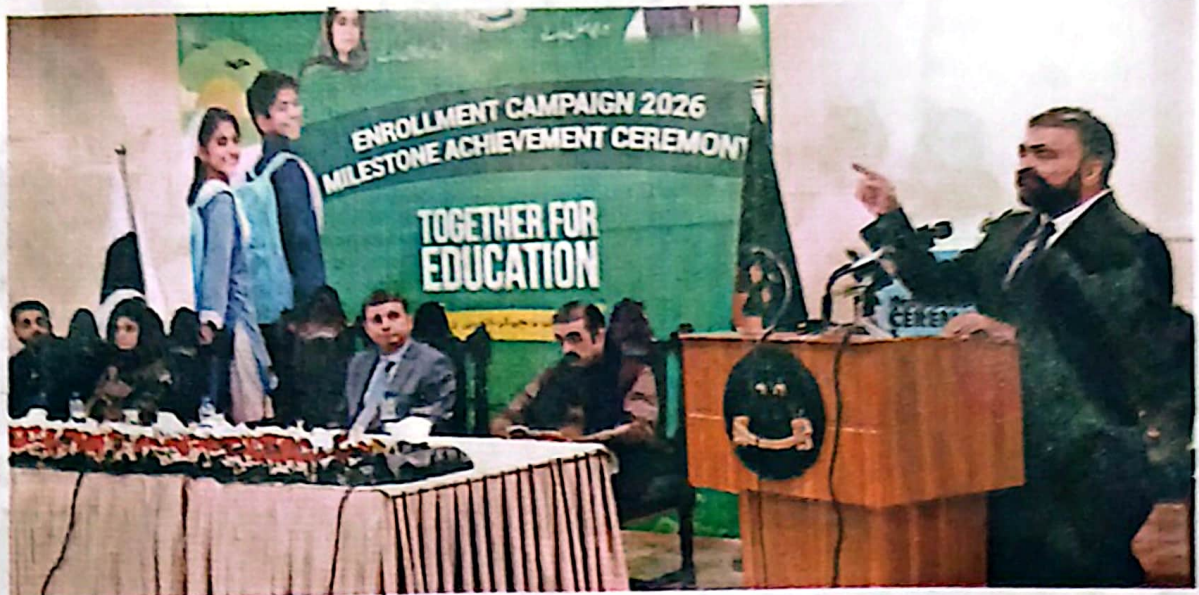
QUETTA: Chief Minister Mir Sarfraz Bugti addressing Education department ceremony to mark completion of targets of school admission campaign 2026.