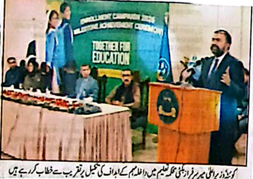
کونڈراخان (ذہری) بلوچستان سربراہ ریاستی محکمہ تعلیم میں اعلیٰ سربراہ کے اہداف کی تکمیل پر تقریب سے خطاب کر رہے ہیں

سربراہ و پاسدار بلوچستان کی تعمیر کاوشیں جاری رکھی جائیں گی وزیر اعلیٰ حکومت صوبے کی پاسدار ترقی پیشگامت میں اٹھانے اور حیاتیاتی توانی کے تحفظ کیلئے پروگرام سے پنجاب قدرتی وسائل اور صنعتی اجولائی نظام سے اہل مال سوسہ ہے، جہاں ساحلی سنگروں سے لے کر بلند پہاڑی علاقوں کے جوہر اور جانوروں کے جنگلات تک اہم قدرتی اٹھائے موجود ہیں جو موسمیاتی تبدیلی، آبی وسائل کے تیزی نمبر 2 سلسلہ 5 قدرتی وسائل اور صنعتی اجولائی نظام سے اہل مال سوسہ ہے، جہاں ساحلی سنگروں سے لے کر بلند پہاڑی علاقوں کے جوہر اور جانوروں کے جنگلات تک اہم قدرتی اٹھائے موجود ہیں جو موسمیاتی تبدیلی، آبی وسائل کے تیزی نمبر 2 سلسلہ 5