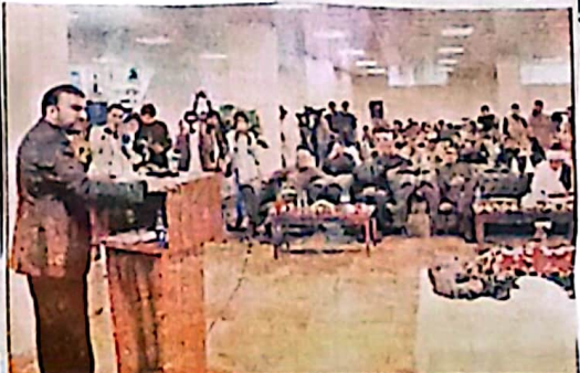
بلوچستان کی ترقی کے لیے حکومت کو ملنے والی سہولتیں اور دیگر امور پر وزیر اعلیٰ بلوچستان کی تقریر