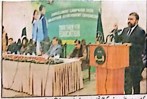
کوئٹہ: وزیر اعلیٰ میر سرفراز محی نے وکلاء کے مسائل کے حل کیلئے اقدامات کر رہی ہے، وزیر اعلیٰ

قدرتی ماحول کا تحفظ سب کی مشترکہ ذمہ داری ہے، وزیر اعلیٰ بلوچستان سوسائٹی تہذیبی کے پیش نظر سے نکلنے کیلئے فوری اقدامات کی ضرورت ہے، وزیر اعلیٰ بلوچستان کوئٹہ (پبلک ریلیشنز) وزیر اعلیٰ بلوچستان میر سرفراز محی نے ام ارض کے سوچ پر اپنے پیغام میں کہا ہے کہ یہ دن اس حقیقت کی یاد دہانی کرتا ہے کہ قدرتی ماحول کا تحفظ اور اس کی تمام سبکی مشترکہ ذمہ داری ہے۔ جس کے لیے اعلیٰ شعور اور ملکی اقدامات کا نگرین ہونا ضروری ہے۔ انہوں نے کہا کہ بلوچستان قدرتی وسائل اور ماحول کے لحاظ سے ایک خاص جگہ پر ہے۔ جہاں سماجی سیکٹرز سے لے کر جنگلات، آب و ہوا، قدرتی گیس اور پانی کے سبب سے لے کر سوسائٹی کے تمام شعبوں کے ساتھ ساتھ اور ماحول کے تحفظ اور اس کی تمام سبکی مشترکہ ذمہ داری ہے۔ حکومت وکلاء کے مسائل کے حل کیلئے اقدامات کر رہی ہے، وزیر اعلیٰ کوئٹہ (پبلک ریلیشنز) وزیر اعلیٰ بلوچستان میر سرفراز محی نے وکلاء کے مسائل کے حل کیلئے اقدامات کر رہی ہے، وزیر اعلیٰ کوئٹہ (پبلک ریلیشنز) وزیر اعلیٰ بلوچستان میر سرفراز محی نے وکلاء کے مسائل کے حل کیلئے اقدامات کر رہی ہے، وزیر اعلیٰ