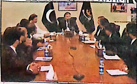
ذیف غیر منعمت