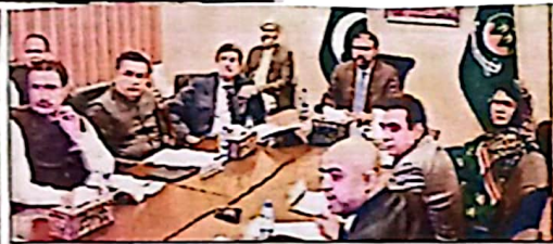
ذریعہ سرفرز ایجنسی یونیورسٹی آف کرمان ہائی کیس سے حلقی اجلاس کی صدارت کر رہے ہیں

کوئٹہ (رٹن) ذریعہ بلوچستان سرفرز ہائی کی ذریعہ صدارت یونیورسٹی آف کرمان ہائی کیس کی کارکردگی اور ہائی مسائل اور ہائی کے