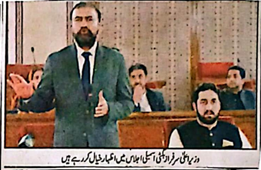
وزیر اعلیٰ سرفراز بلوچستانی اسمبلی اجلاس میں اظہار خیال کر رہے ہیں

لائیو ٹویشن پر مبنی ماضی کا مربوط نظام نافذ کیا جائیگا افسران کی جائے لینائی پر موجود کی ترقیاتی منصوبوں پر عملدرآمد کی ترقی وقت میں کمرانی ممکن ہوگی 10 دن سے ڈاکٹر لیلہ سے فیڈبیک افسران کی جائے ترقیاتی منصوبوں میں شفافیت اور برادرت بحال اور لین ٹرینج ہے خطاب کراچی (پ ر) بلوچستان میں لیلہ افسران کی ماضی کا مربوط نظام نافذ کیا جائیگا افسران کی جائے لینائی پر موجود کی ترقیاتی منصوبوں پر عملدرآمد کی ترقی وقت میں کمرانی ممکن ہوگی لائیو ٹویشن پر مبنی ماضی کا مربوط نظام نافذ کیا جائیگا افسران کی جائے لینائی پر موجود کی ترقیاتی منصوبوں پر عملدرآمد کی ترقی وقت میں کمرانی ممکن ہوگی