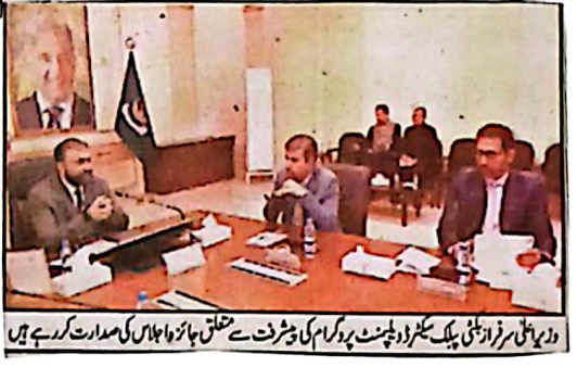
وزیر اعلیٰ سرفراز بلوچستانی اسمبلی اجلاس میں اظہار خیال کر رہے ہیں

وزیر اعلیٰ بلوچستان کی کراچی آؤٹس کولنگ کے صدور سے تعزیرت کراچی (پ ر) وزیر اعلیٰ بلوچستان سرفراز بلوچستانی اسمبلی اجلاس میں اظہار خیال کر رہے ہیں کراچی آؤٹس کولنگ کے صدور سے تعزیرت کراچی (پ ر) وزیر اعلیٰ بلوچستان سرفراز بلوچستانی اسمبلی اجلاس میں اظہار خیال کر رہے ہیں