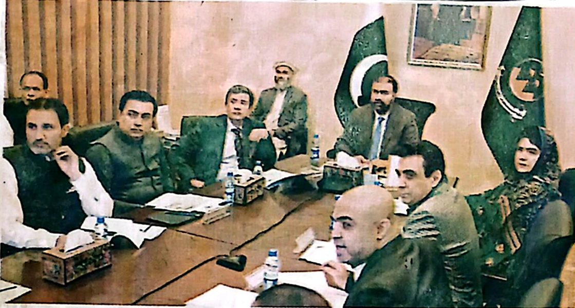
QUETTA: Chief Minister Mir Sarfraz Bugti presiding over a meeting related to University of Makran Panjgur Campus on Tuesday.