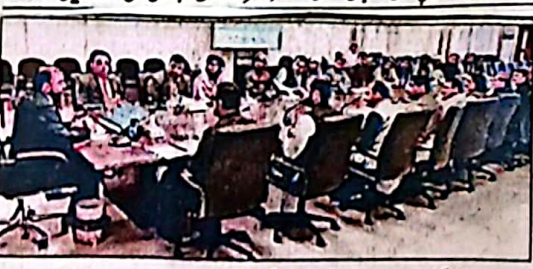
وزیر اعلیٰ سرگرمیوں کی قیادت سے لاکل کورنٹ یونین کونسل کے چیئرمین اماندگان ملاقات کر رہے ہیں

پاکستان سرگرمیوں کی قیادت نے نہ صرف بروقت دانشمندانہ فیصلے کئے بلکہ ملک کی سفارتی سادھ کو بھی مستحکم کیا، ایکس پریس میں یونین کونسلوں کے جائز مسائل کے حل کیلئے موثر اور قابل عمل اقدامات اٹھائے جائیں گے، وفد سے سرگرمیوں کی دستاویزی