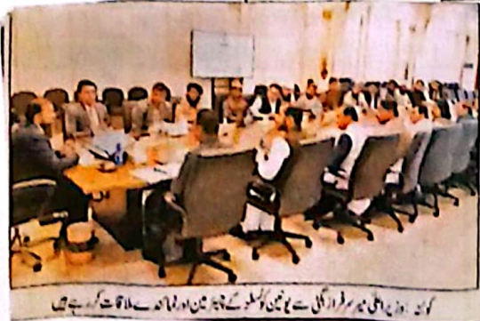
کوئٹہ: وزیر اعلیٰ بلوچستان نے سرگودا کے چوتھے اور اٹھارہ کان کے مذاقات کی جس میں نیشنل کمیٹی کی پیش قدمی اور اس کے ذریعے اعلیٰ کو آگے کیا گیا۔

کوئٹہ (شان) وزیر اعلیٰ بلوچستان نے سرگودا کے چوتھے اور اٹھارہ کان کے مذاقات کی جس میں نیشنل کمیٹی کی پیش قدمی اور اس کے ذریعے اعلیٰ کو آگے کیا گیا۔