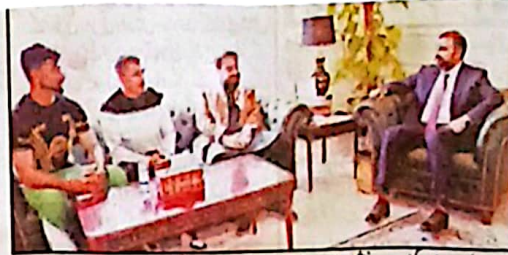
وزیر اعلیٰ میر سر فراز بلٹی سے انٹرنیشنل باکسٹرا مو ملاقات کر رہے ہیں، انٹرنیشنل باکسٹرا مو ملاقات کر رہے ہیں

کوئٹہ (ان) گورنر بلوچستان جعفر خان مندوخیل اور وزیر اعلیٰ میر سر فراز بلٹی نے اپنے ایک ایک بیانات میں ..... بقہ 18 ستمبر 7 امریکا، ایران، جنگ روکنے میں کردار ادا کرنے پر وزیر اعظم اور فیڈرل پارٹنر کو خراج تحسین پیش کیا۔ گورنر بلوچستان کا کہنا تھا کہ امریکا اور ایران کے درمیان جنگ بندی و رائل بین الاقوامی سفارت کاری میں پاکستان کی ایک بڑی کامیابی ہے۔ پاکستان نے وزیر اعظم مہاشین شہباز شریف کی دور اندیش قیادت اور فیڈرل پارٹنر سید عامر شہزاد کی قدیم میں امریکا اور ایران کے درمیان جنگ بندی میں اہم کردار ادا کیا ہے۔ اس جنگ بندی کے ذریعے پاکستان نے نہ صرف پورے خطے کو چابی سے بجایا بلکہ عالمی سطح پر سفارت کاری کی روشن مثال بھی قائم کی۔ گورنر مندوخیل نے کہا کہ امید ہے کہ مستقبل قریب میں پاکستان کی موجودہ دانشمندانہ سفارت کاری کے مزید مثبت نتائج سامنے آئیں گے جس کے نتیجے میں دہریہ بائیں اور صحیح کام اور ترقی و خوشحالی کی نئی راہیں کھلیں گی۔ وزیر اعلیٰ بلوچستان نے کہا کہ فیڈرل پارٹنر سید عامر شہزاد کی پیش ورانہ نکتہ عملی اور بروقت اقدامات نے پورے خطے کو ایک مکمل بڑی چابی سے محفوظ رکھنے میں اہم کردار ادا کیا ہے۔ سر فراز بلٹی نے کہا کہ پاکستان کی ستوازن اور فعال سفارت کاری نے عالمی برادری کو یہ واضح پیغام دیا ہے کہ امن، استحکام اور معاشی تعمیراتی اوج میں ترقی ہے۔ انہوں نے کہا کہ اس ستوازن سفارتی حکمت عملی کے نتیجے میں حاصل ہونے والی یہ کامیابی خطے میں مستقبل قیام امن کی جانب ایک اہم سنگ میل ہے