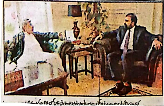
کوئٹہ، وزیر اعلیٰ بلوچستان سر فراز مگنی سے لوکل گورنمنٹ کونسل کے چیئرمین اور نمائندگان ملاقات کر رہے ہیں