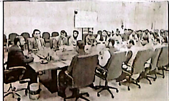
کنڈہ وزیر اعلیٰ بلوچستان سرسرفرازی سے ٹیبل گورنٹ ہونیں کوشش کے نتیجے میں اور لاکھ کان ملاقات کر رہے ہیں