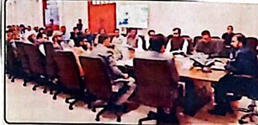
وزیر اعلیٰ میر سر فراز بلٹی سے کونسل کو رفرنس ہوئیں کونسل کے چیئرمین اور رکنوں سے ملاقات کر رہے ہیں