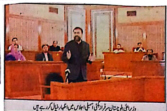
وزیر اعلیٰ بلوچستان سرسبز فراہمی اسمبلی اجلاس میں اہلکار خیال کر رہے ہیں

وزیر اعلیٰ کی ہدایت، خضدار میں بھتہ لینے پر دو پولیس اہلکار معطل خضدار (پور پورٹ) وزیر اعلیٰ سرسبز فراہمی کی ہدایت پر خضدار کے دو پولیس اہلکاروں کو بھتہ خوری پر معطل کر دیا گیا۔ انکوائری کا حکم جیسٹس ڈی اے ایم ایف کے مطابق وزیر اعلیٰ سرسبز فراہمی کی ہدایت پر پولیس چیک پوسٹوں سے بھتہ خوری کے خاتمے کے لئے کارروائیوں کا