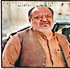
تحریر: ظہیر احمد

بلوچستان اس وقت جس معاشی دہاو، وسائل کی کمی اور سماجی ناہمواری کا سامنا کر رہا ہے، اس میں ہر ایسی فیصلہ کش ایک اعلان نہیں بلکہ لوگوں کو اس کی روزمرہ زندگی پر براہ راست اثر انداز ہوتا ہے۔ ایسے حساس مراحل میں وزیر اعلیٰ بلوچستان سرگراز کئی کی حالیہ پریس کانفرنس ایک اہم سنگ میل کی حیثیت رکھتی ہے، جس میں انہوں نے کفایت شعاری، توانائی بچت اور عوامی ریلیف کے لیے متعدد اقدامات کا اعلان کیا۔ یہ اقدامات بظاہر کفایت اور وقت کی ضرورت کے عین مطابق ہیں، مگر اصل سوال یہ سترہاڑی ہوتا ہے کہ کیا یہ فیصلے عملی شکل اختیار کر سکیں گے؟