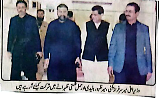
وزیر اعلیٰ ہر سر فرادائی، ہر طور بلوچی اور اعلیٰ میں شریک کیلئے آرہے ہیں

یہ تھور امن، محبت اور انسان دوستی کے فروغ کی علامت ہے، جو ایک مہذب اور پرامن معاشرے کی بنیاد ہے، پتیام بلوچستان میں اقلیتوں کے حقوق کا تحفظ حکومت کی اولین ترجیحات میں شامل ہے، ایسٹروڈاری برادری کو مہار کہا گیا ہے اور کہا ہے کہ یہ تھور امن، محبت اور انسان دوستی کے فروغ کی علامت ہے انہوں نے کہا کہ ایسٹروڈاری برادری کا اہتمام اور مہار کہا گیا ہے ایسٹروڈاری اور بھائی چارے کے فروغ کی علامت ہے، جو ایک مہذب اور پرامن معاشرے کی بنیاد ہے، پتیام بلوچستان میں اقلیتوں کے حقوق کا تحفظ حکومت کی اولین ترجیحات میں شامل ہے، ایسٹروڈاری برادری کو مہار کہا گیا ہے اور کہا ہے کہ یہ تھور امن، محبت اور انسان دوستی کے فروغ کی علامت ہے انہوں نے کہا کہ ایسٹروڈاری برادری کا اہتمام اور مہار کہا گیا ہے