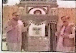
گوارڈ وزیر اعلیٰ سر فراز بگلی یادگار شہید ایم شماری چوک کے افتتاح کے بعد دعا کر رہے ہیں۔ گورنر بلوچستان جنرل خان مندویشیل بھی موجود ہیں