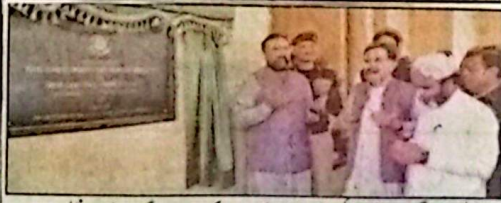
وزیر اعلیٰ سر فراز بگلی چیف مشر ایچ ایس کے افتتاح کے بعد دعا کر رہے ہیں۔ گورنر جنرل مندویشیل موجود ہیں