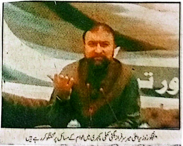
بلوچستان اسمبلی کے فورم پر منظور کی گئی مشترکہ قرارداد قابل تحسین ہے

کرتے ہوئے کہا کہ پارلیمانی فورم کی مشترکہ قرارداد قابل تحسین ہے، جو پاکستان کے سفارتی کردار اور قومی یکجہتی کی عکاسی کرتی ہے انہوں نے کہا کہ عالمی سطح پر کشیدگی کے دوران پاکستان نے متوازن اور دانشمندانہ سفارت کاری کا مظاہرہ کرتے ہوئے امن کے قیام میں اہم کردار ادا کیا۔ وزیر اعلیٰ کا کہنا تھا کہ وزیر اعظم شہباز شریف اور فیملیہ مارشل سید عاصم میر کی قیادت نے بروقت اور مع حکمت عملی کے ذریعے پاکستان کا مثبت تشخص مزید مستحکم کیا اور ملک کو عالمی برادری میں نمایاں مقام دلایا۔ انہوں نے مزید کہا کہ خطے میں کشیدگی کے باوجود پاکستان نے مہر، محنت اور امن پسندی کا عملی مظاہرہ کیا، جو مستقبل میں بھی عالمی امن کے فروغ میں اہم کردار ادا کرے گا۔ میر سرفراز بٹنی نے کہا کہ بلوچستان حکومت وفاق کے ساتھ مل کر امن، استحکام اور ترقی کے پیوند کو آگے بڑھاتی رہے گی