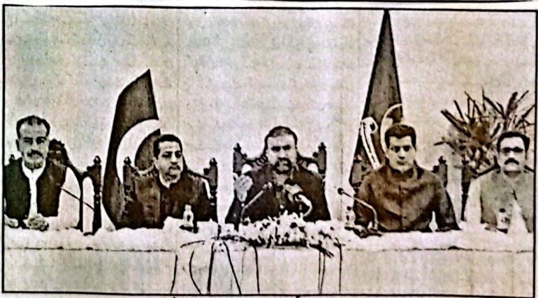
کونڈ وزیراعلیٰ بلوچستان سرسرفراز خان وزیراعلیٰ سیکرٹریٹ میں پریس کانفرنس کر رہے ہیں

تک دو ارب سے زائد حصہ دیا ہے، گزشتہ مالی سال کے دوران 14 ارب روپے کی پخت ہوئی۔ یہ بات انہوں نے ہفتہ کو وزیراعلیٰ سیکرٹریٹ میں پریس کانفرنس کرتے ہوئے بھی اس موقع پر صوبائی وزراء میر ٹیوڈ، بلیدی، میرضیاء اللہ لاگو، بخت محو کا، وزیراعلیٰ کے معاون برائے میڈیا و سیاسی امور شاد زنگی موجود تھے۔ وزیراعلیٰ بلوچستان سرسرفراز خان نے کہا کہ مسایہ ملک ایران میں انتہائی خطرناک جنگ چل رہی ہے جس کے اثرات پاکستان پر بھی پڑ رہے ہیں جنگ کی وجہ سے پاکستان میں بھی مہنگائی بڑھی ہے۔ انہوں نے کہا کہ صدر مملکت آصف علی زرداری، وزیراعظم محمد شہباز شریف اور فیملڈ مارشل سید عامر نے جس مددبرانہ انداز میں معاملات کو چلایا ہے اس پر انہیں خراج تحسین پیش کرتے ہیں۔ انہوں نے کہا کہ بلوچستان حکومت نے وفاق کے کفایت شعاری اقدامات کے اعلان کے بعد 13 ماہ کیلئے اپنے حصے کے 7 ارب روپے وفاق کو دینے میں ایک ماہ میں 2 ارب روپے سے زائد رقم وفاق کو دی گئی ہے۔ وزیراعلیٰ نے کہا کہ بلوچستان میں 80 ہزار پبلک ٹراپورٹ رجسٹرڈ ہے ان میں سے بعض سوبے کے اندر اور دیگر سوبوں کے لوگ بھی ہیں ہم ٹراپورٹرز کو 15 دن کا وقت دے رہے ہیں کہ وہ اپنی ٹراپورٹ کو مفت اپنے نام پر رجسٹر کرائیں اور اگر کسی صورت میں ایسا ممکن نہ ہو سکا اور اسکے پیسے پرانے مالکان کو گئے تو وہ تھلا ڈپٹی کسٹمز سے واپس کریں ہم اگلی وفاق کا ازالہ کریں گے۔ انہوں نے کہا کہ سوبے میں گندم کی کاشت کا سیزن شروع ہو گیا ہے ساڑھے 112 ہیکٹرز زمین رکھنے والے چھوٹے کسانوں کو کسان کارڈ کے ذریعے ایک ماہ کیلئے