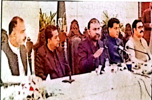
وزیر اعلیٰ بلوچستان سر فرزانہ بیگم کی قیادت میں مشاورین کی قیادت میں ایک ماہ کیلئے بلس سروس مفت کی گئی، چھوٹے کسانوں کو کسان کارڈ کے ذریعے 15 ہزار روپے فراہم کریں گے گاڑیوں اور موٹر سائیکلوں کی ٹرانسفر و رجسٹریشن فیس 15 دن کے لئے معاف، گاڑیاں نام پر منتقل کر لیں، سبسڈی دیں گے، وزیر اعلیٰ ریسٹورنس اور شادی ہال رات 10 بجے بند کرنے پر تاجروں سے مشاورت ہوگی، جنگ کے باعث ریلیف پیکیج متعارف کرایا، اجلاس کے بعد پریس کانفرنس

وزیر اعلیٰ بلوچستان سر فرزانہ بیگم نے کہا کہ چاروں ممبروں کا مقصد ہے کہ پینک و گریٹ بلس کی کیڈیٹ رات 8 بجے بند کرنے پر مشاورین کی قیادت میں ایک ماہ کیلئے بلس سروس مفت کی گئی، چھوٹے کسانوں کو کسان کارڈ کے ذریعے 15 ہزار روپے فراہم کریں گے گاڑیوں اور موٹر سائیکلوں کی ٹرانسفر و رجسٹریشن فیس 15 دن کے لئے معاف، گاڑیاں نام پر منتقل کر لیں، سبسڈی دیں گے، وزیر اعلیٰ ریسٹورنس اور شادی ہال رات 10 بجے بند کرنے پر تاجروں سے مشاورت ہوگی، جنگ کے باعث ریلیف پیکیج متعارف کرایا، اجلاس کے بعد پریس کانفرنس