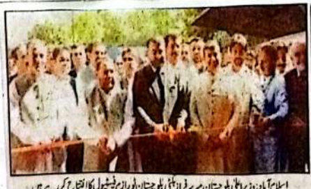
اسلام آباد، وزیر اعلیٰ بلوچستان میر سردار اذنی نے کہا ہے کہ صوبے میں سیاحت کے شعبے کو ترقی دے کر بلوچستان کے مثبت اور پرامن ماحول کو اجاگر کیا جائے گا