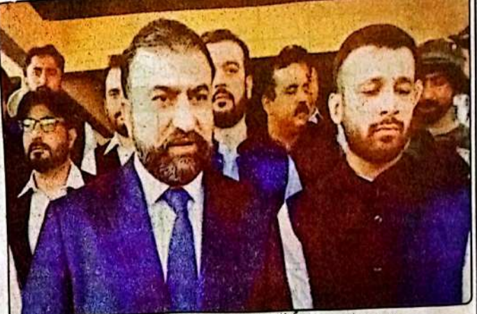
اسلام آباد، وزیر اعلیٰ بلوچستان میر سردار اذنی نے کہا ہے کہ صوبے میں سیاحت کے شعبے کو ترقی دے کر بلوچستان کے مثبت اور پرامن ماحول کو اجاگر کیا جائے گا