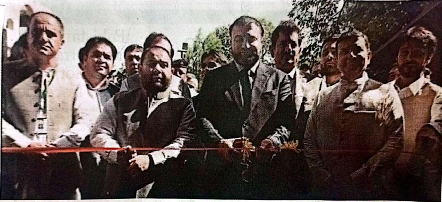
ISLAMABAD: Chief Minister Balochistan, Sarfraz Ahmed Bugti, and Federal Minister for National Heritage and Culture Division, Aurangzeb Khan Khichi inaugurating three-day Balochistan Grand Tourism Festival at Lok Virsa.