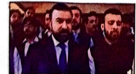
اسلام آباد: وزیر اعلیٰ بلوچستان میر فرزانہ نے ایک تقریب سے خطاب کر رہے ہیں۔