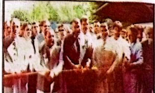
اسلام آباد: وزیر اعلیٰ بلوچستان میر فرزانہ نے ایک تقریب سے خطاب کر رہے ہیں۔