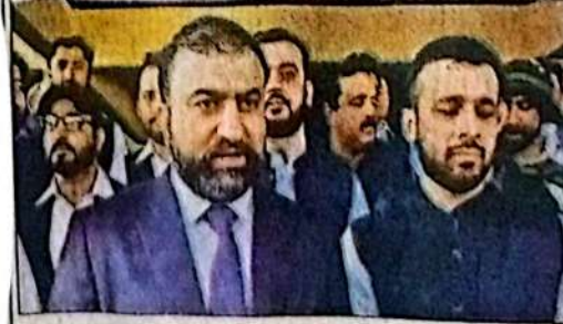
اسلام آباد، وزیر اعلیٰ بلوچستان میر سرفراز گیلانی نواز مہم فیٹیبل کی افتتاحی تقریب میں میڈیا سے بات چیت کر رہے ہیں