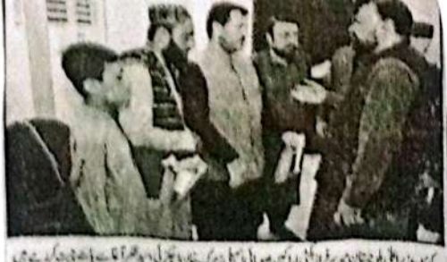
کوئٹہ میں وزیر اعلیٰ بلوچستان میر گل خان نے مختلف اداروں کے اہل کاروں سے ملاقات کی۔