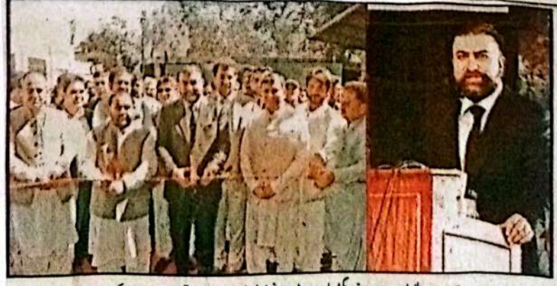
اسلام آباد، وزیر اعلیٰ بلوچستان سیر فرزانہ کی بلوچستان ٹورزم فیسیل سٹیٹ کے افتتاح کے بہتر تقریب سے خطاب کر رہے ہیں