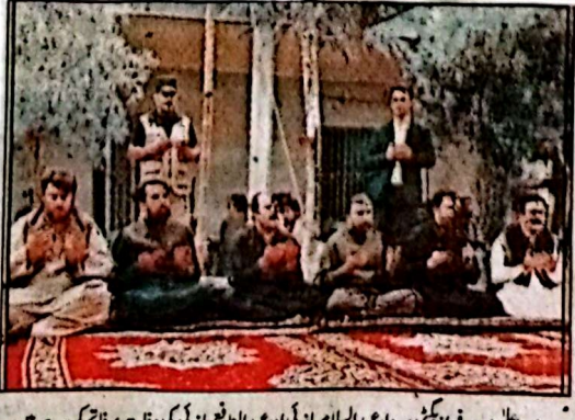
وزیر اعلیٰ میر سرفراز بھٹی سردار عبدالسلام ہارنی اور عبدالناتج ہارنی کی وفات پر فاتحہ کر رہے ہیں

بس کے روس کا معاہدہ نی جائے، میر مظفر خان جمالی کے پران اور باوقار انعقاد کے بادل خیال کیا گیا۔ میر مظفر خان روں کو تیس سے چابیت دی کہ خبر اور جناس کے دوران کسی قسم کی نے اور عزاداروں کو مکمل سہولیات انہوں نے کہا کہ اوت جو ایک روايات ہم آہنگی اس کا حسن ہے نت پر قرار کما جائے گا