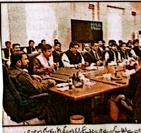
اشران سے خطاب کر رہے ہیں، چیف سیکرٹری اور دیگر اعلیٰ حکام بھی موجود ہیں

ہے یہ بات انہوں نے مقابلے کے امتحان میں کامیاب ہونے والے منتخب نوجوان اشران سے