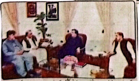
گورنر بلوچستان جعفر خان مندوخیل سے جنرل شیخ نیشنل بینک بلوچستان اعجاز ملاقات کر رہے ہیں

جرمہ تہاری ایک شاندار قومی روایت ہے جو اندرونی اور بیرونی چیلنجوں سے نمٹنے کیلئے متنازعہ کیا جاتا ہے، گورنر قومی جرموں کے ڈیوٹیوں کے لئے انفرادی اور عوام کو اعتماد کا مقصد ذمہ داروں اور عوام کو درپیش مشکلات سے متعلق آگہی حاصل کرنا ہے ریکوڈنگ منصوبے کا 25 فیصد منافع بلوچستان کو ملنے کے حوالے سے سابق وزیر اعلیٰ میر عبدالقدوس بزنجو کا کردار قابل ستائش ہے