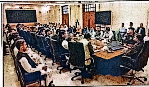
وزیر اعلیٰ بلوچستان میر فرزاد کی نوجوب اعلیٰ سول سروسز انصران سے خطاب کر رہے ہیں، چیف سیکرٹری بلوچستان کھیل قادر خان اور دیگر اعلیٰ حکام بھی موجود ہیں

ایڈیشنل چیف سیکرٹری ترقیات زاہد سلیم، پرنسپل سیکرٹری باہر خان، سیکرٹری خزانہ عمران زکون بھی موجود تھے وزیر اعلیٰ نے کہا کہ بلوچستان کی ترقی کے عمل میں نوجوان انصران کا کردار انتہائی کلیدی ہے ان پر لازم ہے کہ وہ اپنے فرائض دیا نیتداری، خلوص اور عوامی خدمت کے مذہب سے انجام دیں، کیونکہ یہی طرز عمل ان کی کامیابی کا اصل معیار ہوگا انہوں نے کہا کہ اختیار کو ملاقات کی علامت نہیں بلکہ عوام کی خدمت کا ذریعہ سمجھا جانے۔ عوامی مسائل کے حل میں خلوص، سہری اور بروقت ردعمل ہی ایک بہتر تنظیم کی پہچان ہے۔ بلوچستان کو مسائل کی لہلہ سے نکل کر امن، استحکام اور ترقی کی راہ پر گامزن کرنے کے لیے ہمیں ادارہ جاتی ہم آہنگی اور مشترکہ ذمہ داری سے آگے بڑھنا ہوگا وزیر اعلیٰ نے کہا کہ حکومت کی ذمہ داری پالیسی بنانا ہے جبکہ انتظامیہ ان پالیسیوں پر عمل درآمد کی ضمانت ہے۔ نوجوان انصران کو چاہیے کہ وہ ریاضی پالیسیوں کی روح کو سمجھیں اور ان پر عمل درآمد کو اپنی پیشہ ورانہ ذمہ داری سمجھیں انہوں نے کہا کہ گزشتہ مالی سال کے دوران بہتر مالی نظم و ضبط کے نتیجے میں حکومت بلوچستان نے غیر ترقیاتی اخراجات میں 14 ارب روپے سے زائد کی خاطر بچت کی۔ ترقیاتی منصوبوں کے لیے مختص فنڈز کا بروقت اور درست استعمال یقینی بنایا گیا، وزیر اعلیٰ میر فرزاد نے نوجوان انصران کے جذبے کو سراہتے ہوئے اس امید کا اظہار کیا کہ وہ ایجا نیتداری، شفافیت، قانون کی بالادستی اور عوامی خدمت کو اپنا نصب العین بنائیں گے اور بلوچستان کو ترقی و خوشحالی کی راہ پر گامزن کرنے میں اپنا بھرپور کردار ادا کریں گے۔