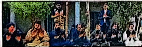
وزیر اعلیٰ بلوچستان میر فرزاد کی سردار عبدالسلام ہاڑی اور عبدالناصح ہاڑی کے انتقال پر تعمیرت و فاتح خوانی کر رہے ہیں، صوبائی وزراء دیگر بھی موجود ہیں