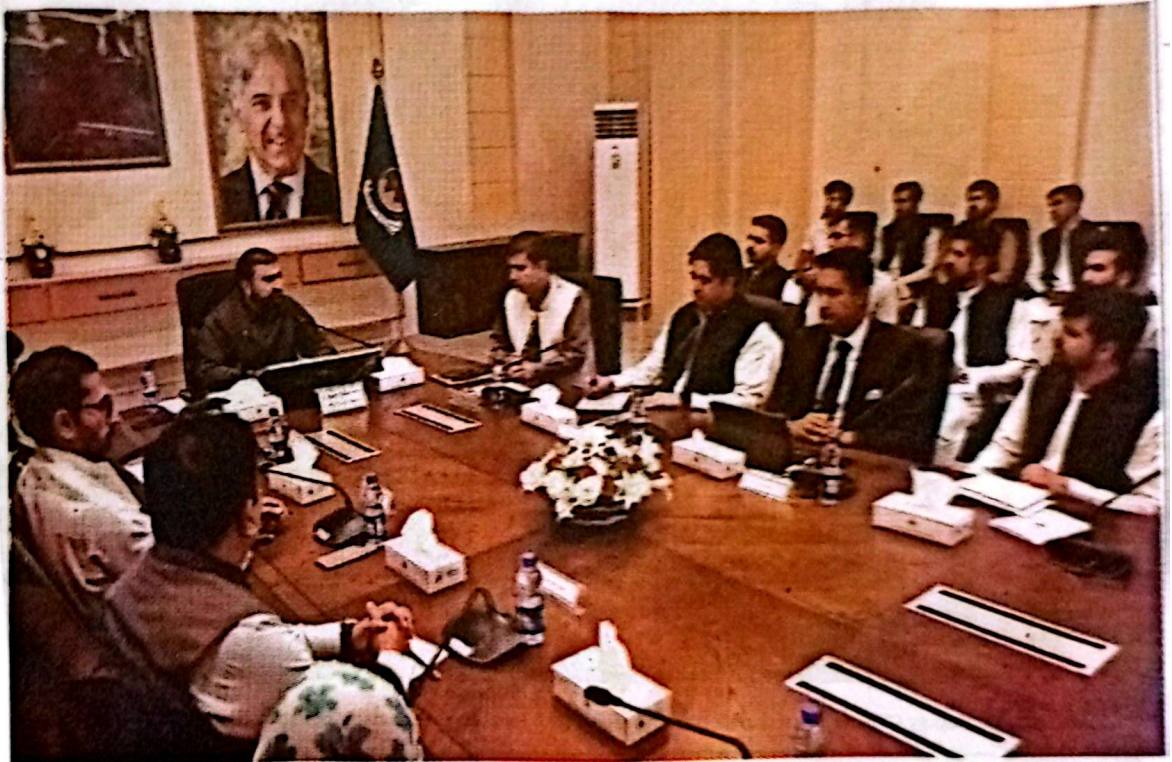
QUETTA: Chief Minister Mir Sarfaraz Bugti addressing newly elected senior civil services officers during a meeting on Thursday.