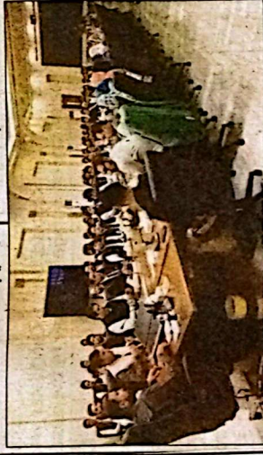
خلیج عربیہ اور آذربائیجان کے درمیان تعلقات کو مضبوط بنانے کی کوششیں