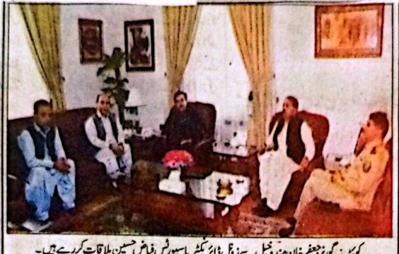
کونڈ: گورنر جعفر خان مندوخیل سے ذوالڈائر نیٹس پاسپورٹس فیض حسین ملاقات کر رہے ہیں۔