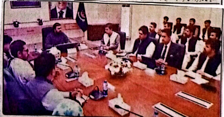
وزیر اعلیٰ بلوچستان میر سر فراز خان ڈپٹی اہل سول سروس افسران سے خطاب کر رہے ہیں، چیف سیکرٹری قلیل قارئین اور دیگر اہل حکام بھی موجود ہیں

اور مشرق و مغرب سے آگے بڑھنا ہوگا وزیر اعلیٰ نے کہا کہ حکومت کی ذمہ داری پالیسی بنانا ہے جبکہ انتظامیہ ان پالیسیوں پر مکمل عملدرآمد کی ضمانت ہے۔ نوجوان افسران کو چاہیے کہ وہ روایتی پالیسیوں کی روٹ کو چھوڑیں اور ان پر عملدرآمد کو اپنی پیشہ وارانہ ذمہ داری سمجھیں انہوں نے کہا کہ گزشتہ مالی سال کے دوران بہتر مالی نظم و نسق کے نتیجے میں حکومت بلوچستان نے نمبر ترقیاتی مدد میں 14 ارب روپے سے زائد کی خاطر بچت کی۔ ترقیاتی منصوبوں کے لیے مختص فنڈز کا بروقت اور درست استعمال یقینی بنانا