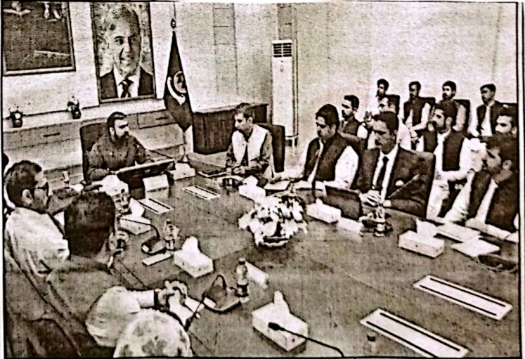
کوئٹہ، وزیر اعلیٰ بلوچستان میر فرزانہ نے پریس کانفرنس میں کامیاب گفتگو کی۔

نوجوان افسران پر زور دیا کہ وہ گورننس اور سروس ڈیولپمنٹ کی سہولتوں کو اپنا اولین ہدف بنائیں، نیک عوامی مسائل کا دیر پا حل اسی میں نہیں ہے انہوں نے کہا کہ بلوچستان سے تعلق رکھنے والے نوجوان افسران سے نوجوانوں کا کام کرنا ہی کی اہم ضرورت ہے۔ قصور اور حقیقت کے درمیان فرق کو سمجھ کر معاشرتی رہنمائی کی جائے تاکہ قوم کو گمراہ کن نظریات سے بچایا جاسکے۔ وزیر اعلیٰ نے واضح کیا کہ بلوچستان کا اہل مسئلہ نوجوان ترقی نہیں بلکہ بہتر ترقی کی چیلنج ہے۔ بلوچستان کو مسائل کی دلدل سے نکال کر امن، استحکام اور ترقی کی راہ پر گامزن کرنے کے لیے ہمیں ادارہ جاتی ہم آہنگی اور مشترکہ دوشن سے آگے بڑھنا ہوگا۔ وزیر اعلیٰ نے کہا کہ حکومت کی ذمہ داری پالیسی بنانا ہے جبکہ انتظامیہ ان پالیسیوں پر عمل عملدرآمد کی ضمانت ہے۔ نوجوان افسران کو چاہیے کہ وہ ریاستی پالیسیوں کی روح کو سمجھیں اور ان پر عملدرآمد کو یقینی بنانے اور نئے داری سمجھیں۔ سوال کے دوران بہتر مینیجری کے نتیجے میں حکومت بلوچستان نے غیر ترقیاتی مدت میں 14 ارب روپے سے زائد کی خاطر بجٹ کی ترقیاتی منصوبوں کے لیے تخصیص فراہم کرنا اور درست استعمال کی جانی چاہیگی اور سولہ ہزار لاکھ سے زائد سٹورڈ منسٹر کے متروکات میں مل کے لیے وزیر اعلیٰ نے کہا کہ حکومت نے جتنے بھی وسائل فراہم کیے ہیں انہیں بروقت استعمال کیے جانے چاہئیں تاکہ نوجوان افسران کے لیے اہلکار کی فراہمی کے لیے مالی نظام کو بروباستقامت دیا جاسکے۔ انہوں نے