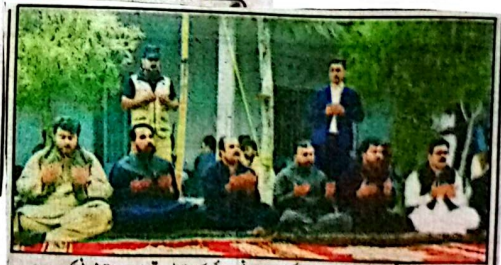
وزیر اعلیٰ میر سر فراز خان سردار عبدالسلام بانی اور عبدالناغ بانی کے انتقال پر تعزیت و فاتحہ خوانی کر رہے ہیں

سروس شروع کرنے جارہے ہیں جو کھلاک سے تاحیہ اسپتال تک سارا دن چلے گی۔ یاد رہے کہ 2017 میں بلوچستان کی سابق حکومت نے چین کے تعاون سے کوئٹہ میں ماس ٹرانزٹ ٹرین سسٹم شروع کرنے کا اعلان کیا تھا تاہم 25 ارب روپے کی بجاری لاگت کے باعث 2020ء میں یہ منصوبہ ترک کر دیا گیا تھا۔