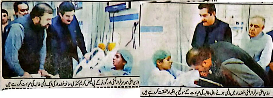
وزیر اعلیٰ بلوچستان میر مرتضیٰ خاں آسپلی اور گورنر کے لیٹل کریم کنڈی ساؤنڈھار کی ایک ڈی طالبہ کی عیادت کر رہے ہیں