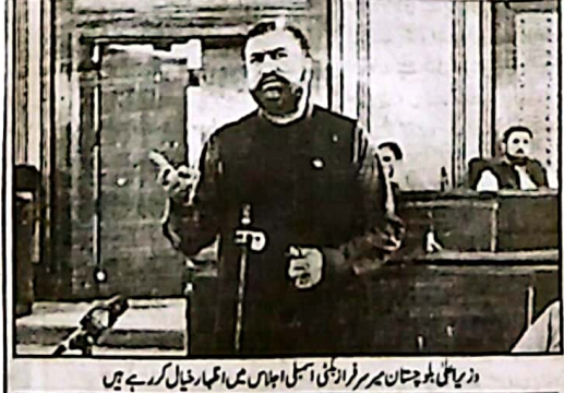
وزیر اعلیٰ بلوچستان سرسبز اور امنی اسمبلی اجلاس میں اعلیٰ راجیل کر رہے ہیں

نکلتا یا کراچی بڑی کامیوت دیا ہے۔ ان کا کہنا تھا کہ بلوچستان کے تمام امن پسند اور محنت وطن ہیں اور وہ دہشت گردوں کے ناپاک مزاحم کو بھی کامیاب نہیں ہونے دیں گے وزیر اعلیٰ بلوچستان نے کہا کہ ہم اپنے مصوم شہداء کے مندی خون کے قرضدار ہیں اور ان کی عظیم قربانیوں پر ہمیں نڈر ہے۔ انہوں نے اس موقع کا امداد کیا کہ سبھی بھر دہشت گردوں اور ان کے سہولت کاروں کو سختی سے پھانسیا جائے گا، اور شہید بچوں کے خون کے ایک ایک قطرے کا حساب لیا جائے گا دوسری جانب، گورنر خیر بختو خواہ لعل کریم کنڈی نے شہداء کے خاندانوں سے ہمدردی کا اظہار کرتے ہوئے کہا کہ ہمارا ملک اس وقت امداد دہلی اور ہروانی دہشت گردی کا فکارت ہے۔ انہوں نے کہا کہ ہماری افواج نے بیشہر دہلی چارجت کا تہذیبی جواب دیا ہے اور بھی چارجت ہماری ہمدردی اور ہمدردی خیر کاروں کے خلاف بھی دکھائیں گی