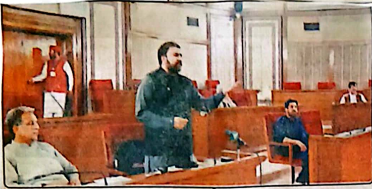
وزیر اعلیٰ بلوچستان میر مرتضیٰ خاں آسپلی ماہاس میں سہارا دیا گیا ہے