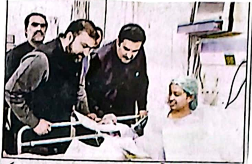
وزیر اعلیٰ بلوچستان میر سرفراز بگٹی اور گورنر کے لیے کے سی ایم ایچ کوئٹہ میں ساتھ فضا داری ایک ڈیجیٹل طالب کی بنائی ہوئی ڈرائنگ دیکھتے ہوئے اس کی حوصلہ افزائی کر رہے ہیں

سرماہ کاروں کو سازگار ماحول فراہم کریں گے، سرفراز بگٹی کان کنی، آئل اینڈ گیس سمیت کی شیوں میں سرمایہ کاری کے مواقع موجود ہم نے ہمیشہ قانونی تجارت کی حوصلہ افزائی اور سہولت کی حوصلہ شکنی کی کوئٹہ (سان) اور برائی بلوچستان سرسرا اور داروں نے یہاں ملاقات کی گورنر کے لیے کے لعل کئی سے لیڈرین آف پاکستان چیئر آف کامرس ایڈوائزری اور پانچھ برس روپ کے مہدے بلوچستان چیئر آف (ہائی سٹو 6 نمبر 8)