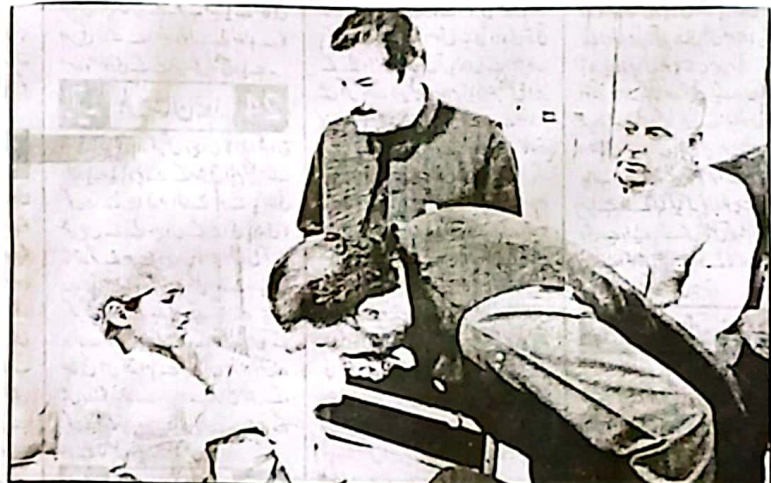
وزیر اعلیٰ بلوچستان سرسبز اور امنی ایم ایچ کو سب سے پہلے صوبہ خفہ کے دہلیوں کی عمارت کی عمارت میں ملاقات کی اراکین اسمبلی