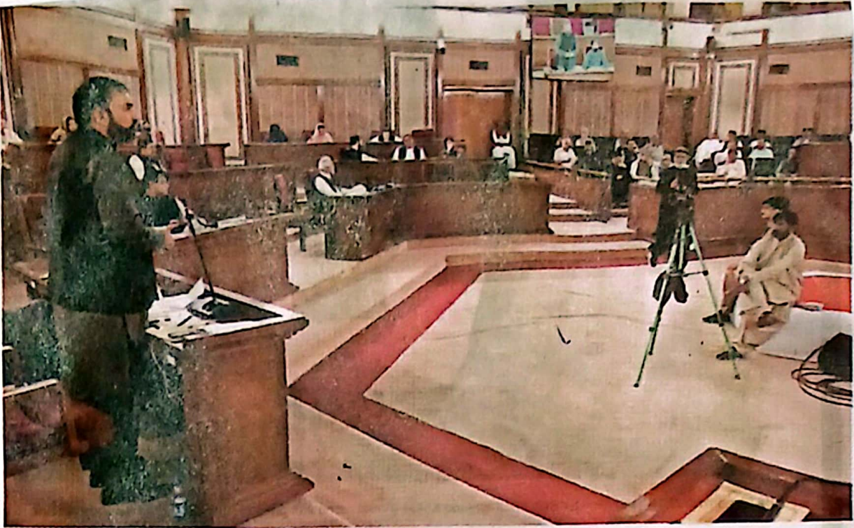
QUETTA: Chief Minister Sarfraz Bugti addressing Balochistan Assembly session on Monday.