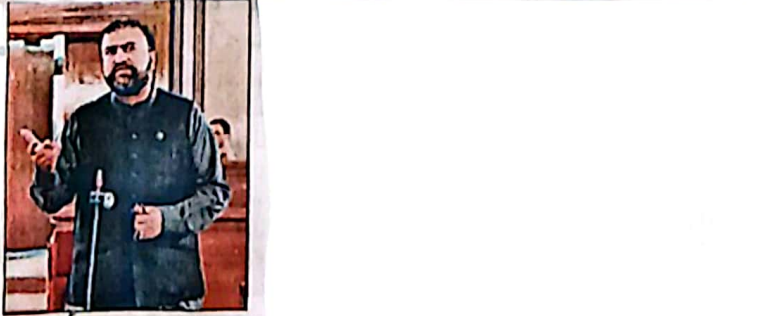
وزیر اعلیٰ بلوچستان میر سرفراز بگٹی اسٹیبلشمنٹ میں اظہار خیال کر رہے ہیں

میر سرفراز بگٹی کی جانب سے گورنر خیر پختہ خواہ ایصل کریم کندی کے اعزاز میں دیئے گئے ٹھہرانہ میں سہولتی وزیر اور داران کین اسٹیبلشمنٹ شریک ہیں