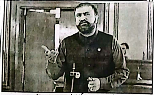
گورنر خیر بھنگوڑا فیصل کریم کنڈی نے وزیر اعلیٰ بلوچستان میر سرفراز بگٹی سے ملاقات کی اور ان کے ساتھ ساتھ خضدار کے زخمیوں کی عیادت کی اور بیرونی دہشت گردوں کے خلاف بھی دکھائیں گی۔

وزیر اعلیٰ بلوچستان میر سرفراز بگٹی سے گورنر خیر بھنگوڑا فیصل کریم کنڈی کی ملاقات ہاشمی انجمنی کے اسپرٹ سمبے میں امن دان کی مجموعی صورتحال اور جاری ترقیاتی منصوبوں پر تبادلہ خیال کیا کوئٹہ (ان) وزیر اعلیٰ بلوچستان میر سرفراز بگٹی سے گورنر خیر بھنگوڑا فیصل کریم کنڈی نے جہاں وزیر اعلیٰ بگٹی نے ملاقات کی اراکین پر موجود تے ملاقات میں ہاشمی انجمنی کے اسپرٹ سمبے میں امن دان کی مجموعی صورتحال اور جاری ترقیاتی منصوبوں پر تبادلہ خیال کیا گیا۔