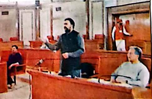
کوئٹہ: وزیر اعلیٰ بلوچستان میر سرفراز بھٹی کی عدالت میں ایک بیان کر رہے ہیں