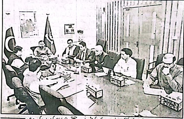
وزیر اعلیٰ میر سر فرادینی کونڈا پشٹ پر دیکھت کی پیش رفت سے متعلق جائزہ اجلاس کی صدارت کر رہے ہیں

بلوچستان مختلف قومیتوں اور تہذیبوں کا گلدستہ، ہر رنگ قابل قدر اور قابل فخر ہے۔ مبارکباد پیش کرتے ہوئے کہا ہے کہ ہزارہ لیونٹی نے ہزارہ چمڑے کے موٹن پر ہزارہ برادری کو ملی بلوچستان کی ایک خوبصورت اور آباد کار ثقافتی پہچان ہے، جو اپنی تہذیب، طرز زندگی اور لازوال روایات کے ذریعے ہماری معاشرتی ہم آہنگی کو تقویت دیتی ہے اپنے شہینہ پیغام میں وزیر اعلیٰ نے کہا کہ ہزارہ قوم کا تمدن وسط ایشیائی اثرات اور مقامی ثقافت کے اجزاج کاسین گس ہے، جو کونڈ کی پہچان اور توح کا اہم جزو ہے۔ انہوں نے کہا کہ ہزارہ برادری نے ہر میدان میں اپنی صلاحیتوں کا لوہا منوایا ہے، چاہے وہ تعلیم ہو، دفاع، صحت یا سرکاری خدمات، انہوں نے ہر مقام پر ملک و قوم کی خدمت کو اپنا شعار بنایا وزیر اعلیٰ نے کہا کہ ہزارہ کی چمڑ میں موجود روایتی کمانے، لپاس، زبان اور ادب معاشرتی یکجہت اور قومی یکجہتی کی علامت ہیں۔ انہوں نے کہا کہ ہزارہ چمڑ ڈے نہ صرف ثقافتی ورثے کی عکاسی کرتا ہے بلکہ پوری دنیا کو یہ پیغام دیتا ہے کہ بلوچستان مختلف قومیتوں اور تہذیبوں کا گلدستہ ہے، جہاں ہر رنگ قابل قدر اور قابل فخر ہے۔