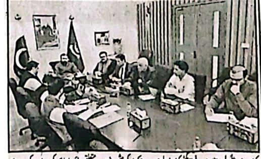
کونسلر ایس ڈی پی میں شامل کیے جانے والے منسوبے کی ضرورت برقرار رکھنے اور ان کی ترقیاتی کاموں کو بروقت پیش کرنے کے لیے حکومت کے سامنے رکھا جائے گا۔