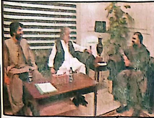
ذریعہ اعلیٰ سربراہی بلوچستان سے سربراہ اور نمانہ ناصر اور قادی خانہ استفسارات کر رہے ہیں