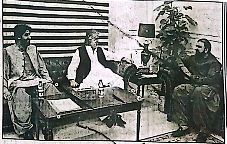
وزیر اعلیٰ بلوچستان میر سر فرادینی سے سردار انور خان ناصر اور قاری خان ناصر ملاقات کر رہے ہیں