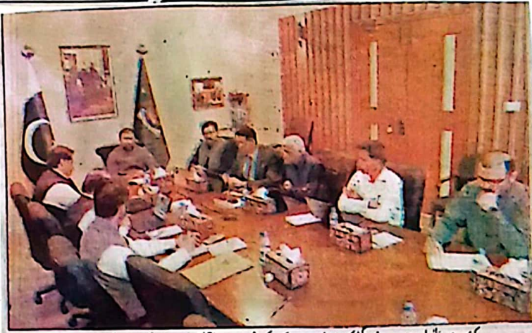
کوئٹہ وزیر اعلیٰ بلوچستان میر فرادین کی صدارت میں منعقد ہوا اجلاس کی صدارت کر رہے ہیں

کوئٹہ (شان) وزیر اعلیٰ بلوچستان میر فرادین کی (PSPD) پر قور کے لیے ایک ہائر ایڈوائز اہلاس کی صدارت میں منعقد ہوا اجلاس میں سویا ڈیرہ خزانہ سر مشیب لوشیر والی سویا ڈیرہ منسوب بندی اور قیادت پر 8 مئی 2025 کوئٹہ اور بلوچستان کی جغرافیائی وسعت اور زمینی حقائق کے پیش نظر دفاعی حکومت کو ترقیاتی فنڈز کی فراہمی میں خاص ترجیح دینی چاہیے۔