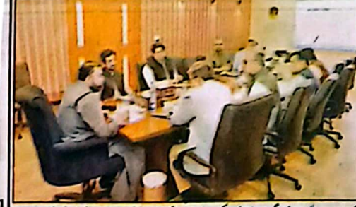
کوئٹہ: وزیر اعلیٰ سرسرفراز بگٹی کی زیر صدارت کیے گئے اجلاس میں اہم فیصلے کی رونق سے متعلق اعلیٰ سطحی اجلاس میں ہوا جس میں متحدہ اہم فیصلے کیے گئے۔