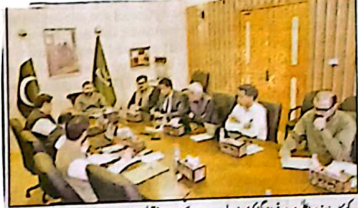
کوئٹہ: وزیر اعلیٰ سرسرفراز بگٹی کی زیر صدارت کیے گئے اجلاس میں اہم فیصلے کی رونق سے متعلق اعلیٰ سطحی اجلاس میں ہوا جس میں متحدہ اہم فیصلے کیے گئے۔

اجلاس میں وزیر اعلیٰ بلوچستان سرسرفراز بگٹی کی زیر صدارت کیے گئے اجلاس میں اہم فیصلے کی رونق سے متعلق اعلیٰ سطحی اجلاس وزیر اعلیٰ نیکو لیت میں ہوا جس میں متحدہ اہم فیصلے کیے گئے۔