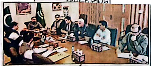
وزیر اعلیٰ بلوچستان میر مرزا ابراہیم خان کو سڈو پینٹ پر اجیت کی پیشرفت سے متعلق جائزہ اجلاس کی صدارت کر رہے ہیں

پانچ ایس ڈی اے کے لیے پانچ منصفوں کی تجویز کر کے پانچ ایس ڈی اے