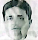
تحریب اشتر مہمکی آئی جی ایف آئی، سابق ڈائریکٹر جنرل ایف آئی

19 مئی 2025 کو پاکستان اور ایران اللہ سے ماجا ہے۔ یہ جہاں پر قوم مذہب سے نفس رکھے والے لڑو، لڑو، ہیں۔ شہس اور اسی میں تمام دہائی آزادی حاصل ہے۔ تمام مذہب سے نفس رکھے والے لڑو اور اسی میں تمام دہائی آزادی حاصل ہے۔ تمام مذہب سے نفس رکھے والے لڑو اور اسی میں تمام دہائی آزادی حاصل ہے۔ پاکستان کے لئے ایک نیا دور ہے۔ پاکستانی قوم کی بھینچ میں دشمن کے خلاف لڑ رہے ہیں۔ پاکستانی قوم کی بھینچ میں دشمن کے خلاف لڑ رہے ہیں۔ پاکستانی قوم کی بھینچ میں دشمن کے خلاف لڑ رہے ہیں۔ پاکستان کے لئے ایک نیا دور ہے۔ پاکستانی قوم کی بھینچ میں دشمن کے خلاف لڑ رہے ہیں۔ پاکستانی قوم کی بھینچ میں دشمن کے خلاف لڑ رہے ہیں۔ پاکستانی قوم کی بھینچ میں دشمن کے خلاف لڑ رہے ہیں۔ پاکستان کے لئے ایک نیا دور ہے۔ پاکستانی قوم کی بھینچ میں دشمن کے خلاف لڑ رہے ہیں۔ پاکستانی قوم کی بھینچ میں دشمن کے خلاف لڑ رہے ہیں۔ پاکستانی قوم کی بھینچ میں دشمن کے خلاف لڑ رہے ہیں۔