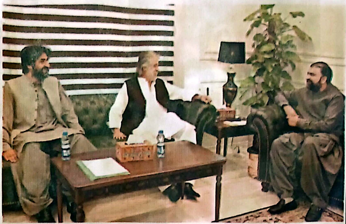
QUETTA: Sardar Anwar Khan Nasir exchanging views with Chief Minister Mir Barfraz Bugli on Monday.