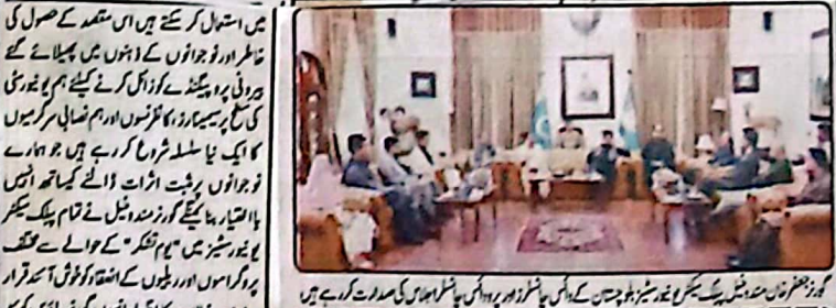
گورنر جعفر خان مندوخیل سے مل کر ان کی قیادت میں وفد ملاقات کر رہا ہے

مشرقی اور جھنگی ملازمتوں کو بہتر سرگرمیوں میں استعمال کر سکتے ہیں شیخ جعفر مندوخیل فوجیوں کے انہوں سے پھیلائے جراثیمی پرہیز کو ذرا دل کرنے کیلئے ہم جو فوجی کی سطح پر سیٹیا رز، کالونوں اور ہم نصابی سرگرمیوں کا ایک نیا سلسلہ شروع کر رہے ہیں جو ہمارے فوجیوں پر بہتر اثرات ڈالنے کیلئے اختیار کیا جائیگا۔ گورنر مندوخیل نے تمام بلک سیکر جو ریشیز میں "مجموعہ فکر" کے حوالے سے مختلف پروگراموں اور ریلیوں کے اہتمام کو فوجی آفس قرار دیا، ان خیالات کا اظہار انہوں نے گورنر ہاؤس کوئٹہ میں بلوچستان کی تمام بلک سیکر جو ریشیز کے وائس چانسلرز اور پرووائس چانسلرز کے ساتھ اجلاس میں گفتگو کرتے ہوئے کیا، اس موقع پر گورنر بلوچستان جعفر خان مندوخیل نے کہا کہ حالیہ پاکستان اور بھارت کے درمیان جنگ میں افواج پاکستان نے عہدہ دہی رتی کو کھڑا کر کے اپنی دلیری اور جرات کا مظاہرہ کرتے ہوئے تاریخ میں ایک باگراں فتح رقم کی ہے۔ یہ شانداز جیت افواج پاکستان کی طاقت کا پورا ثبوت ہوئے کے ساتھ ساتھ مسلم ممالک کیلئے امید کی کرن بھی ہے۔ اس ضمن میں ضروری ہے کہ اپنی فوجی قوت میں احساس اور داری اور حب الوطنی کو برواں کر چکا ہے۔