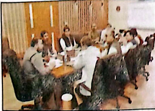
ادارہ اعلیٰ سربراہان قومی لیڈر، لیڈر ایکٹو نیٹ ورک اور اہلکاروں کی صدارت کر رہے ہیں

DIRECTORATE GENERAL OF PUBLIC RELATIONS BALUCHISTAN