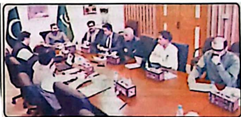
وزیر اعلیٰ بلوچستان میر سرفراز بھٹی کوئٹہ اوچھٹہ اور چیف کیٹ کی پیش رفت سے متعلق جانزداد اجلاس کی صدارت کر رہے ہیں

ایک خوبصورت اور باوقار ثقافتی پہچان ہے، جراثی تہذیب، طرز زندگی اور لازوال روایات کے ذریعے ہماری معاشرتی ہم آہنگی کو تقویت دیتی ہے اپنے مثبت پیغام میں وزیر اعلیٰ نے کہا کہ ہزارہ قوم کا تھون وسط ایشیائی اثرات اور مقامی ثقافت کے اجزائے کا حسین گم ہے، جو کوئٹہ کی پہچان اور عروج کا اہم جز ہے۔