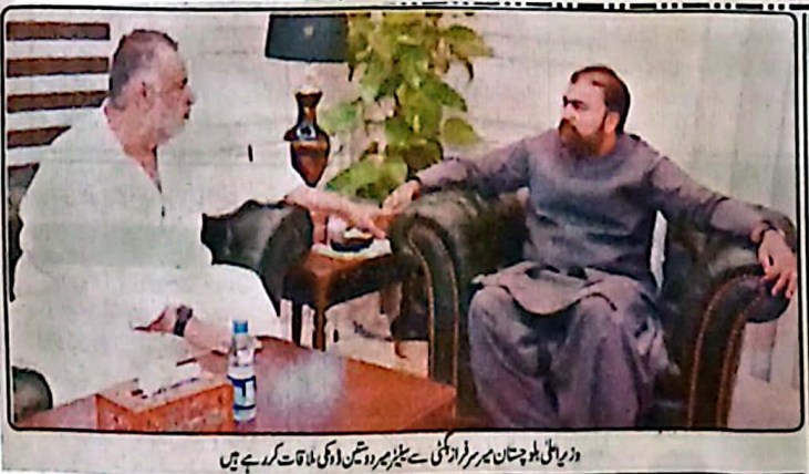
وزیر اعلیٰ بلوچستان میر سرفراز بھٹی سے میٹرز پر روٹین ڈاکو ملاقات کر رہے ہیں

ایک خدشہ انگیزی اقدامات کا فیصلہ کیا گیا وزیر اعلیٰ نے مرکزی شہر کو "اڈاکون ٹاؤن" قرار دینے کی منظوری دی جہاں رکنوں کی جگہ محدود تعداد میں جدید اور ماحول دوست الیکٹریک کاریں متعارف کرائی جائیں گی ان میں خواتین کے لیے خصوصی "چنگ کاریں" بھی شامل ہوں گی وزیر اعلیٰ نے اجلاس میں وال چانگ ایکٹ کی خلاف ورزی پر سخت برہمی کا اظہار کرتے ہوئے سیاسی جماعتوں اور اشتہاری کمپنیوں کو قانونی نوٹس جاری کرنے کی ہدایت کی وزیر اعلیٰ نے واضح کیا کہ حکمرانوں کی طرفوں سمیت کوئی بھی سیاسی تنظیم اگر خلاف ورزی کی سرکوب پالیسی کو اس کے خلاف بلا اختیار کارروائی عمل میں لائی جائے گی انہوں نے ہدایت کی کہ مجلسوں اور سیاسی سرگرمیوں کے بعد تمام چٹا ٹیکس اور دیگر گھسیٹتی سواد ذریعہ طور پر بتا دیا جائے قطعیت کے شے میں پیش رفت کے لیے وزیر اعلیٰ نے ہدایت کی کہ غیر فعال سرکاری اسکولوں کو بلوچستان ایجوکیشن اڈومنٹ فنڈ کے تحت فعال بنایا جائے غیر کاری کے فروغ کے لیے ملکہ جنگلات کو ایک جامع