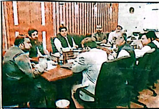
کوئٹہ، وزیر اعلیٰ سر مرزا ذہنی فیڈرل پی ایس ڈی پی سے متعلق جاززہ اجلاس کی صدارت کر رہے ہیں

پی ایس ڈی پی جاززہ اجلاس میں ترقیاتی منصوبوں کے ثمرات عوام تک پہنچانے مواعلت تو تامل صحت آپاشی تعلیم کے پراجیکٹس کو اولیت دینے پر اتفاق کیا گیا