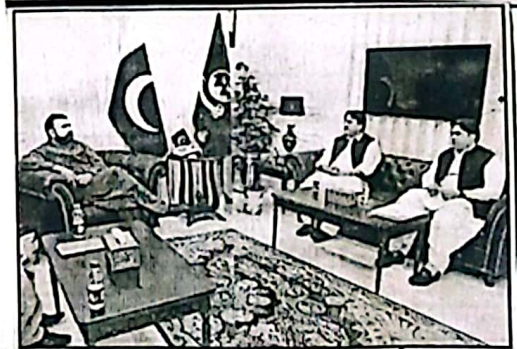
وزیر اعلیٰ بلوچستان سر مرزا زبیدی نے وفاقی ایس ڈی پی میں شامل کیے جانے والے منسوبے کی ضرورت برقرار رکھنے اور ان کی ترقیاتی کاموں کو بروقت پیش کرنے کے لیے حکومت کے سامنے رکھا جائے گا۔

کام نے شرکت کی اجلاس میں آئندہ مالی سال کے وفاقی ترقیاتی پروگرام میں بلوچستان کی ترقیاتی ضروریات اور ترجیحات کا مشتمل جائزہ لیا گیا وزیر اعلیٰ بلوچستان سر مرزا زبیدی نے اجلاس سے خطاب کرتے ہوئے کہا کہ فیڈرل پی ایس ڈی پی میں بلوچستان کے عوامی مفاد کے حال اجماعی ترقیاتی منسوبوں کو اولیت دی جائے گی انہوں نے کہا کہ ایس ڈی پی میں شامل کیے جانے والے منسوبے کی ضرورت برقرار رکھنے اور ان کی ترقیاتی کاموں کو بروقت پیش کرنے کے لیے حکومت کے سامنے رکھا جائے گا۔ وفاقی ایس ڈی پی میں شامل کیے جانے والے منسوبے کی ضرورت برقرار رکھنے اور ان کی ترقیاتی کاموں کو بروقت پیش کرنے کے لیے حکومت کے سامنے رکھا جائے گا۔