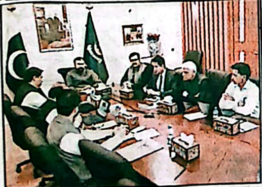
کوئٹہ، وزیر اعلیٰ سر مرزا ذہنی کوئٹہ ڈیپنٹ پر ڈیپنٹ سے متعلق جاززہ اجلاس کی صدارت کر رہے ہیں