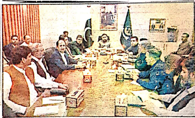
ڈی جی پی آر کے لیے مڈیا کو فوجیوں کی مافی ذہن سازی کے لیے بطور ہتھیار استعمال کر رہے ہیں

بلوچستان حالات: ڈی جی پی آر کے لیے مڈیا کو فوجیوں کی مافی ذہن سازی کے لیے بطور ہتھیار استعمال کر رہے ہیں اس سے نہ صرف عام لوگوں کو فوجیوں کی مافی ذہن سازی کے لیے بطور ہتھیار استعمال کر رہے ہیں بلکہ ان کے ذہنوں کو بھی ایسا ہی بنا رہے ہیں۔