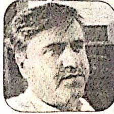
(رپورٹ محمد عیسیٰ محمد حسینی)

اس سے ان منصوبوں کو پائے تکمیل تک پہنچایا جاسکے گا۔ موصوف دو اہم آفسز ہیں جو شہر ہمدرد اور بلوچستان کے ترقیاتی منصوبوں کا اہم ترین حصہ بنیں گے۔ ان آفسز کے ذریعے حکومت بلوچستان کے منصوبوں کو پائے تکمیل تک پہنچایا جاسکے گا۔ موصوف دو اہم آفسز ہیں جو شہر ہمدرد اور بلوچستان کے ترقیاتی منصوبوں کا اہم ترین حصہ بنیں گے۔ ان آفسز کے ذریعے حکومت بلوچستان کے منصوبوں کو پائے تکمیل تک پہنچایا جاسکے گا۔ موصوف دو اہم آفسز ہیں جو شہر ہمدرد اور بلوچستان کے ترقیاتی منصوبوں کا اہم ترین حصہ بنیں گے۔ ان آفسز کے ذریعے حکومت بلوچستان کے منصوبوں کو پائے تکمیل تک پہنچایا جاسکے گا۔