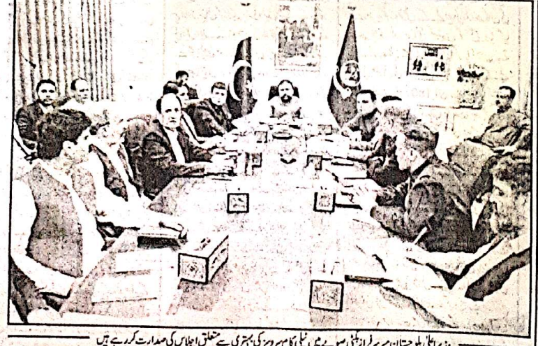
ذریعہ اعلیٰ بلوچستان سرسر فراز ایجنسی میں ٹیلی کام سرور کی اجلاس کی صدارت کر رہے ہیں

بلوچستان میں اقلیتوں کو یکساں مواقع فراہم کر رہے ہیں، میرسر فراز ایجنسی