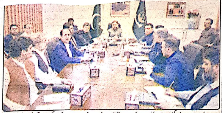
وزیر اعلیٰ بلوچستان میرسر فراز ایف صوبے میں ٹیلی کام سرور کی بحالی سے متعلق اجلاس کی صدارت کر رہے ہیں، چیف سیکریٹری ٹیلی کام اور دیگر اعلیٰ حکام شریک ہیں

نوجوانوں کی منفی ذہن سازی کے لیے بطور ہتھیار استعمال کر رہے ہیں انہوں نے کہا کہ نوجوانوں کو سوشل میڈیا کے ذریعے گمراہ کرنے کی کوششوں کا سدباب کرنا ضروری ہے تاکہ انہیں مثبت سمت میں