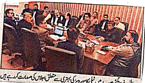
ڈیڑھ گھنٹہ سرسرازا کیلئے صوبائی سطح پر کامیابیوں کی صدارت کر رہے ہیں

پاکستان اور ایشیا کا کونسی موجود ہے وہ نے ہنگامہ مانتا مند میں ترقیاتی منصوبوں پر ڈیڑھ گھنٹہ بلوچستان کا شہرہ ادا کیا وہ سے گفتگو کرتے ہوئے ڈیڑھ گھنٹہ بلوچستان سرسرازا کیلئے ہنگامہ مانتا مند کو ریجنس فورس سائٹ بنانے کا عزم کرتے ہوئے آئندہ مالی سال کے صوبائی بجٹ میں مزید وسائل مختص کرنے کی یقین دہانی کر لی، سرسرازا کیلئے کہا کہ بلوچستان میں ڈیڑھ گھنٹہ اور بین الاقوامی سہ ماہی آئی ٹی کی جاتی ہے انہوں نے کہا کہ ہنگامہ مانتا مند میں ہر سال لاکھوں پڑوسی آتے ہیں اس لیے یہ مقام ایک عالمی سیٹل کی ڈیڑھ گھنٹہ سائٹ کے طور پر شہرہ ہو سکتا ہے یا تو یہ سہ ماہی سہ ماہی کیلئے کہا کہ بلوچستان کی معاشی و سماجی ترقی میں انٹرنیٹ کے کردار و سہ ماہی فراہم کرنے والوں کے ذریعہ ملے گا کہ پاکستان کی معاشی و سماجی ترقی میں انٹرنیٹ کے کردار و سہ ماہی فراہم کرنے والوں کیلئے کہا کہ