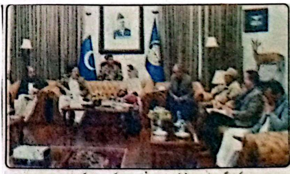
گورنر بلوچستان جعفر خان مندوخیل اجلاس کی صدارت کر رہے ہیں

کھیل نوجوانوں کو قہری سرگرمیوں میں شامل اور انہیں سماجی برائیوں سے بچانے کا بہترین ذریعہ ہے۔ اسپورٹس بورڈ کے سالانہ اجلاس سے خطاب کرتے ہوئے گورنر بلوچستان جعفر خان مندوخیل نے کہا کہ حکومت فوری طور پر ہر ڈسٹرکٹ کی سطح پر جدید اسپورٹس کلبس قائم کرنے کیلئے کھیلوں کے شائقین بھی موجود ہیں لیکن میدانوں اور ضروری سہولیات کی عدم موجودگی کے باعث وہ کئی کچھ اور سڑکوں پر کھیلنے پر مجبور ہیں۔ تو ایسی صورت ہم اپنے نوجوانوں سے کھیلوں میں شاعرانہ کارکردگی کی توقع کیسے کر سکتے ہیں؟ ان خیالات کا اظہار انہوں نے اسپورٹس بورڈ کے سالانہ اجلاس کی صدارت کرتے ہوئے کیا۔ اس موقع پر ایڈوائزر نوجو چیف خضر بلوچستان برائے اسپورٹس اینڈ ریجیو، صوبائی سیکرٹری اسپورٹس اینڈ یوتھ اینڈ سٹوڈنٹس، ڈی جی اسپورٹس یا سر بازی، عطاء محمد کا کڑ اور حیات اللہ خان درانی بھی موجود تھے۔ اس موقع پر گورنر بلوچستان جعفر خان مندوخیل نے کہا کہ ہر ملاہت دراصل مروج کا محتاج ہے۔ جب کسی کھیل کھلاڑی کے پاس ٹریننگ اینڈ پریکٹس کرنے کیلئے بنیادی سہولیات اور مواقع دستیاب نہ ہوں تو پھر اچھے سے اچھے کھلاڑی بھی ضائع ہو جاتے ہیں۔ کھیل جوہیت اور دھشت کو بدلنے کی طاقت رکھتا ہے۔ کھیل میں نوجوانوں میں بردباری پیدا کرنے، حوصلہ افزائی کرنے کی پوشیدہ صلاحیتوں میں نکھار پیدا کرنے کی طاقت ہے۔ یہ بات واضح ہے کہ ہر کھلاڑی اپنے صوبے اور ملک کا سفیر ہوتا ہے۔ وہ قومی اور بین الاقوامی سطح پر ہماری نمائندگی کرتے ہیں اور ان کو سہولیات فراہم کرنا حکومت کی ذمہ داری ہے۔ انہوں نے کہا کہ اسپورٹس میں ڈسپلن، محنت اور ٹیم ورک سکھاتا ہے۔ یہ ہمارے نوجوانوں کو قہری سرگرمیوں میں شامل کرنے اور انہیں سماجی برائیوں سے بچانے کا بہترین طریقہ ہے۔