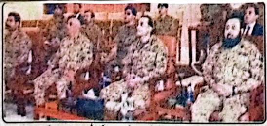
کوئٹہ، چیف آف آرمی اسٹاف جنرل سید عامر میر کو صوبے کی موجودہ سیکورٹی صورتحال پر بریفنگ دی جا رہی ہے

تقریب کی اور یقین دہانی کروائی کہ دہشت گردی کے خلاف جنگ میں پاک فوج بلوچستان کے لوگوں کے تحفظ اور خوشحالی کیلئے صوبائی حکومت کا ساتھ دے گی اور صوبے میں ترقی، امن اور استحکام کیلئے صوبائی حکومت کے شانہ بشانہ کام کرے گی۔