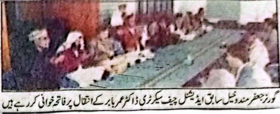
گورنر جعفر مندوخیل سابق ایڈیشنل چیف سیکرٹری ڈاکٹر عرابار کے انتقال پر فاتحہ خوانی کر رہے ہیں