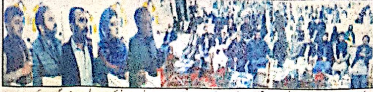
کونالہ خدمت فائز نشین اور کارکنوں سے وفاقی قلمب ڈاکٹر آصف محمود جاوید اور وزیر تعلیم راجہ سعید رحمانی مبارکبادی سکریٹری عبد المجید باقی اور دیگر خطاب کرتے ہیں۔