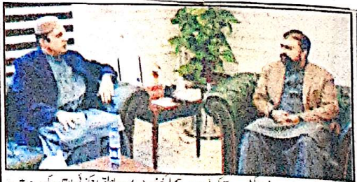
وزیر اعلیٰ بلوچستان میر فرزانہ سوبانی سے وزیر اعلیٰ پنجاب عثمان بزدار کی ملاقات کر رہے ہیں

کابینہ کے اجلاس میں منظور کیا گیا۔ کابینہ کے اجلاس میں منظور کیا گیا۔ کابینہ کے اجلاس میں منظور کیا گیا۔ کابینہ کے اجلاس میں منظور کیا گیا۔ کابینہ کے اجلاس میں منظور کیا گیا۔ کابینہ کے اجلاس میں منظور کیا گیا۔