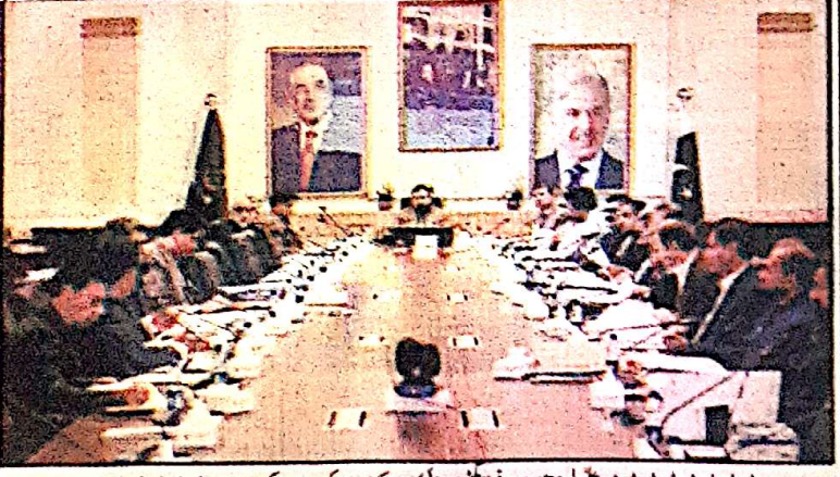
وزیر اعلیٰ بلوچستان میرسر فراز پٹی صوبائی کابینہ کے اجلاس کی صدارت کر رہے ہیں

دوست اور موثر استعمال کو یقینی بنایا جائے گا اس کے ساتھ ساتھ زرعی ٹیوب ویلون کی کٹنگی کو آسانی پر مشتمل کے لئے موثر قانون نافذ کرنے کا بھی فیصلہ کیا گیا اجلاس میں ماہی گیری اور آبی ذرائع کے لئے جی ایس کی منظوری دے دی گئی جو ماہی گیری کے شعبے کو جدید خطوط پر استوار کرنے میں مددگار ثابت ہوگی اجلاس میں بلوچستان ڈسپوزل آف موٹر ویکلز ریگولیشن 2025 کی بھی منظوری دی گئی جس سے گاڑیوں کی خرید و فروخت اور رجسٹریشن کے معاملات کو مزید شفاف بنایا جائے گا کابینہ نے سیلاب سے متاثرہ کینٹ کا پیمنٹ آف ایڈیٹوریل کے لئے اضافی کرائٹ جاری کرنے کا فیصلہ کیا جبکہ تعلیمی ترقی کے لئے دستیاب انفراسٹرکچر کے بہتر استعمال کو یقینی بنانے کا فیصلہ بھی کیا گیا تاکہ طلبہ کو جدید تعلیمی سہولیات فراہم کی جاسکیں اجلاس میں بلوچستان فروڈ اتھارٹی کی رپورٹ کے قیام کی منظوری دی گئی کابینہ نے تحصیل ڈیپوٹنگ کو اسے اپنا قرار دینے کی منظوری دی، محکمہ خوراک کی جانب سے خریدی گئی گندم کو اوپن مارکیٹ میں فروخت کرنے کے لئے کابینہ نے ایک سٹیبل تشکیل دینے کا فیصلہ کیا جو اس مسئلہ کی شفافیت کے ساتھ حل کرے گی اور مارکیٹ کا جائزہ لیکر قیمت فروخت کا تعین کرے گی، کابینہ نے راجنٹ ٹرانزیشن ایکٹ میں ضروری ترامیم کی بھی منظوری دی، پیمنٹ آف ایڈیٹوریل دہستے میں ایس ایس ٹی ٹائم کرنے کا فیصلہ کیا گیا تاکہ عوام کو بہتر سیکورٹی فراہم کی جاسکے کابینہ اجلاس میں انسداد دہشت گردی عدالت خضدار کے جج کی تقرری کی منظوری دی گئی