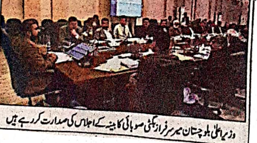
وزیر اعلیٰ بلوچستان سربراہان کی نشست کی مذمت کرتے ہوئے وزیر اعلیٰ بلوچستان نے کہا کہ وہ دہشت گردوں کی ایک فہرست کا درجہ نام لے رہے ہیں۔

آف سٹس اینڈ پبلک ریلیشنز (سٹ) کے ماہر ایئر پورٹ سے جاری کیے گئے ہیں جس میں سرکار کی ہجرت کے ساتھ ساتھ ہی آف سٹس اینڈ پبلک ریلیشنز کے ماہر نے یقین دلایا کہ وزیر اعلیٰ بلوچستان کی ہدایت پر عملدرآمد کرتے ہوئے جاری منصوبوں کی تکمیل کے لیے کام کر رہے ہیں۔