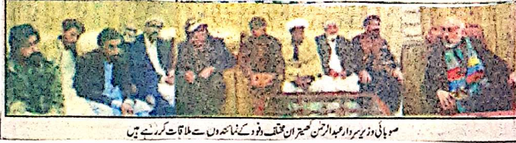
صوبائی وزیر سردار عبدالرشید کھچر ان مختلف وفد کے نمائندوں سے ملاقات کر رہے ہیں۔