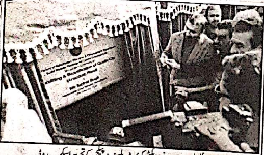
وزیر اعلیٰ بلوچستان سرفراز بھٹی کو کیو ڈی ویسٹ ٹیچ کے تحت اسکب روڈ توسیع منصوبے اور ماڈرن ٹریک پولیٹیک کا افتتاح کر رہے ہیں

ترقیاتی منصوبے عوامی فلاح و بہبود کیلئے انتہائی اہم ہیں، ایگزیکٹو رولڈ کو بین الاقوامی معیار کے مطابق بنائیں گے، یہ منصوبہ آٹاز کے بعد دو ماہ میں مکمل ہوگا وزیر اعلیٰ بلوچستان سرفراز بھٹی کو کیو ڈی ویسٹ ٹیچ کے تحت اسکب روڈ توسیع منصوبے اور ماڈرن ٹریک پولیٹیک کا افتتاح کر رہے ہیں