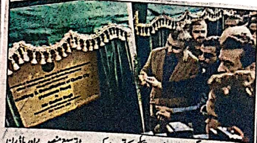
وزیر اعلیٰ بلوچستان سربراہان کی نشست کی مذمت کرتے ہوئے وزیر اعلیٰ بلوچستان نے کہا کہ وہ دہشت گردوں کی ایک فہرست کا درجہ نام لے رہے ہیں۔

ایک بارہا ان کے حوصلے بڑھ رہے ہیں، سربراہان کی نشست کی مذمت کرتے ہوئے وزیر اعلیٰ بلوچستان نے کہا کہ وہ دہشت گردوں کی ایک فہرست کا درجہ نام لے رہے ہیں۔