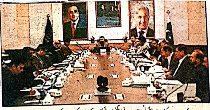
وزیر اعلیٰ بلوچستان ڈاکٹر عبدالملک رودت سیٹھی نے صوبائی کابینہ کے اجلاس کی صدارت کر رہے ہیں

وزیر اعلیٰ بلوچستان ڈاکٹر عبدالملک رودت سیٹھی نے پبلک ریلیشنز ٹریڈنگ کمپنی کا افتتاح کر رہے ہیں۔ وزیر اعلیٰ بلوچستان ڈاکٹر عبدالملک رودت سیٹھی نے پبلک ریلیشنز ٹریڈنگ کمپنی کا افتتاح کر رہے ہیں۔ وزیر اعلیٰ بلوچستان ڈاکٹر عبدالملک رودت سیٹھی نے پبلک ریلیشنز ٹریڈنگ کمپنی کا افتتاح کر رہے ہیں۔