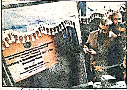
وزیر اعلیٰ بلوچستان ڈاکٹر عبدالملک رودت سیٹھی نے پبلک ریلیشنز ٹریڈنگ کمپنی کا افتتاح کر رہے ہیں

جلد 29 نمبر 21 فروری 2025ء بمطابق 22 شہتعبان 1446ھ قیمت 20 روپے شمارہ 52