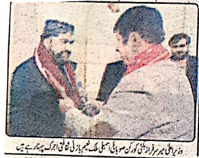
وزیر اعلیٰ میر سرفراز بلوچی کو گورنر صوبائی اسمبلی ملک فہم ہارنی نے فاتحہ پڑھا ہے ہیں

وزیر اعلیٰ بلوچستان سمنی جان کی والدہ کے انتقال پر اظہار افسوس و فاتحہ خوانی کوئٹہ (خ ن) وزیر اعلیٰ بلوچستان میر سرفراز بلوچی نے سابق گورنر محترمہ سائین کوآرڈینر سمنی جان کی والدہ کے انتقال پر گہرے دکھ اور افسوس کا اظہار کیا ہے انہوں نے سمنی جان سے تعزیت کا اظہار کرتے ہوئے مرحومہ کے درجات کی بلندی اور لواحقین کیلئے صبر جمیل کی دعا کی۔ 38 صفحہ نمبر 7 پر وزیر اعلیٰ اتوار کو سمنی جان کے ہاں گئے جہاں انہوں نے فاتحہ خوانی کی اور غمزدہ خاندان کے ساتھ دلی ہمدردی کا اظہار کیا۔