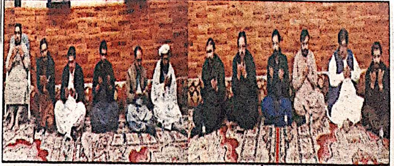
وزیر اعلیٰ بلوچستان میر سرفراز کھٹی سابق کوآرڈینر مومنجان کی والدہ کے انتقال پر تعزیت و فاتحہ خوانی کر رہے ہیں

کوئٹہ (یو این اے) وزیر اعلیٰ بلوچستان میر سرفراز کھٹی نے قلات میں لیویز چوکی پر حملے کی یاد دہانی کی اور فرائض کی ادائیگی میں جان نچھاور کر کے بہادری کی مثال قائم کی۔ وزیر اعلیٰ بلوچستان میر سرفراز کھٹی کا مومنجان کی والدہ کے انتقال پر دکھ اور آنسوؤں کا اظہار مرحومہ کے درجات کی بلندی اور لواحقین کے لیے صبر جمیل کی دعا کوئٹہ (آن لائن) وزیر اعلیٰ بلوچستان میر سرفراز کھٹی نے سابق کوآرڈینر مومنجان کی والدہ کے انتقال پر دکھ اور آنسوؤں کا اظہار کیا ہے۔ انہوں نے مومنجان سے تعزیت کا اظہار کرتے ہوئے مرحومہ کی بلندی اور لواحقین کے لیے صبر جمیل کی دعا کی اور قربانیاں رائیگاں نہیں جائیں گی، بلوچستان کے عوام کے تحفظ کے لیے سیکورٹی فورسز کی قربانیوں کو ہمیشہ یاد رکھا جائے گا۔