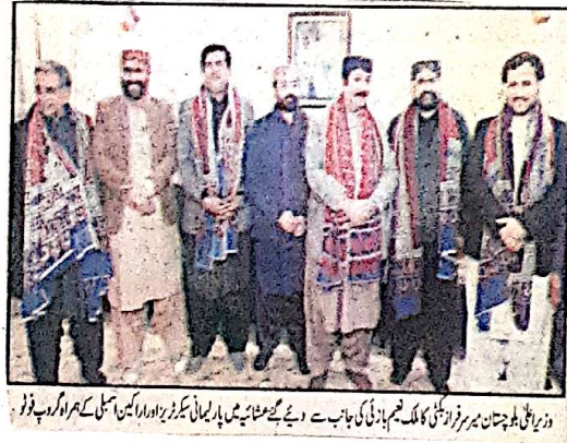
وزیر اعلیٰ بلوچستان میر سرفراز بگٹی کا ملک نسیم خان باؤنی کی جانب سے دیئے گئے عشاء میں پارلیمانی سیکرٹری اور اراکین اسمبلی کے ہمراہ گروپ فوٹو

اور دیگر اہم شخصیات نے بھی شرکت کی۔ اس موقع پر صوبے میں ترقیاتی منصوبوں، حکومتی پالیسیوں اور عوامی تعلق اور پرچار و بہبود سے متعلق امور پر چارہ خیال کیا گیا۔ وزیر اعلیٰ میر سرفراز بگٹی نے عشاء میں شرکت پارلیمانی سیکرٹری اور اراکین صوبائی اسمبلی سے بات چیت کرتے ہوئے کہا کہ بلوچستان کی ترقی اور عوامی خوشحالی کے لیے تمام اتحادی جماعتیں پوری نیک نیتی سے کام کر رہی ہیں حکومت بلوچستان عوامی خدمت کے جذبے کے تحت علاقائی منصوبوں پر تیزی سے عملدرآمد کر رہی ہے اور تمام امور میں اتحادی جماعتوں کی مشاورت و تعاون حاصل ہے اس موقع پر اظہار خیال کرتے ہوئے ملک نسیم خان باؤنی نے کہا کہ حکومت بلوچستان کے ترقیاتی اقدامات کو مزید مضبوط کرنے کے لیے وہ اور ان کی معاونت وزیر اعلیٰ کے شانہ بشانہ کوششیں کریں گے اس پر تمام اراکین نے اپنی مبارکباد اور کامیابی کے لیے عوامی اقدامات کا بھرپور ساتھ دیا جائے گا۔