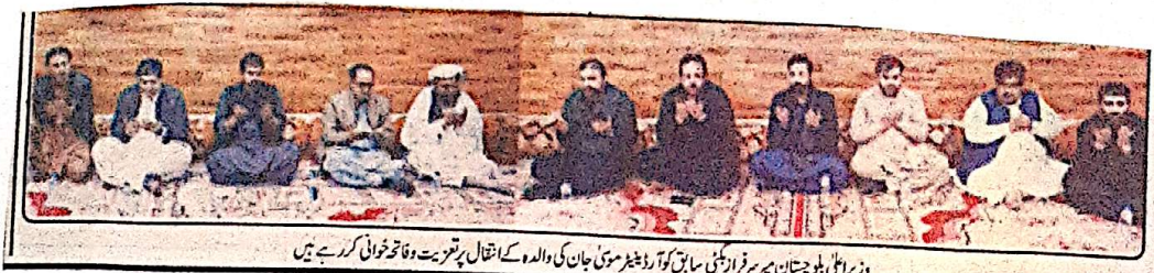
وزیر اعلیٰ بلوچستان میر سرفراز بلوچی سائین کوآرڈینر سمنی جان کی والدہ کے انتقال پر تعزیت و فاتحہ خوانی کر رہے ہیں