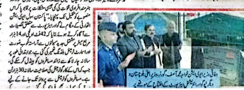
گواڈر انٹرنیشنل ایئرپورٹ کی افتتاحی تقریب کے موقع پر سرکاری اہلکاروں کی ایک گروپ کی تصویر

گواڈر انٹرنیشنل ایئرپورٹ کی تعمیر وترقی کے لیے چینی حکومت نے نصف سے زائد رقم فراہم کی ہے۔ گواڈر انٹرنیشنل ایئرپورٹ کی تعمیر وترقی کے لیے چینی حکومت نے نصف سے زائد رقم فراہم کی ہے۔ گواڈر انٹرنیشنل ایئرپورٹ کی تعمیر وترقی کے لیے چینی حکومت نے نصف سے زائد رقم فراہم کی ہے۔ گواڈر انٹرنیشنل ایئرپورٹ کی تعمیر وترقی کے لیے چینی حکومت نے نصف سے زائد رقم فراہم کی ہے۔ گواڈر انٹرنیشنل ایئرپورٹ کی تعمیر وترقی کے لیے چینی حکومت نے نصف سے زائد رقم فراہم کی ہے۔ گواڈر انٹرنیشنل ایئرپورٹ کی تعمیر وترقی کے لیے چینی حکومت نے نصف سے زائد رقم فراہم کی ہے۔