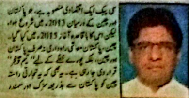
فرخ شہزاد ملک، وزیر

گواڈر انٹرنیشنل ایئرپورٹ کی تعمیر وترقی کے لیے چینی حکومت نے نصف سے زائد رقم فراہم کی ہے۔ گواڈر انٹرنیشنل ایئرپورٹ کی تعمیر وترقی کے لیے چینی حکومت نے نصف سے زائد رقم فراہم کی ہے۔ گواڈر انٹرنیشنل ایئرپورٹ کی تعمیر وترقی کے لیے چینی حکومت نے نصف سے زائد رقم فراہم کی ہے۔