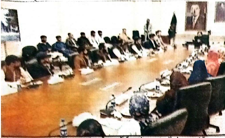
وزیر اعلیٰ بلوچستان میر سرفراز بھٹی سے سینیٹر یونس نوری اف، ایچ ایچ پی آر اے ڈائریکٹر میرین سائمنز کے طلبہ اور قومی لیگنٹ کے ممبران ملاقات کر رہے ہیں