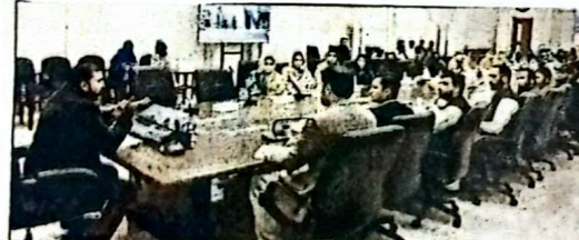
وزیر اعلیٰ بلوچستان میر سر فرسز نے سوشل میڈیا مینجمنٹ آف ایگریکلچر و واٹر اینڈ میرین سائنسز کے طلباء اور فیکلٹی ممبران سے ملاقات کر رہے ہیں

کیس انہوں نے کہا کہ آڈیٹیشنل انسپکٹس کے اس دور میں نوجوانوں پر پھانسی چاہنے کی بھاری بھاری ذمہ داری عامہ ہوتی ہے بد قسمتی سے بے جہاد پروپیگنڈوں کے ذریعے نوجوانوں کو ریاست سے دور کرنے کی کوشش کی جاری ہے جبکہ سوشل میڈیا کے منہ پر ہتھیار ڈالنے، پرنسپل روٹیوں اور سوشل میڈیا مینجمنٹ کے ذریعے نوجوانوں کو گمراہ کیا جا رہا ہے وزیر اعلیٰ بلوچستان نے خبردار کیا کہ ریاست پاکستان کے خلاف بیرون ملک سے منظم سوشل میڈیا ایسٹ ویس جوائنٹ چارہ ہے جس کے ذریعے نوجوانوں کی ذہنی سازش کر کے انہیں ریاست مخالف بنایا جا رہا ہے انہوں نے کہا کہ دہشت گردی کے خلاف جنگ میں جیت یا ہار کی ہوگی، سرسبز فرسز نے کہا کہ تعلیمی اداروں کو ریاست مخالف عناصر کی سرگرمیاں بننے کی اجازت نہیں دی جانے گی انہوں نے کہا کہ دنیا کا کوئی بھی ملک اپنے شہریوں کو سرنگوں پر بیٹھ کر ریاست توڑنے کی باتیں کرنے کی اجازت نہیں دیتا ریاست کی سلامتی سب سے زیادہ اہم ہے اور کسی بھی سیاسی یا نظریاتی مفاد سے زیادہ اہمیت رکھتی ہے وزیر اعلیٰ بلوچستان نے کہا کہ غیر متوازن ترقی بلوچستان ہی نہیں بلکہ پورے پاکستان کا مسئلہ ہے انہوں نے اعتراف کیا کہ بلوچستان میں گزشتہ کئی دہائیوں کے مسائل کو چند سالوں میں حل کرنا ایک مشکل چیلنج ہے مگر حکومت گڈ گورننس کے ذریعے عمومی مسائل کے حل کیلئے پوری تہمتی سے کوشاں ہے انہوں نے کہا کہ بلوچستان کی ترقی میں باصلاحیت ہیں اور خواتین انتظامی افسران نے بہترین کارکردگی کا مظاہرہ کر کے اپنی صلاحیتوں کا لوہا منھایا ہے وزیر اعلیٰ بلوچستان میر سر فرسز نے طلباء پر زور دیا کہ وہ منہ پر ہتھیار ڈالنے سے دور رہیں اور اپنے علم، صلاحیت اور گمراہیوں کی ترقی کے لیے ہونے والی کوششیں