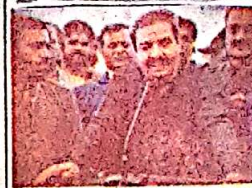
گوانی، صوبائی وزیر علی حسین زہری سوک کی تعمیر کے منصوبے کے موقع پر خطاب کر رہے ہیں