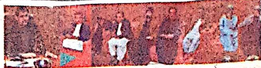
صوبائی وزیر لی اینڈ ڈی بیوریاپی سے مختلف ڈیولپمنٹ پروگراموں پر گفتگو کرتے ہیں