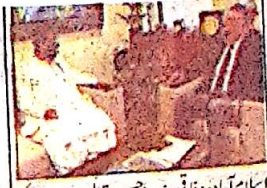
اسلام آباد، وفاقی وزیر احسن اقبال سے صوبائی وزیر عاصم کروگیو ملاقات کر رہے ہیں