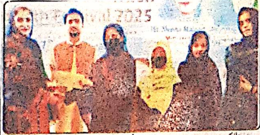
وزیر اعلیٰ کی ایڈوائزر برائے امور نوجوانان جتنا مجید نصیر آباد فیٹھیول میں طالبات کو انعام دے رہی ہیں