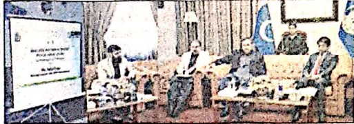
گورنر جنرل خٹک نے بے نظیر آگم سپورٹ پروگرام میں اظہار خیال کیا۔