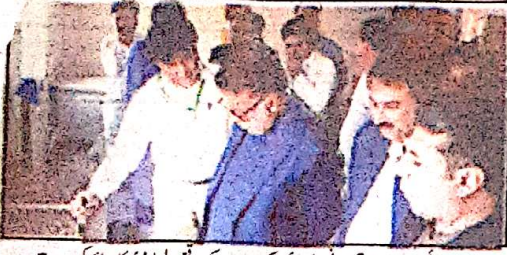
دندہ صوبائی وزیر میر صادق عمرانی دندہ روڈ ایم کے دورے کے موقع پر لیبارٹری کا معائنہ کر رہے ہیں