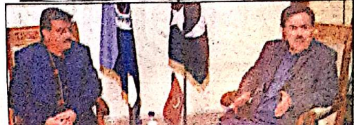
گورنر جنرل خٹک نے بے نظیر آگم سپورٹ پروگرام میں اظہار خیال کیا۔