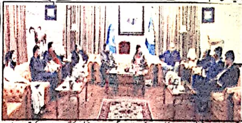
گورنر بلوچستان محمد وحید سے بینک الفلاح گروپ ہیڈ ریشل بینکنگ سیکٹر امریکہ کی قیادت میں وفد ملاقات کر رہا ہے

بینک جوائنٹ کیلئے بہتر مندی کو فروغ دے سکتے اور آسان قرضے فراہم کر کے چھوٹے کاروباروں کیلئے مدد کر سکتے ہیں۔ گورنر مندرجہ ذیل نوجوانوں کی ترقی اور خوشحالی کے لیے بینکنگ سیکٹر بلوچستان کی معیشت کو فروغ دینے میں اہم کردار ادا کر رہا ہے۔