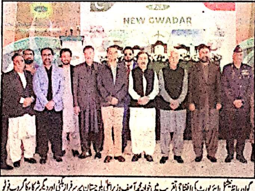
گورنر انٹیکسٹ ایز رپورٹ کی افتتاحی تقریب میں خواجہ محمد آصف وزیر اعلیٰ بلوچستان میر سراج دشتی اور دیگر شرکاء کا گروپ فوٹو

اقدامات کر رہی ہے۔ یہ بات انہوں نے گورنر میں قبائلی رہنما میر ساجد دشتی کے گھر پر علاقے کے مائیکرو اور عوامی رُو سے ملاقات کے دوران مکی اسٹیج پر مقامی افراد نے وزیر اعلیٰ بلوچستان میر سراج دشتی کو اپنے علاقوں کی ترقی اور عوامی مسائل کے حل کے لیے سنجیدہ اقدامات کر رہی ہے۔ یہ بات انہوں نے گورنر میں قبائلی رہنما میر ساجد دشتی کے گھر پر علاقے کے مائیکرو اور عوامی رُو سے ملاقات کے دوران مکی اسٹیج پر مقامی افراد نے وزیر اعلیٰ بلوچستان میر سراج دشتی کو اپنے علاقوں کی ترقی اور عوامی مسائل کے حل کے لیے سنجیدہ