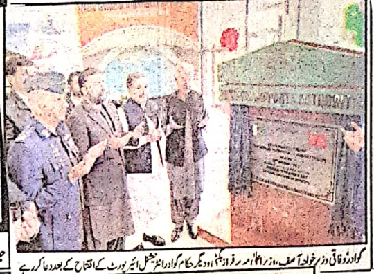
گورنر اعلیٰ وزیر خلیفہ آصف زرداری، وزیر اعلیٰ بلوچستان اور دیگر حکام کو اور انٹرنیشنل ایئر پورٹ کے افتتاح کے بعد دعا کر رہے