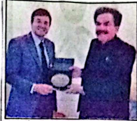
کراچی، گورنر جعفر مندوخیل کو امریکی تفصیلات جزل سوئٹرز پیش کر رہے ہیں