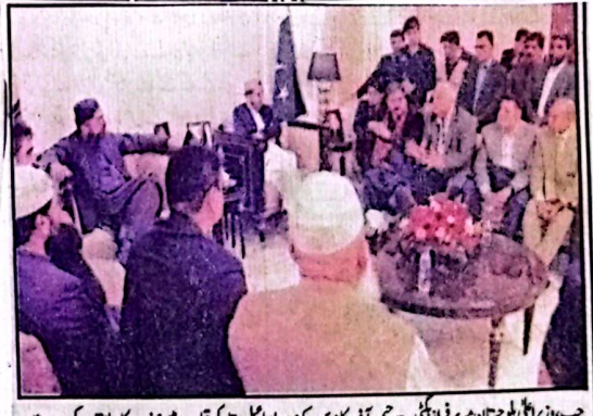
صوبائی وزیر اعلیٰ بلوچستان میر مرتضیٰ خاں نے پریس کانفرنس میں منصف کا ملاقات کرے ہیں

کوتنی کی راہ پر گامزن کرے گی۔ انہوں نے کہا کہ اب کی ترقی ہمارے دور میں چلنی ہوگی اور صوبائی وزارتوں کی جانب سے ہر ایک اقدامات پر عمل درآمد کو یقینی بنایا جائے گا انہوں نے کہا کہ صوبائی وزارتوں کے کابینے میں ہر ایک کی صلاحیت کو مدنظر رکھنا ہوگا اور صوبائی حکومت کے لیے نیشنل ایجنسیوں کی خدمات کو فروغ دینا ہوگا اور صوبائی حکومت کے لیے نیشنل ایجنسیوں کی خدمات کو فروغ دینا ہوگا اور صوبائی حکومت کے لیے نیشنل ایجنسیوں کی خدمات کو فروغ دینا ہوگا اور