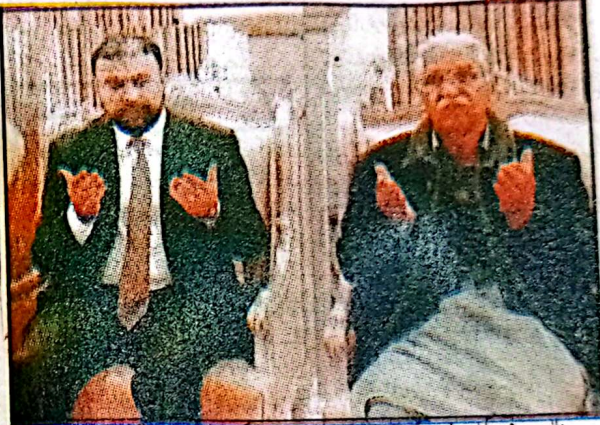
وزیر اعلیٰ میر سرفراز بگٹی پتیل پارٹی کے سکریٹری جنرل تیر بخاری سے اگلی ایمری وقات پر تعزیت کر رہے ہیں

میں سوگوار خاندان کے غم میں برابر کے شریک ہیں۔