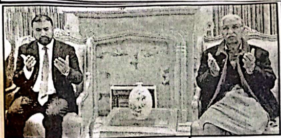
اسلام آباد، وزیر اعلیٰ بلوچستان سرفراز گنٹی (بمبارہ) کوئٹہ میں میڈیا سے ان کی اہلیہ کی وفات پر فاتحہ خوانی کر رہے ہیں

کامیابی پاکستان کی خلائی تحقیق کی ترقی کا مظہر ہے قومی ترقی کے لیے نیا باب کھولنے کا سبب بھی ہے کی کوئٹہ (آن لائن) وزیر اعلیٰ بلوچستان میر سرفراز گنٹی نے پاکستان کے مقامی ایئر وے آپریٹنگ سیٹلائٹ (EO-1) کی کامیاب لاچنگ پر قوم کو مبارکباد پیش کرتے ہوئے اسے پاکستان کی سائنس اور ٹیکنالوجی کے میدان میں ایک تاریخی سنگ میل قرار دیا ہے۔ (بقیہ نمبر 23 صفحہ 2 پر)