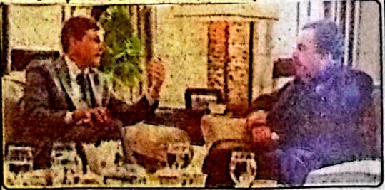
گورنر بلوچستان جعفر مندوخیل سے کراچی میں تفصیلات امریکی تفصیلات جزل ملاقات کر رہے ہیں