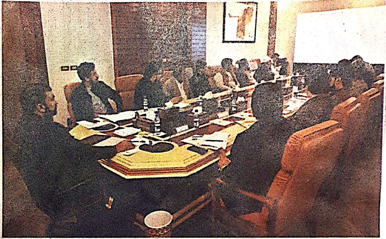
QUETTA: Balochistan Chief Minister Mir Sarfraz Bugti presiding over an important meeting of Mines and Minerals Department and representatives of mine owners on Tuesday.