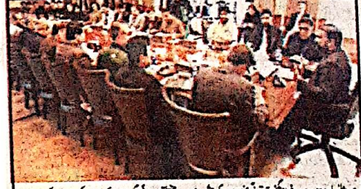
ڈیڑھ گھنٹہ کی نشست میں سندھ مسلم اور کھٹک کے بعض جموں کی جانب سے ترقیاتی منصوبوں میں سست روی اور ترقیاتی منصوبوں میں تاخیر پر شدید برائی کا اظہار

کا ڈیڑھ گھنٹہ کی نشست میں سندھ مسلم اور کھٹک کے بعض جموں کی جانب سے ترقیاتی منصوبوں میں سست روی اور ترقیاتی منصوبوں میں تاخیر پر شدید برائی کا اظہار