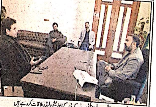
کوئٹہ، وزیر اعلیٰ گلشن جمالی نے کہا کہ بلوچستان میں سرزمین پر وراثت گردی کو کسی صورت برداشت نہیں کیا جائے گا، ہر فرزند کو اپنی اپنی زمین حاصل کرنی چاہیے۔

اور وہ کسی صورت برداشت نہیں کیا جائے گا، ہر فرزند کو اپنی اپنی زمین حاصل کرنی چاہیے۔ انہوں نے کہا کہ بلوچستان میں سرزمین پر وراثت گردی کو کسی صورت برداشت نہیں کیا جائے گا، ہر فرزند کو اپنی اپنی زمین حاصل کرنی چاہیے۔ انہوں نے کہا کہ بلوچستان میں سرزمین پر وراثت گردی کو کسی صورت برداشت نہیں کیا جائے گا، ہر فرزند کو اپنی اپنی زمین حاصل کرنی چاہیے۔