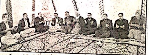
وزیر اعلیٰ بلوچستان سبزی فروش خاتون کی بھاری مالی معاونت کوئی نہ کوئی ایک باہت سبزی فروش خاتون کی خیر پر فوری نوٹس لینے ہوئے اہم اقدامات کیے۔

وزیر اعلیٰ بلوچستان کا دورہ حب عوامی حلقوں کا خیر مقدم حب (رخن) وزیر اعلیٰ بلوچستان کے 16 جنوری کو متوقع دورہ حب کا عوامی حلقوں کی جانب سے خیر مقدم کیا جا رہا ہے۔ وزیر اعلیٰ بلوچستان سبزی فروش خاتون کی بھاری مالی معاونت کوئی نہ کوئی ایک باہت سبزی فروش خاتون کی خیر پر فوری نوٹس لینے ہوئے اہم اقدامات کیے۔ دو کارپوریٹ بلوچستان جرنل سن ڈیڑھی دو گھنٹے کے ساتھ ہو گئے۔ ضلع حب کے عوام اس دورے کو بڑی اہمیت کا حامل قرار دے رہے ہیں اس دورے کے خاتمے سے حب کے عوام میں جوش و خروش پایا جاتا ہے۔ سبزی فروش خاتون کی بھاری مالی معاونت کوئی نہ کوئی ایک باہت سبزی فروش خاتون کی خیر پر فوری نوٹس لینے ہوئے اہم اقدامات کیے۔ وزیر اعلیٰ کے متوجہ دورے کے پیش نظر ڈسٹرکٹ ایڈمنسٹریٹو افسر نے حب میں سبزی فروش خاتون کی بھاری مالی معاونت کوئی نہ کوئی ایک باہت سبزی فروش خاتون کی خیر پر فوری نوٹس لینے ہوئے اہم اقدامات کیے۔ ہم کا آغاز کر دیا۔ ضلع حب درجی گڈائی سونہاری کے عوام وزیر اعلیٰ بلوچستان کے دورے کو ملانے کے لیے ایک خوش آئند اقدام تصور کر رہے ہیں۔