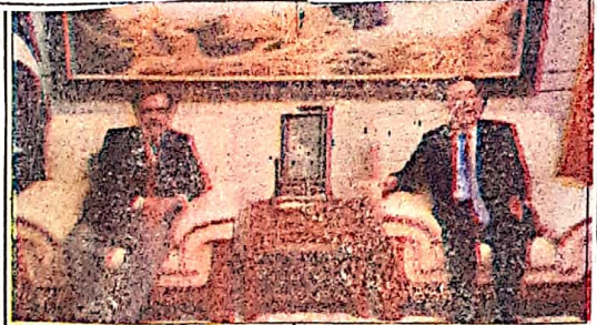
کراچی: گورنر بلوچستان جعفر مندوخیل چین کے قونصل جنرل سے ملاقات کر رہے ہیں۔

خلیجی سلامتی اور استحکام کیلئے پرعزم ہیں۔ ایک ہمارے قونصل جنرل کی ملاقات سے آئندہ کراچی (جنگ) گورنر بلوچستان جعفر خان مندوخیل نے کہا ہے کہ پاکستان اور چین خلیج میں استحکام اور سلامتی کو مضبوط بنانے کیلئے پرعزم راہداری (CPEC) ہمارے تعاون کی ایک روشن