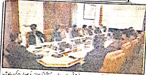
وزیر اعلیٰ بلوچستان سبزی فروش خاتون کی بھاری مالی معاونت کوئی نہ کوئی ایک باہت سبزی فروش خاتون کی خیر پر فوری نوٹس لینے ہوئے اہم اقدامات کیے۔

خاتون کی بھاری مالی معاونت بشپ کو ملانے کی اہم ترین سہولت فراہم کی گئی ہے۔ وزیر اعلیٰ نے خاتون کی بھاری مالی معاونت کوئی نہ کوئی ایک باہت سبزی فروش خاتون کی خیر پر فوری نوٹس لینے ہوئے اہم اقدامات کیے۔ ایک کوئی نہ کوئی کرنے کا انتظام کیا۔ سبزی فروش خاتون نے اس موقع پر کہا کہ محنت کش افراد معاشرے کا قیمتی سرمایہ ہیں اور ان کی مشکلات کا حل حکومت کی اولین ترجیح ہے۔ انہوں نے متعلقہ حکام کو ہدایت کی کہ خاتون اور ان کے اہل خانہ کو ہر ممکن تعاون فراہم کیا جائے۔