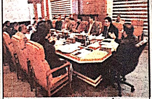
ڈیڑھ گھنٹہ کی نشست میں سندھ مسلم اور کھٹک کے بعض جموں کی جانب سے ترقیاتی منصوبوں میں سست روی اور ترقیاتی منصوبوں میں تاخیر پر شدید برائی کا اظہار

صدارت منگل کو چیف سیکرٹریٹ میں پبلک ریلیشنز ڈیپارٹمنٹ پر گرام