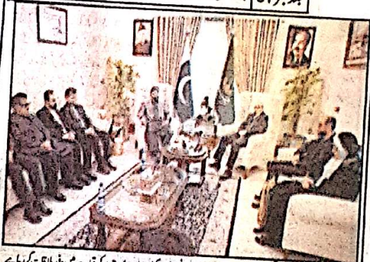
وزیر اعلیٰ گلشن جمالی نے کہا کہ بلوچستان میں سرزمین پر وراثت گردی کو کسی صورت برداشت نہیں کیا جائے گا، ہر فرزند کو اپنی اپنی زمین حاصل کرنی چاہیے۔

وزیر اعلیٰ گلشن جمالی نے کہا کہ بلوچستان میں سرزمین پر وراثت گردی کو کسی صورت برداشت نہیں کیا جائے گا، ہر فرزند کو اپنی اپنی زمین حاصل کرنی چاہیے۔ انہوں نے کہا کہ بلوچستان میں سرزمین پر وراثت گردی کو کسی صورت برداشت نہیں کیا جائے گا، ہر فرزند کو اپنی اپنی زمین حاصل کرنی چاہیے۔ انہوں نے کہا کہ بلوچستان میں سرزمین پر وراثت گردی کو کسی صورت برداشت نہیں کیا جائے گا، ہر فرزند کو اپنی اپنی زمین حاصل کرنی چاہیے۔