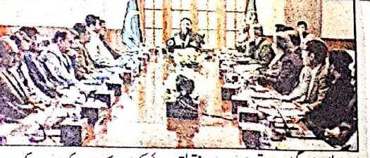
وزیر اعلیٰ بلوچستان میر فرراز خان کی زیر صدارت چیف منسٹر سیکرٹریٹ میں ہونے والے اجلاس میں چیف منسٹر سیکرٹریٹ کے سربراہان نے ترقیاتی منصوبوں کی رفتار اور معیار پر تفصیلی جائزہ دیا اور اجلاس (بانی صفحہ 5 نمبر 21) کے فیصلوں کی عملدرستی کیلئے اقدامات کی تجاویز پیش کیں۔