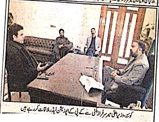
کوئٹہ، وزیر اعلیٰ میر فرخزاد کئی نئے کے پی کے اپوزیشن لیڈر قات کر رہے ہیں