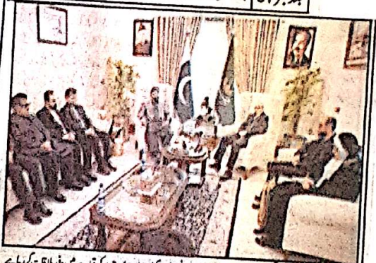
وزیر اعلیٰ بلوچستان میر فرخزاد کئی نئے پاکستان میں تہمت اہل طور و اکثر شاہد میری مقدم کی قیادت میں وفد قات کر رہے

بلوچستان کی سرزمین پر دہشت گردی کو کسی صورت برداشت نہیں کیا جائے گا، ہر فرزند کو دہشت گردی کا مسلح چمکی میں سکورنی فورسز کی جانب سے کامیاب آپریشن پر پاکستان کا اظہار کوئٹہ (آن لائن) وزیر اعلیٰ بلوچستان میر فرخزاد کئی نئے بلوچستان کے مسلح چمکی میں سکورنی فورسز کی جانب سے دہشت گردوں کے خلاف کامیاب آپریشن پر اظہار کا اظہار کیا ہے۔ وزیر اعلیٰ نے اس آپریشن اور دہشت گردی کی صورت برداشت نہیں کیا جائے گا، ہر فرزند کو سکورنی فورسز کی کارکردگی کی تعریف کرتے ہوئے کہا کہ دہشت گردوں کے خلاف اس طرح کارروائی سے یہ ثابت ہوتا ہے کہ فورسز اپنے فرائض اور صلاحیتوں کے ساتھ بلوچستان میں امن کی بحالی کے لیے کام کر رہی ہیں۔ انہوں نے کہا کہ فورسز کی قربانیاں، قہر فرمائشیں ہیں اور ان کی مسلسل جدوجہد سے ہی بلوچستان میں دہشت گردی کا خاتمہ ممکن ہو رہا ہے۔ وزیر اعلیٰ نے مزید کہا کہ گوام کے تحفظ کے لیے برگشتہ اقدامات جاری رہیں گے اور سکورنی فورسز کی کارروائیوں اس بات کی عکاس ہیں کہ حکومت اور فورسز مل کر بلوچستان میں امن و استحکام کے قیام کے لیے کوشاں ہیں۔