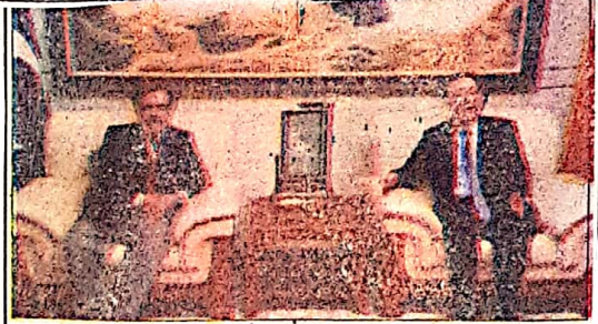
کراچی: گورنر بلوچستان چیئر مین منڈو خٹلی چین کے وفد سے ملاقات کر رہے ہیں۔

خٹلی کی سلامتی اور استحکام کے لیے پر عزم ہیں۔ ایک نیا دور کی روشنی میں ہے۔ چیئر مین منڈو خٹلی کی پانچ روزہ تفصیلی جہاز سے آئندہ ہیں ان کی دیرینہ دوستی پورے خطے میں امن کو برقرار رکھنے کیلئے اہم ہے۔ چین پاکستان اقتصادی راہداری (CPEC) ہمارے تعاون کی ایک روشن