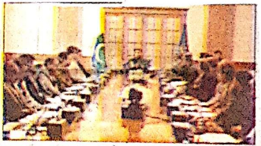
ایگزیکٹو کمیٹی کی اجلاس منعقد ہوئی جس میں وزیر اعلیٰ اور انٹرنیشنل ایسٹرنٹس کی درخواست پر ایگزیکٹو کمیٹی کی اجلاس منعقد ہوئی۔

ایگزیکٹو کمیٹی کی اجلاس منعقد ہوئی جس میں وزیر اعلیٰ اور انٹرنیشنل ایسٹرنٹس کی درخواست پر ایگزیکٹو کمیٹی کی اجلاس منعقد ہوئی۔ وزیر اعلیٰ نے اجلاس سے خطاب کرتے ہوئے کہا کہ ایگزیکٹو کمیٹی کی فروری 2025ء کی اجلاس سے خطاب کرتے ہوئے انٹرنیشنل ایسٹرنٹس کی درخواست پر ایگزیکٹو کمیٹی کی اجلاس منعقد ہوئی۔