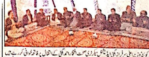
ایگزیکٹو کمیٹی کی اجلاس منعقد ہوئی جس میں وزیر اعلیٰ اور انٹرنیشنل ایسٹرنٹس کی درخواست پر ایگزیکٹو کمیٹی کی اجلاس منعقد ہوئی۔

ایگزیکٹو کمیٹی کی اجلاس منعقد ہوئی جس میں وزیر اعلیٰ اور انٹرنیشنل ایسٹرنٹس کی درخواست پر ایگزیکٹو کمیٹی کی اجلاس منعقد ہوئی۔ وزیر اعلیٰ نے اجلاس سے خطاب کرتے ہوئے کہا کہ ایگزیکٹو کمیٹی کی فروری 2025ء کی اجلاس سے خطاب کرتے ہوئے انٹرنیشنل ایسٹرنٹس کی درخواست پر ایگزیکٹو کمیٹی کی اجلاس منعقد ہوئی۔