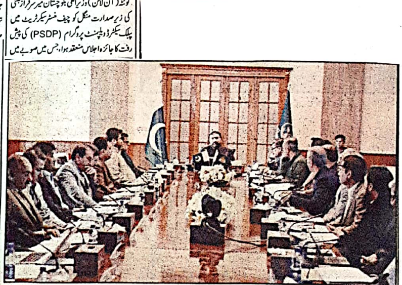
وزیر اعلیٰ بلوچستان میر فرزانہ بیگم کی زیر صدارت منگل کو چیف سیکریٹریٹ میں پبلک سیکرٹری ڈپٹی چیف سیکریٹری (PSDP) کی پیش رفت کا جائزہ اجلاس منعقد ہوا جس میں صوبے میں جاری ترقیاتی منصوبوں کی رفتار اور مہیا پر تفصیلی جائزہ خیال کیا گیا۔