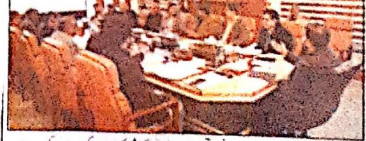
ایگزیکٹو کمیٹی کی اجلاس منعقد ہوئی جس میں وزیر اعلیٰ اور انٹرنیشنل ایسٹرنٹس کی درخواست پر ایگزیکٹو کمیٹی کی اجلاس منعقد ہوئی۔