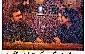
وزیر اعلیٰ میر سرفراز گینی اور رکن اسمبلی فرخ عظیم شاہ اجلاس کے دوران بات چیت کر رہے ہیں