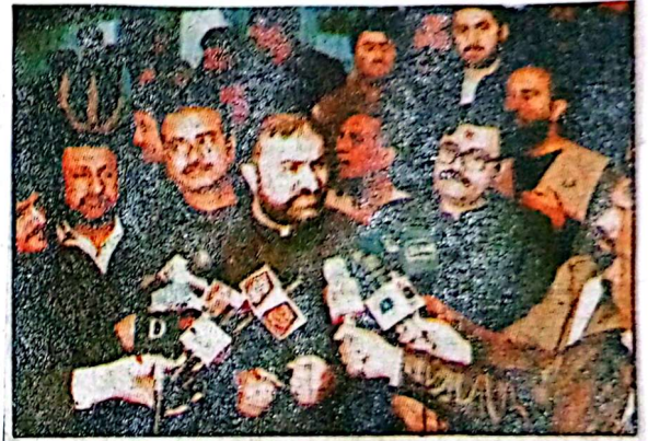
کوئی، وزیر اعلیٰ بلوچستان میر فرزا کی میڈیا سے بات چیت کر رہے ہیں

غواہ ہونے والوں کی بازیابی کیلئے حکومت مجیدی کیساتھ اقدامات اغواہی ہے مصور کا کر کے خاندان سے رابطہ میں ہوں حساس تفصیلات میڈیا پر نہیں بتا سکتا قومی شاہراہوں پر احتجاج سے سائفرز کو تکلیف ہوتی ہے طاقت کا استعمال سوچ بچ کر لایا جاتا ہے اسمبلی اجلاس کے بعد وزیر اعلیٰ میر فرزا کی میڈیا سے بات چیت کوئی (ابن ابن آئی) وزیر اعلیٰ بلوچستان میر فرزا سے اغواہ ہونے والے افراد کو بی ایل سے اغواہ سے تفصیلات کو میڈیا پر نہیں بتا سکتا، اسکل ڈیولپمنٹ کمپنی نے کہا ہے کہ واقف سے سوئے کھلی اور میس کی کیا، مصور کا کر کا معاملہ اغواہ برائے تادان کا ہے ان فراوانی کے حوالے سے درخواست کی ہے، شیعان کے خاندان سے رابطہ میں ہوں، تاہم حساس