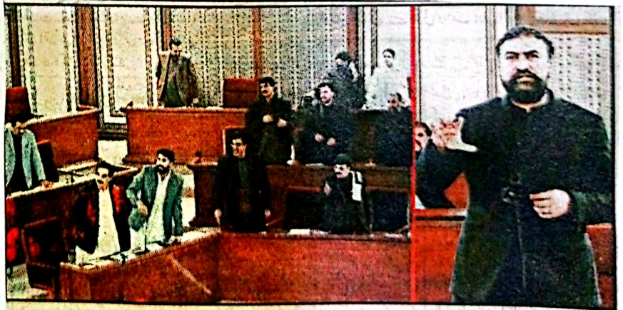
کوئی، وزیر اعلیٰ میر فرزا کی اسمبلی اجلاس میں اظہار خیال کر رہے ہیں دوسری جانب اپوزیشن اور اکر احتجاج ریکارڈ کروا رہے ہیں

آج ہمیں شدید ذوالفقار علی بھٹو کے وژن کو اپنانے کی ضرورت ہے، وزیر اعلیٰ شہید بھٹو کا عوامی خدمت کا جذبہ ہمارے لئے مستقل راہ ہے، 97 ویں سالگرہ پر پیغام کوئی (خ ن) وزیر اعلیٰ بلوچستان میر فرزا کی میڈیا سے بات چیت کر رہے ہیں پاکستان پیپلز پارٹی کے بانی شہید ذوالفقار علی بھٹو کے ذوالفقار علی بھٹو پاکستان کی تاریخ کے ایک ایسے قائد تھے جنہوں نے عوام کی فلاح و بہبود کو ہمیشہ اپنی اولین ترجیح بنایا ان کی قیادت میں پاکستان کو پہلی مرتبہ مستقلاً آئین ملا اور عوام ان کے حقوق کا شعور دیا گیا وزیر اعلیٰ نے کہا کہ ذوالفقار علی بھٹو نے صرف قومی سطح پر عوام کے دل جیتے بلکہ بلوچستان کے عوام کے ساتھ ان کی محبت اور لگاؤ ایک قابل ذکر پہلو ہے انہوں نے بلوچستان کے حقوق کی بحالی اور ترقیاتی منصوبوں کو اپنی حکومت کی ترجیحات میں شامل کیا جس سے مصوبے میں ترقی کے ایک نئے دور کا آغاز ہوا میر فرزا کی میڈیا سے کہا کہ تاہم عوام شہید ذوالفقار علی بھٹو نے بلوچستان کے عوام کے لیے روزگار، تعلیم، اور صحت کے مواقع فراہم کرنے میں کھری دیکھی لی ان کی لیسرٹ اور عوام دوستی کی بدولت بلوچستان کے عوام میں خود اعتمادی اور ترقی کی ایک پیلہ اٹھائی وزیر اعلیٰ میر فرزا کی میڈیا سے کہا کہ آج ہمیں ذوالفقار علی بھٹو کی عوام دوست پالیسیوں اور ان کے وژن کو اپنانے کی ضرورت ہے تاکہ ملک اور خصوصاً بلوچستان کو خوشحالی کی راہ پر گامزن کیا جاسکے بھٹو صاحب کی عوامی خدمت کا جذبہ ہمیشہ ہمارے لیے مشعل راہ رہے گا وزیر اعلیٰ بلوچستان نے ذوالفقار علی بھٹو کی خدمات کو پاکستان کی تاریخ کا ایک شہری باب قرار دیتے ہوئے کہا کہ ان کی قربانیوں کو ہمیشہ یاد رکھا جائے گا۔