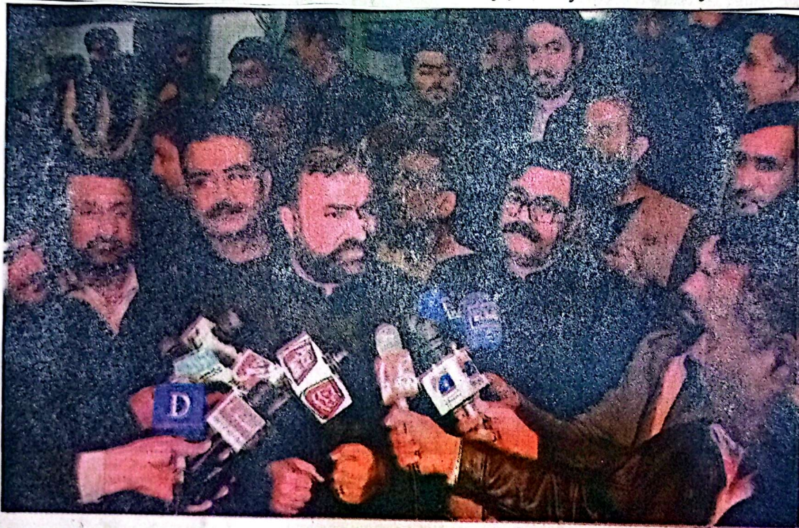
QUETTA: Balochistan Chief Minister Mir Sarfraz Bugti talking to media on Saturday.