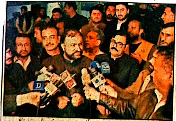
کوئٹہ، وزیر اعلیٰ بلوچستان میر سرفراز گل نے میڈیا سے بات چیت کر رہے ہیں

میں پولیس اور لیویز 2 سوازی فورس کب تک جیس کی آج نہیں تو کل نہیں لیویز کے حوالے سے فیصلہ کرنا ہوگا ان خیالات کا اظہار انہوں نے آسٹی اجلاس کے بعد میڈیا کے نمائندوں سے بات چیت کرتے ہوئے کیا۔ اس موقع پر صوبائی وزراء حاجی محمد خان لہڑی، میر برکت رندرن کن صوبائی آسٹی ملک محمد خان باڈی، نرگ خان مندوئل سمیت دیگر بھی موجود تھے۔ وزیر اعلیٰ بلوچستان سرفراز گل نے کہا کہ بلوچستان میں پولیس اور لیویز دو سوازی فورسز تک نہیں آج تک پولیس اور لیویز کے حوالے سے صورتحال کو مد نظر رکھتے ہوئے فیصلہ کرنا ہوگا ایک سوال کے جواب میں انہوں نے کہا کہ احتجاج کرنے والوں کو ایک موقع بات چیت کرنے کا دینے ہیں اور ہم قانون کے مطابق اختیارات کو استعمال کرنا چاہتے ہیں لیکن احتجاج کرنے والوں کو قوی ثابت رہوں برسر کرنے والوں اور زمینوں کیلئے مشکلات پیدا کرنے کی بجائے ان کی مشکلات کو دیکھنا چاہئے۔