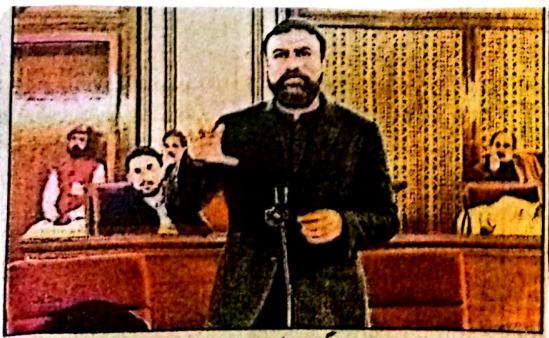
وزیر اعلیٰ بلوچستان سر فراز دکنی اسمبلی اجلاس میں اظہار خیال کر رہے ہیں

مظاہرین نے اس کے مطالبات سنتے ہیں۔ ایک سوال پر انہوں نے کہا کہ کوآپریٹو بینڈ کے حوالے سے وفاقی حکومت سے بات کی ہے سوہے کے سرحدی حالات کو بر نظر رکھتے ہوئے بلوچستان کے لوگوں کو گیس اور بجلی کی اشد ضرورت ہے۔ انہوں نے کہا کہ ملک میں بجلی موجود ہے لوگوں کی ادائیگی کا مسئلہ ہے عوام اپنے بلوں کی ادائیگی نہیں کرتے، وفاقی حکومت سے بات کی ہے کہ گیس اور بجلی کی فراہمی کو یقینی بنائے۔ لیویز فورس کو پس میں ختم کرنے سے متعلق ایک سوال پر انہوں نے