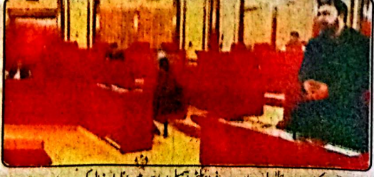
کوئی، وزیر اعلیٰ بلوچستان میر سر فراز نے آسٹری اجلاس میں اظہار خیال کر رہے ہیں

معاملات حساس ہیں میں مصروف کار کے والد سے رابطے میں ہوں شیعان سے انخواہ احکام تنظیم نے کیا اور مصروف کار کا انخواہ ان کے لئے ہے لیویز فورس ایک قبائلی فورس ہے جس طرح ایف سی نے ریفارمز کر کے ایک فورس بنی ہے اسی طرح لیویز کے لئے بھی ریفارمز کرنا ہوں گی۔ سکارشپ پروگرام چل رہا ہے نوجوانوں کو تربیت کی فراہمی کیلئے کام جاری ہے اس حوالے سے نوجوانوں کو نومبر دسمبر میں بھیجتا تھا لیکن اس ماہ پہلا سٹیج چلا جائے گا۔ حلقہ بی بی 45 سے پیپلز پارٹی کا کامیاب ہو گیا کیونکہ پہلے بھی پیپلز پارٹی نے یہ سٹیج جیتی تھی اور عوام کے تعاون سے کامیابی حاصل کی تھی اور دوبارہ کریں گے۔ ایک اور سوال کے جواب میں انہوں نے کہا کہ ملک میں اضافی بجلی ہونے کے باوجود صوبے میں بجلی کی لوڈ شیڈنگ بجلی کی تقسیم کارکنیاں عوام کے ساتھ زیادتیوں کر رہی ہیں بڑی جبر سے معاملات بہتر نہیں ہو رہے بلوچستان کے حالات اور درجہ حرارت کو متنبی حوالے سے مد نظر رکھتے ہوئے بجلی اور سونے گیس کی فراہمی یقینی بنانی چاہئے تاکہ لوگ سردی سے بچ سکیں کیونکہ کمپنیاں صوبے کے عوام کو پوری گیس اور بجلی دینے کی پابند ہیں۔