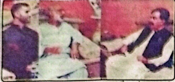
گورنر جنرل بلوچستان مندوخیل سردار فتح محمد شہی سے سیاسی سربراہان پر تبادلہ خیال کرتے ہیں گورنر مندوخیل محمد شہی

عبدالخالق ہزارہ پر قاتلانہ حملہ قابل مذمت ہے، گورنر مندوخیل