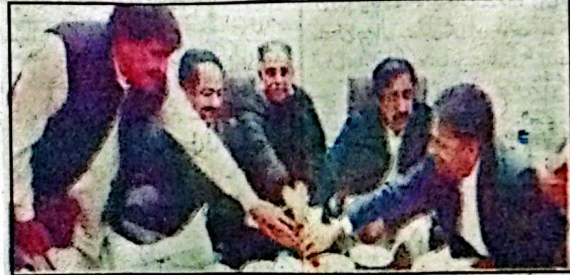
صوبائی وزیر حاجی نور محمد وٹیر، پارلیمانی سیکرٹری ایکسٹرنل حاجی محمد خان لہڑی، ڈائریکٹر جنرل بی ایف اے تیسق انڈیا کزنس سال 2025 کا ٹکٹ کاٹ رہے ہیں