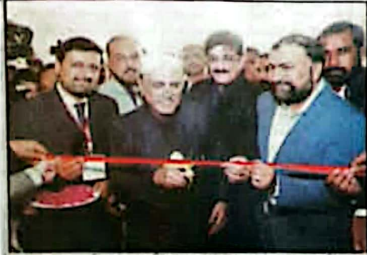
سمر ہمدانہ عطیہ علی زرداری فیما بین اسپتال کیس کا افتتاح کر رہے ہیں سنہ 2024ء بلوچستان کے ذرا باغی ممبر ہیں

جلد 28 | اتوار 29 دسمبر 2024ء بمطابق 26 جمادی الثانی 1446ھ قیمت 20 روپے | شمارہ 357