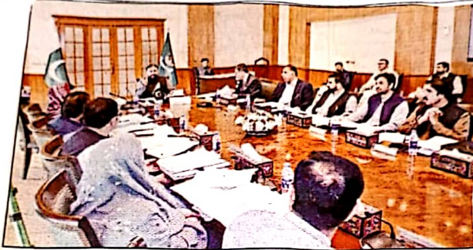
وزیر اعلیٰ بلوچستان مرزا زبکئی صوبائی کابینہ اجلاس کی صدارت کر رہے ہیں