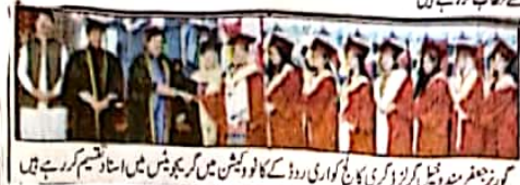
گورنر بلوچستان مندرجہ ذیل کورنٹ گورنر ڈگری کالج کواری روڈ کے کالونیشن میں گریجویٹس میں استاد تقسیم کر رہے ہیں