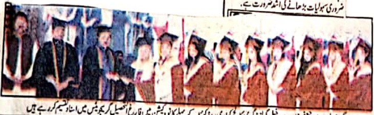
گورنر بلوچستان جعفر مندوخیل کورنٹ گورنر ڈگری کالج کواری روڈ کویشہ کے پہلے کالونیشن میں فارغ التحصیل گریجویٹس میں استاد تقسیم کر رہے ہیں

ملاقات میں دونوں رہنما نے 12 نومبر بروز منگل کے پارلیمانی گروپ اور پارٹی ممبرانوں کے اجلاس میں 40 صفحہ نمبر 7 سے متعلق انتظامات کا جائزہ لیا۔ بلوچستان کے صوبائی صدر اور جرنل بیکری نے صوبائی صدر اور جرنل بیکری سے ملاقات کی۔ (جو این اے) پاکستان مسلم لیگ (ن) بلوچستان کے صوبائی صدر گورنر بلوچستان شیخ جعفر مندوخیل سے مسلم لیگ (ن) کے صوبائی جرنل بیکری و رکن قومی اسمبلی جمال شاہ سے متعلق انتظامات کا جائزہ لینے کے لیے صوبائی صدر اور جرنل بیکری نے ملاقات کی۔