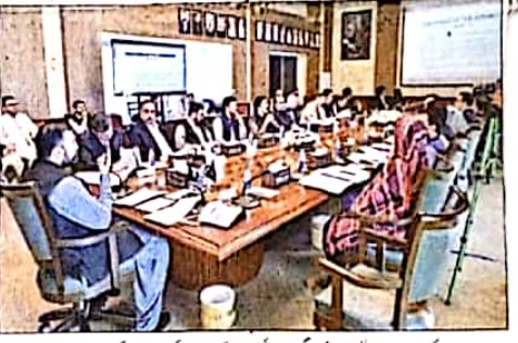
کوئٹہ: وزیر اعلیٰ بلوچستان عثمان بزدار کی صدارت میں اجلاس کی صدارت کر رہے ہیں

بلوچستان میں بحالی امن کیلئے مختلف سیکورٹی اداروں کے سربراہی اقدامات کو باہر دہشت گردانہ سرگرمیوں کو روکنے کے لیے بلوچستان سیکورٹی آف ویڈیز اور انسٹیبلشمنٹ ایکٹ 2024 کی منظوری سے ہوا۔