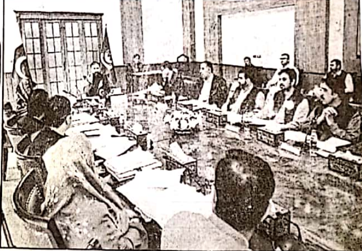
وزیر اعلیٰ بلوچستان میر سرفراز بگٹی صوبائی کابینہ کے اجلاس کی صدارت کر رہے ہیں

ایجنسیوں کی سرپرستی کے بارے میں فیصلہ کیا گیا اور اہل کاروں کے مسائل پر گفتگو کی گئی۔