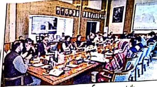
وزیر اعلیٰ بلوچستان میر فرراز بگٹی کی زیر صدارت صوبائی کابینہ کے اجلاس میں ریلوے اسٹیشن بم دھماکے کے شہداء کیلئے دعا کی جارہی ہے