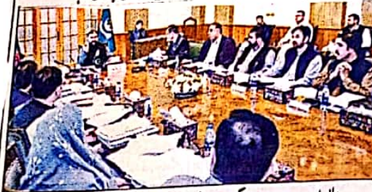
وزیر اعلیٰ بلوچستان میر فرراز بگٹی صوبائی کابینہ کے اجلاس کی صدارت کر رہے ہیں

کوئٹہ (رخن) وزیر اعلیٰ بلوچستان میر فرراز بگٹی نے غیب اکرم کو آٹھ سال کے لئے انٹرنیشنل ہاکی فیڈریشن کا صدر منتخب ہونے پر مبارکباد پیش کی ہے اور ایک تہنیتی پیام میں وزیر اعلیٰ نے کہا کہ پاکستان کو انٹرنیشنل ہاکی (باقی صفحہ 5 نمبر 23)