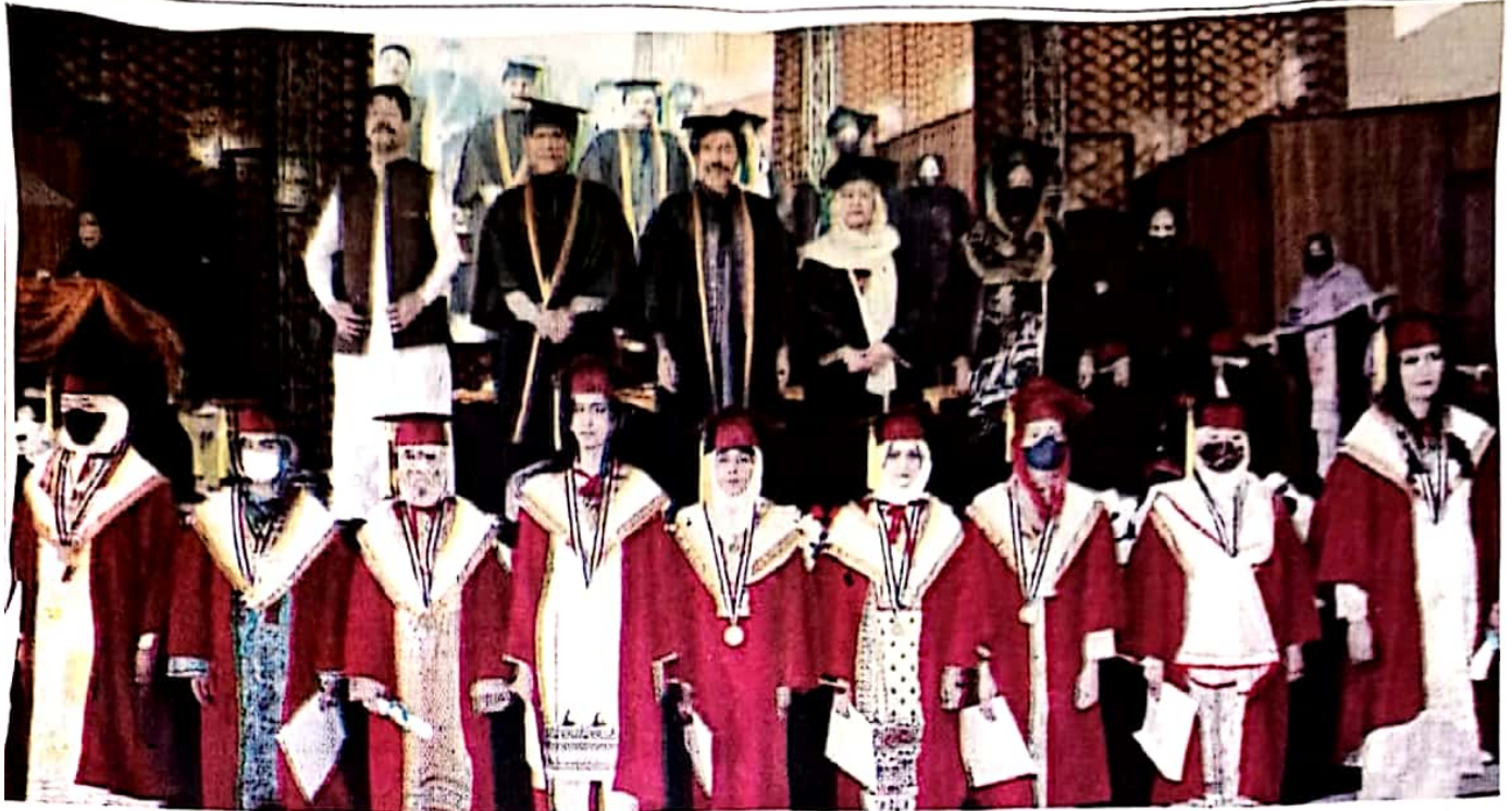
QUETTA: Governor Balochistan Jafar Khan Mandukhel in a group photo with gold medallists on the occasion of Quetta Girls Degree College's 1st convocation.