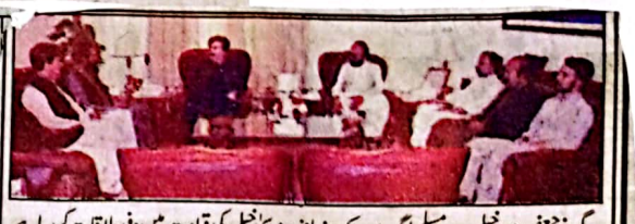
گورنر جعفر مندوخیل سے مسلم لیگ ن کے رہنما نذیر مویشی منڈی کی قیادت میں وفد ملاقات کر رہا ہے