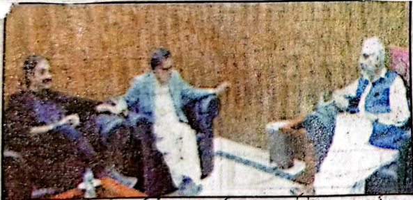
صوبائی وزیر سردار عبدالرحمن شہبازان سے صوبائی وزیر صادق عمرانی، رکن صوبائی اسمبلی نوابزادہ مظفر اللہ زہری ملاقات کر رہے ہیں