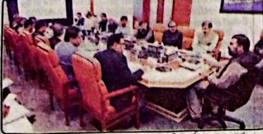
وزیر اعلیٰ بلوچستان میر سرفراز گلخی نے قیامی منصوبوں پر پیش رفت سے متعلق جائزہ اجلاس کی صدارت کر رہے ہیں