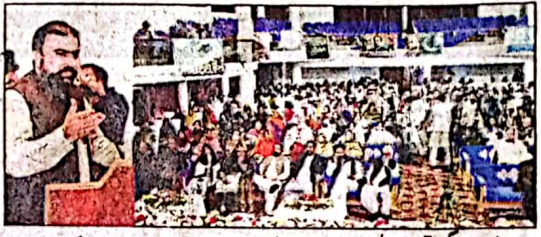
وزیر اعلیٰ میر فرزانہ بی بی ایم اقبال کی مناسبت سے تقریب سے خطاب کر رہے ہیں

کوئٹہ (خ) وزیر اعلیٰ بلوچستان میر فرزانہ بی بی ایم اقبال نے نوجوانوں کو خودی کے فلسفے سے آشنا کیا، میر فرزانہ میں تقریری صلاحیت کی تقریب سے خطاب، ادارے کی عملی سرپرستی، سالانہ گرانٹ ایک کروڑ روپے کا اعلان