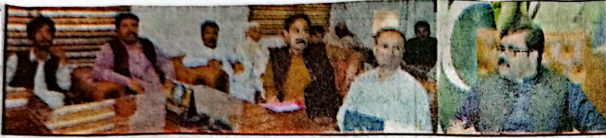
صوبائی وزیر صحت بخت محمد کاکڑ سے مختلف علاقوں سے آئے ہوئے لوگ ملاقات کر رہے ہیں