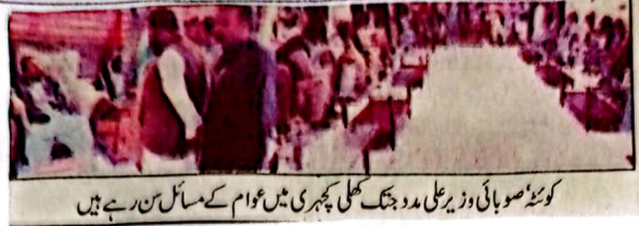
کوئٹہ صوبائی وزیر علی مدد جنگ کھلی پھیری میں عوام کے مسائل سن رہے ہیں