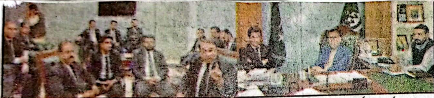
کوئٹہ صوبائی وزیر میر صادق عمرانی سے پاکستان پیپلز لاز فورم کا وفد رستم کا کراچی ڈویژن جلیو آٹا ایڈوکیٹ و دیگر ملاقات کر رہے ہیں