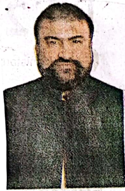
10 - world

Chief Minister Mir Sarfaraz Bugti has expressed his pleasure that the Punjab Textbook Board has decided to adopt Balochistan Textbook Board's initiatives.