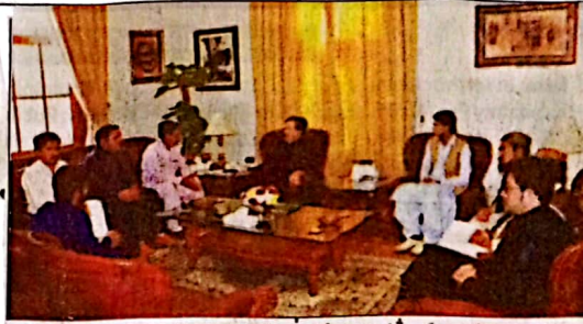
گورنر شیخ جعفر مندوخیل سے مختلف وفد ملاقات کر رہے ہیں

کوئٹہ (خ) گورنر بلوچستان جعفر خان مندوخیل نے کہا ہے کہ بلوچستان وسیع چراگاہوں،