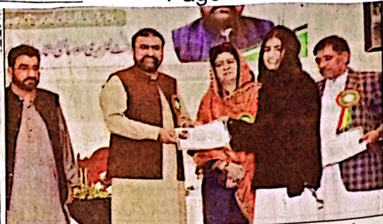
کوئٹہ: وزیر اعلیٰ میر فرزانہ بی بی ایم اقبال کی تقریب میں ایک طالبہ کو شیکٹ دے رہے ہیں

پاکستان کے 11 شہروں سے بیک وقت شائع ہونے والا واحد اخبار جلد نمبر 325، جمعرات، 4 جنوری الاول، 7 نومبر 2024، صفحات 8 قیمت 40 روپے