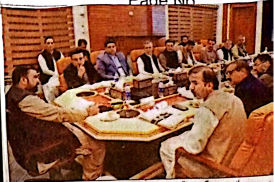
ڈیٹ: وزیراعلیٰ میرسر فراز بگٹی ترقیاتی منصوبوں پر پینتھرفٹ سے متعلق اجلاس کی صدارت کر رہے ہیں