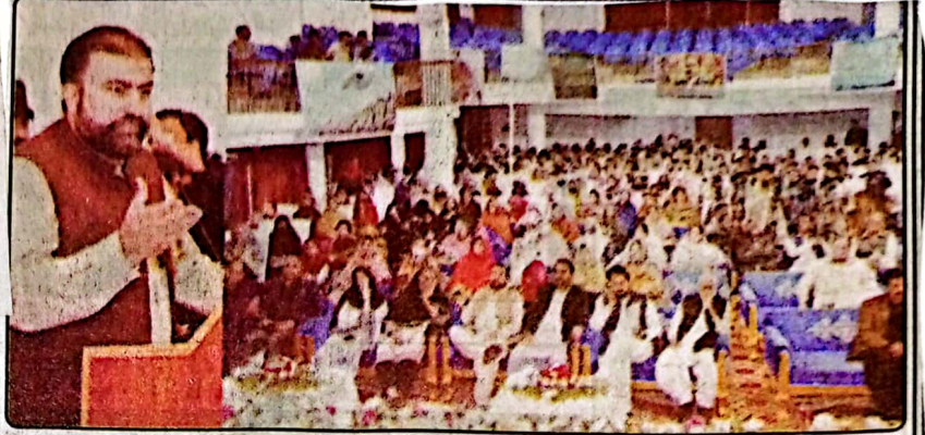
کوئٹہ وزیر اعلیٰ بلوچستان میر سرفراز گلخی نے قیامی منصوبوں پر پیش رفت سے متعلق تقریب سے خطاب کر رہے ہیں