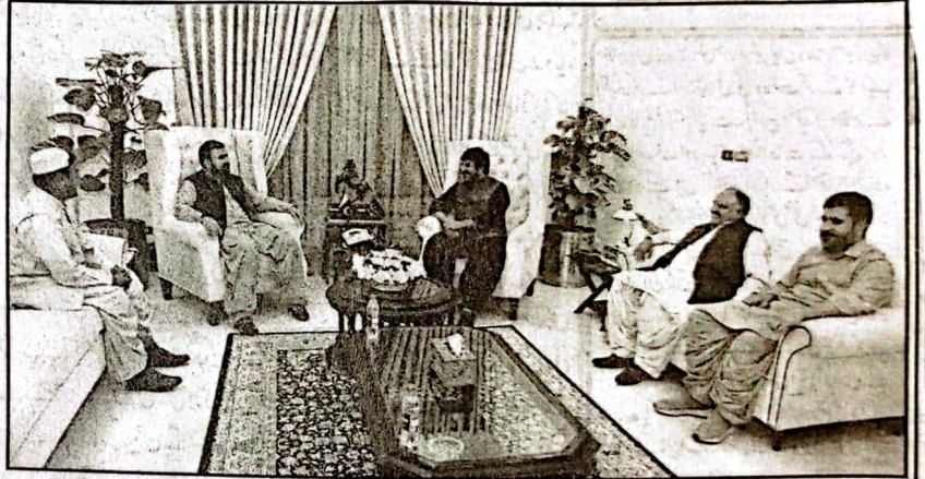
وزیر اعلیٰ بلوچستان میر سرفراز گلخی سے سردار بابا رموی ٹیل، میر فائق جمالی، عالم خان موسیٰ ٹیل، آغا گلگیل درانی ملاقات کر رہے ہیں