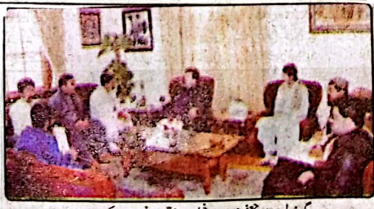
گورنر بلوچستان جعفر خان مندوخیل سے مختلف وفد ملاقات کر رہے ہیں

کوئٹہ (خ) گورنر بلوچستان جعفر خان مندوخیل نے کہا کہ بلوچستان وسیع چراگاہوں، سازگار آب و ہوا اور خاص طور پر مویشی پالنے کے حوالے سے ایک بہت زرخیز خطے ہے جو پورے ملک کے گوشت اور دودھ کی ضرورت کو آسانی پورا کر سکتا ہے اس ضمن میں ڈسٹرکٹ مویشی منڈی مالداری کا ایک بہت بڑا مرکز ہے معیاری و بیٹری کیتر فراہم کرنے کیلئے ضلع مویشی منڈی میں جانوروں کے ہسپتال کا قیام، لائیو اسٹاک کوچہ پر خطوط پر استوار کرنے اور مقامی المالداریوں اور کسانوں کو قومی اور بین الاقوامی منڈیوں تک رسائی دینے کیلئے محسوس اقدامات کی ضرورت ہے ان خیالات کا اظہار انہوں نے پاکستان مسلم لیگ ن کے رہنما نذیر مویشی منڈی کی قیادت میں وفد سے بات چیت کرتے ہوئے کیا اس موقع پر گورنر بلوچستان جعفر خان مندوخیل نے کہا کہ موجودہ حکومت تمام اضلاع میں ایسی یکساں ترقی اور بنیادی ضروریات فراہم کرنے پر یقین رکھتی ہے بلوچستان اعلیٰ نسل کے جانوروں، پرندوں اور چراگاہوں کی سر زمین ہے اور لائیو اسٹاک کے شعبے میں سرمایہ کاری کیلئے پبلک پرائیویٹ پارٹنرشپ کے بھی زیادہ امکانات ہیں گورنر مندوخیل نے کہا کہ یہاں لائیو اسٹاک اور ماہی گیری کوچہ پر خطوط پر استوار کرنے کی اہمیت اور اس کے ذریعے اسے عالمی سطح پر منافع بخش کاروبار کے طور پر ترقی دینی جاسکتی ہے سعودی عرب میں ہرج کی سعادت حاصل کرنے کے مواقع پر لاکھوں قربانی کے جانوروں کی یہ ضرورت صرف ہمارے دو اضلاع اپنے وسائل سے پوری کر سکتے ہیں