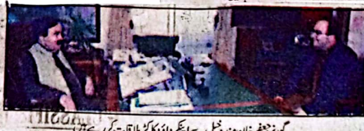
گورنر جعفر خان مندوخیل سے ایگریکراؤڈ کا ملاقات کر رہے ہیں