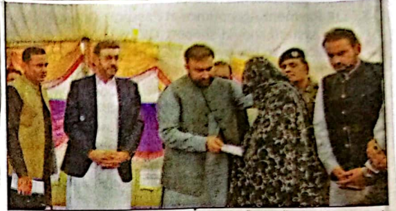
کوئٹہ: وزیر اعلیٰ میر سرفراز خان نے شجاع آباد کے 7 شہداء کے لواحقین کو امدادی چیک دے رہے ہیں

شجاع آباد (خ) وزیر اعلیٰ بلوچستان میر سرفراز خان نے جمعرات کو ملتان کی تحصیل شجاع آباد کا دورہ کیا اور چنگور واغے کے 7 شہداء کو رتھ میں 15، 15 لاکھ کے امدادی چیکس تقسیم کئے 28 ستمبر کو بلوچستان کے قلع چنگور میں دہشت گردوں نے شجاع آباد کے 7 مزدوروں پر فائرنگ کر کے انہیں شہید کر دیا تھا وزیر اعلیٰ بلوچستان نے ساتھ چنگور کے شہداء کے لواحقین سے اظہارِ تعزیت کرتے ہوئے انہیں یقین دلایا کہ دلچراش واقعے میں لوٹ دہشت گردوں کو قرار دیا جائے گا اور سزا دلائیے گئے جبکہ متاثرہ فیملیز کی معاونت کے ساتھ ساتھ شہداء کے بچوں کے 16 سال تک کے تعلیمی اخراجات حکومت بلوچستان برداشت کرے گی اس موقع پر سید یاکے نمائندوں سے گفتگو کرتے ہوئے میر سرفراز خان نے کہا کہ انہوں نے ہونا ہونا واقعے میں کی بلوچ نے سرائیکی یا پنجابی کو قتل نہیں کیا بلکہ دہشت گردوں نے پاکستانیوں کو شہید کر کے صوبوں میں نفرت پھیلانے کی مذموم کوشش کی جسے پاکستان کے عوام نے ناکام بنا دیا۔ وزیر اعلیٰ نے کہا کہ واقعے میں لوٹ چند دہشت گردوں کو قانون کی گرفت میں لیا جا چکا ہے جبکہ دیگر کی گرفتاریوں کیلئے قانون حرکت میں ہے میر سرفراز خان نے کہا کہ بلوچستان میں ہونیوالے دہشت گردی کے واقعات میں بھارتی خفیہ ایجنسی راء لوٹ ہے جسکے ڈوز بیز ہم عالمی سطح پر دے چکے ہیں۔ وزیر اعلیٰ بلوچستان نے کہا کہ بلوچ قوم روایات کی این ہے اور وہ اس واقعے پر خود بھی