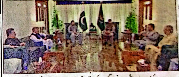
کوئٹہ: وزیر اعلیٰ میر سرفراز خان نے کوئٹہ چیمبر آف کامرس کا وفد ملاقات کر رہا ہے