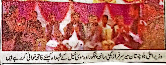
وزیر اعلیٰ بلوچستان میر سرفراز خان نے شجاع آباد کے 7 شہداء کیلئے فاتحہ خوانی کر رہے ہیں