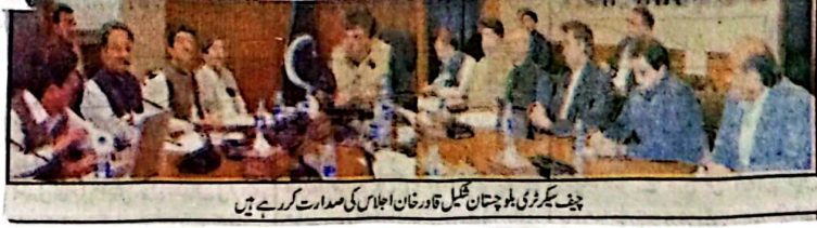
چیف سیکرٹری بلوچستان گل خان قاری کی صدارت میں