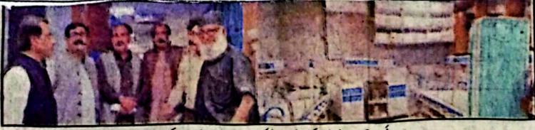
سویاں آڈیو برصحت بخت جو کازرسول ہسپتال کوئٹہ میں رن ہونے کا سائن کر رہے ہیں