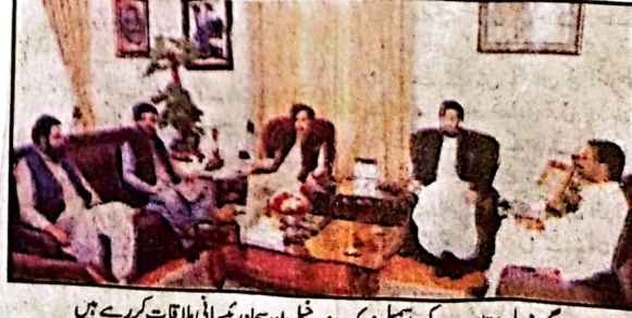
گورنر بلوچستان سے رکن اسمبلی زوک مندوخیل اور عوامی مسائل ملاقات کر رہے ہیں