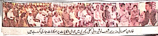
خاران سوہائی وزیر شہباز نوری دانی علی پکیری میں عوامی شکایات پرامکانات جاری کر رہے ہیں