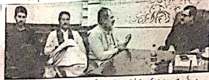
سوہائی وزیر شہباز نوری دانی علی پکیری میں عوامی شکایات پرامکانات جاری کر رہے ہیں