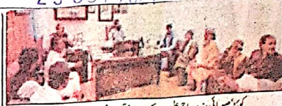
کوئٹہ سوہائی وزیر سماجی عمل و تدبیر سے مختلف ڈیولپمنٹات کر رہے ہیں