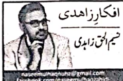
افکار زاہدی نسیم الحق زاہدی

ان کے کوئی میڈیکل کالج میں انٹرنیٹ نہ تھے جس میں پورے بلوچستان سے تعلق رکھنے والے نصاب، طالبات کی شرکت لازم تھی مگر روڈ بند ہونے کی وجہ سے کو اور نہیں، چیکان جیونی، اور ماڑہ اور منگور کی بہت سی طالبات کوئی نہیں پہنچ پاتیں، جبکہ اس ٹیسٹ کے لیے انہوں نے دو سال مسلسل دن رات تیاری کی تھی۔ تربت پبلک کے ایک رہائشی نے بتایا کہ اسی بیک شاہراہ بند ہونے کی وجہ سے گاڑیوں کی لہی قطاریں گئی ہوئیں جس میں خواتین اور بچے بھی شامل تھے اور ان میں سے کئی بچی بیمار تھیں۔ قاتلوں لگتا تھا کہ جیسے ہم کر بلا میں ہیں۔ بے بھوک سے معاملہ ہو چکے تھے۔ اسی طرح قلات کے ایک رہائشی نے بتایا کہ ہم دیہاتی اور مزدور لوگ ہیں، روڈ بند ہونے کی وجہ سے کئی دنوں سے سیرے مگر میں قاتل چل رہی ہے، ہمارے سامنے ایک مریض جس کی ایبویٹس کو راستہ نہیں دیا اور وہ تڑپ تڑپ کر ایبویٹس میں وفات پا گیا۔ بزرگ کا سلیمان تالی میں نے ویڈیو پیغام میں بتایا کہ اس کا کم عمر نواسہ جو کہ سول اسپتال گوار میں زیر علاج تھا مگر اس کی طبیعت بگڑنے کی وجہ سے ہم اسے کراچی لے کر جا رہے تھے مگر ٹریک چھیننے تک اس کی طبیعت مزید بگڑ گئی ہم نے بچے کو تربت ہسپتال لیجانے کا فیصلہ کیا۔ مگر جب ہم تربت ڈی بلوچ پہنچے تو تک دشمن، وہشت گردوں، قاتلوں اور مجرموں کے لیے سراپا اجتاج تھے، میں نے ان کو بتایا کہ میرا نواسہ سرسیکس حالت میں ہے جسے آسپن لگی ہوئی ہے، ہمیں راستے دہتا کہ ہم اسے ہسپتال لے جائیں مگر ہمیں راستہ نہیں دیا گیا۔ مجبور ہو کر ہم نے دوسری جانب کمری بلان گاڑی کرائے