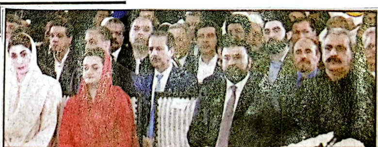
اسلام آباد، چیف جسٹس آف پاکستان جناب جسٹس یحییٰ آفریدی کی تقریب حلف برداری میں وزیر اعلیٰ بلوچستان میرسر فرانز گنٹی اور دیگر شخصیات شریک ہیں

کوئٹہ (خبر) وزیر اعلیٰ بلوچستان میرسر فرانز گنٹی نے کہا ہے کہ 27 اکتوبر کا دن کشمیر پر بھارت کے