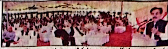
گورنر جعفر مندوخیل کلیم اللہ ہیلتھ فاؤنڈیشن کی تقریب کے شرکاء سے خطاب کر رہے ہیں

جعفر مندوخیل کی جنس بجٹی آفریدی کو چیف جسٹس کے عہدے پر تعیناتی پر مبارکبادیں تیناؤں کا اظہار