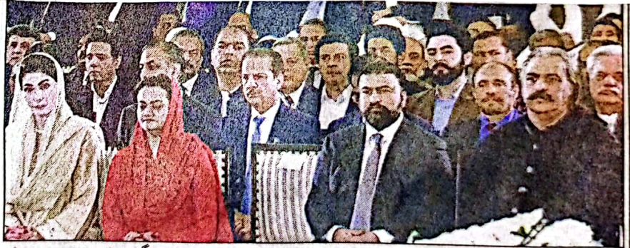
اسلام آباد، جان چیف جسٹس پاکستان جسٹس جی جی آفریدی کی تقریب حلف برداری، وزیر اعلیٰ بلوچستان میر سر فرزانہ بیگم اور دیگر شخصیات شریک ہیں

اسلام آباد (خ ن) وزیر اعلیٰ بلوچستان میر ایوان صدر میں منعقد ہونے والی تقریب میں وزیر اعلیٰ بلوچستان میر سر فرزانہ بیگم نے اپنے ایک بیان میں آفریدی کی تقریب حلف برداری میں شرکت کی نوازا، وزیر اعلیٰ خیر بختو خواجہ اعلیٰ امین گنڈا پور و دیگر