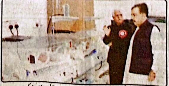
گورنر جعفر خان مندوخیل ڈاکٹر کلیم اللہ ہیلتھ فاؤنڈیشن ہسپتال میں این آئی سی یو کا معائنہ کر رہے ہیں