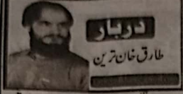
دوبار طارق خان ترین

مظہر جموں و کشمیر کے مسئلے کو عالمی سطح پر اجاگر کرنے کے لیے دنیا بھر کے کشمیری برسرِ سال 27 اکتوبر کو سیاہ کے طور پر مناتے ہیں۔ یہ دن 1947 میں بھارتی فوجیں ریاست میں داخل ہوئیں اور اس پر غیر قانونی قبضہ کیا گیا۔ اس قبضے کو کشمیر کی تاریخ میں ایک سیاہ ترین دن کے طور پر یاد کیا جاتا ہے۔ کوشش ہو کہ صدیوں کے دوران بھارت نے مظہر جموں و کشمیر میں ظلم و ستم کی ایک طویل تاریخ رقم کی ہے جس میں نہ صرف انسانی حقوق کی سنگین خلاف ورزیاں شامل ہیں بلکہ کشمیری عوام کی شناخت اور ان کی مذہبی و ثقافتی آزادی پر بھی شدید نقصان لگائی گئی ہے۔ یہ قبضہ نہ صرف غیر قانونی ہے بلکہ اس نے کشمیریوں کے عزم کو مزید مستحکم کیا ہے کہ وہ کبھی بھی اس غاصبانہ قبضے کو قبول نہیں کریں گے۔ 27 اکتوبر کا دن اقوام متحدہ کی اس قرارداد کی یاد دلاتا ہے جس میں کشمیری عوام کو ان کا حق خود ارادیت دینے کا عزم کیا گیا تھا۔ اس دن کے موقع پر کشمیری یہ پیغام دیتے ہیں کہ ان کا عزم متزلزل نہیں ہوگا اور وہ اپنی آزادی کے حصول کے لیے ہر ممکن جدوجہد جاری رکھیں گے۔ کشمیریوں کے نمائندہ پلیٹ فارم، حریت کانفرنس کے مطابق، کشمیر کا مسئلہ خطے کے دیرپا امن اور ترقی کے لیے اہمیت رکھتا ہے۔