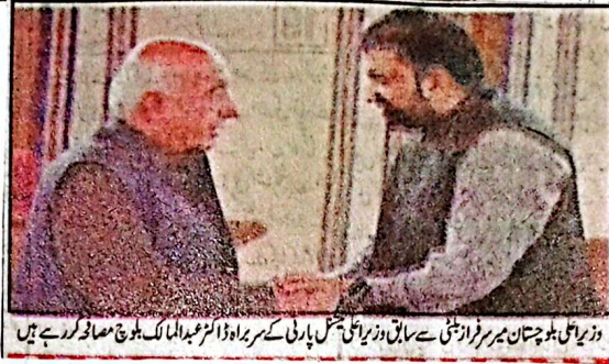
وزیر اعلیٰ بلوچستان میر سرفراز بٹنی سے سابق وزیر اعلیٰ گل پارٹی کے سربراہ ڈاکٹر عبدالملک بلوچ مصافحہ کر رہے ہیں