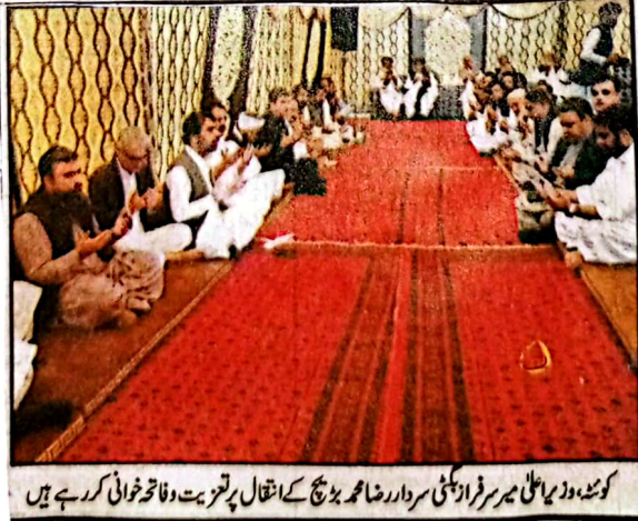
کوئٹہ، وزیر اعلیٰ میر سرفراز گیلٹی سردار شاہمہ بیچ کے انتقال پر تعزیت و فاتحہ خوانی کر رہے ہیں