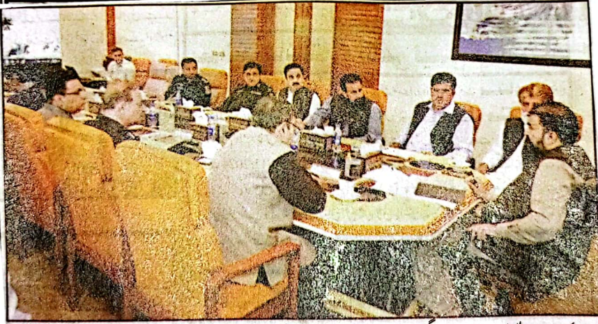
کوئٹہ، وزیر اعلیٰ بلوچستان میر سرفراز گیلٹی صوبے میں مقبوضہ اراضیات کو واپس لے کر آنے سے متعلق جائزہ اجلاس کی صدارت کر رہے ہیں

کی مذمت کرتے ہوئے کہا ہے کہ پاکستان کی فورسز دہشت گردی کی عفریت سے نمٹنے کیلئے پوری بہادری سے لڑ رہی ہیں قومی سلیت کی اس جنگ میں فورسز کے بہادر جوانوں نے اپنی جانوں کا نذرانہ پیش کر کے ملک و قوم کے دفاع کو یقینی بنایا ہے فرخینگر کانسٹیبلری کے جوانوں کی شہادت فورسز کی طویل قربانیوں کا تسلسل ہے پوری قوم اپنی سکورٹی فورسز کے ساتھ کھڑی ہے اسے جاری ایک بیان میں وزیر اعلیٰ بلوچستان میر سرفراز گیلٹی نے درازندہ میں جام شہادت نوش کرنے والے بہادر جوانوں کو خراج عقیدت پیش کرتے ہوئے کہا کہ قوم کو اپنے شہداء پر فخر ہے جنہوں نے اپنی زندگی قوم کے لئے نچھاور کر دی شہداء کی انہی لازوال قربانیوں کے باعث عالمی سازشوں کے باوجود وطن عزیز کی سلامتی اور تحفظ کو یقینی بنایا گیا ہے، میر سرفراز گیلٹی نے شہداء کے خاندانوں سے ہمدردی کا اظہار کرتے ہوئے کہا کہ وطن عزیز کا ہر فرد اپنے ان شہداء کے خون کے ہر قطرے کا مقروض ہے جنہوں نے اس دھرتی اور عوام کے لئے اپنی جانوں کا نذرانہ پیش کیا۔